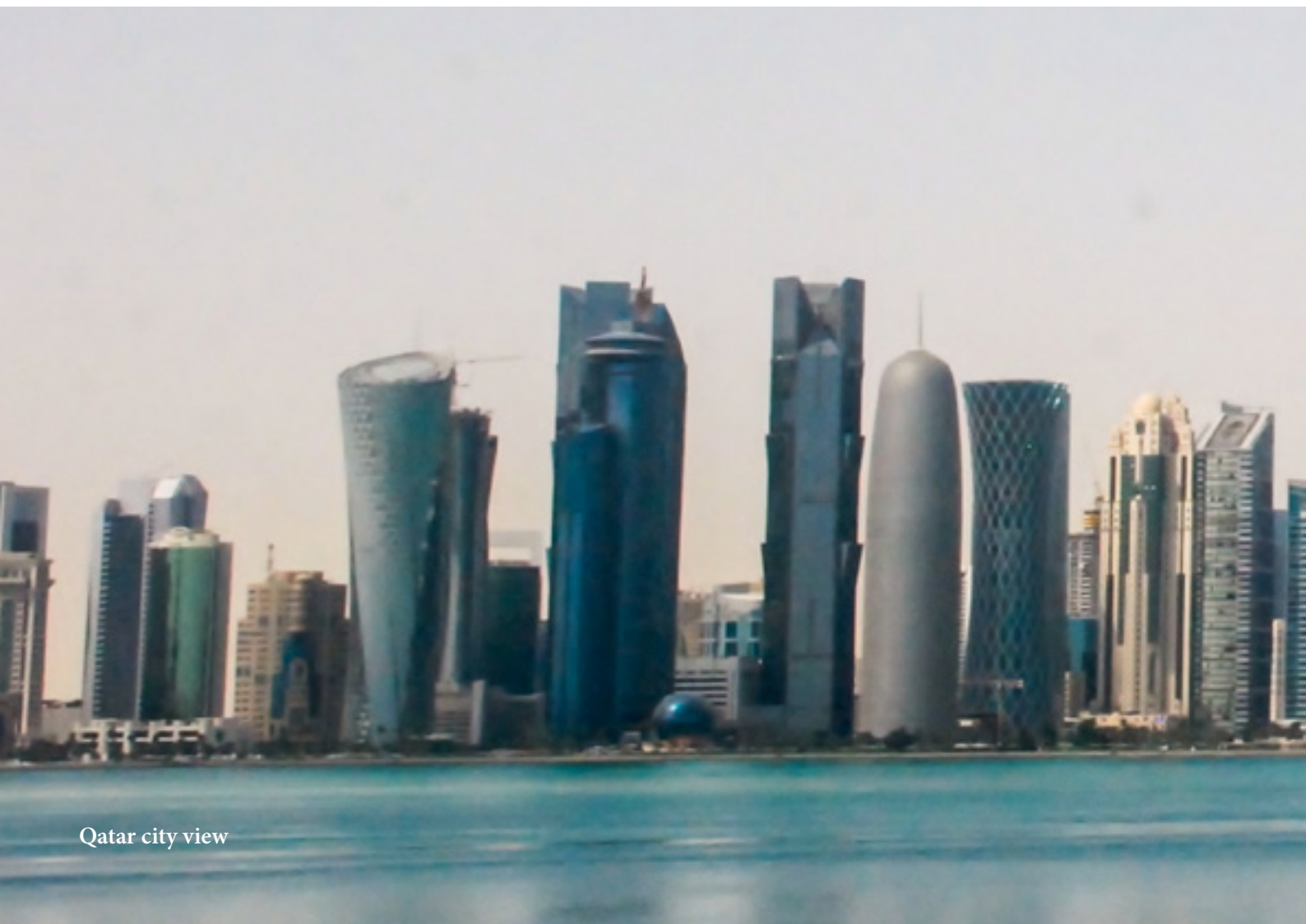
Qatar city view