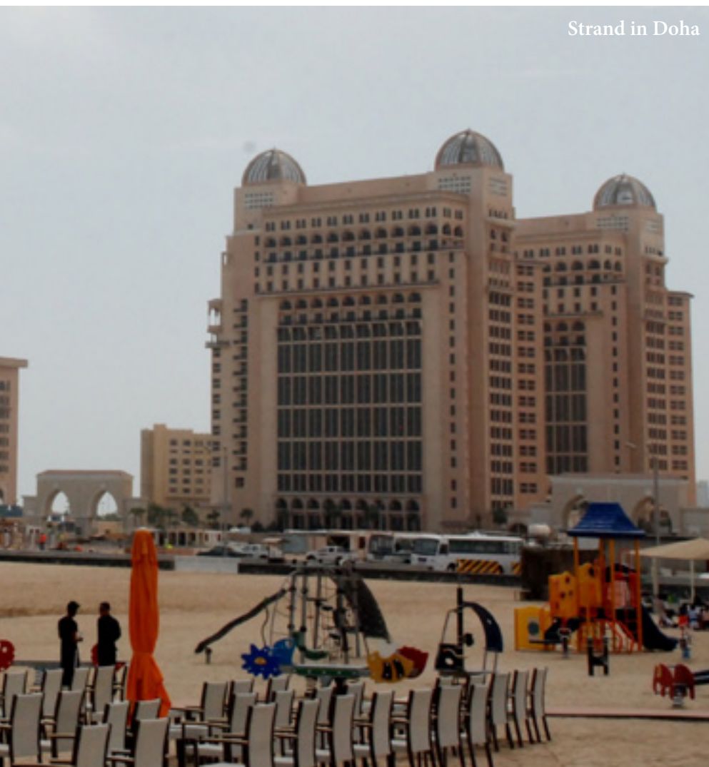
Strand in Doha