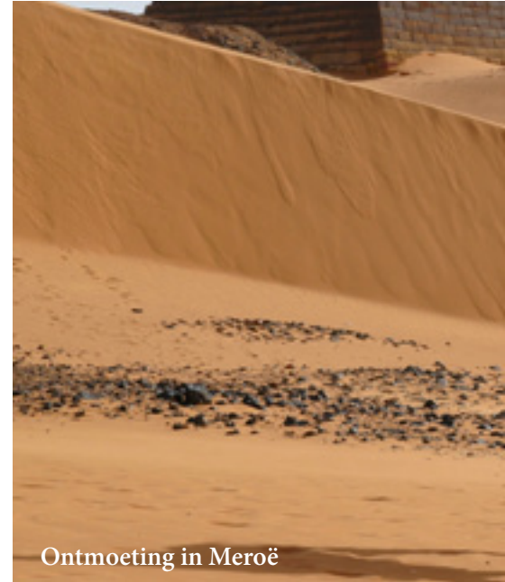
Ontmoeting in Meroë

de dag off-road door de woestijn en maken kennis met het leven van de bedoeïenen, stoppen bij waterputten die een verzamelplaats zijn van mens- dier, bezoeken plaatselijke schooltjes. In Naga ontdekken we de Apedemak-tempel met prachtige bas-reliëfs in zuivere Egyptische stijl, de Amon-tempel, geflankeerd door gebeeldhouwde rammen en de “Romeinse kiosk” met