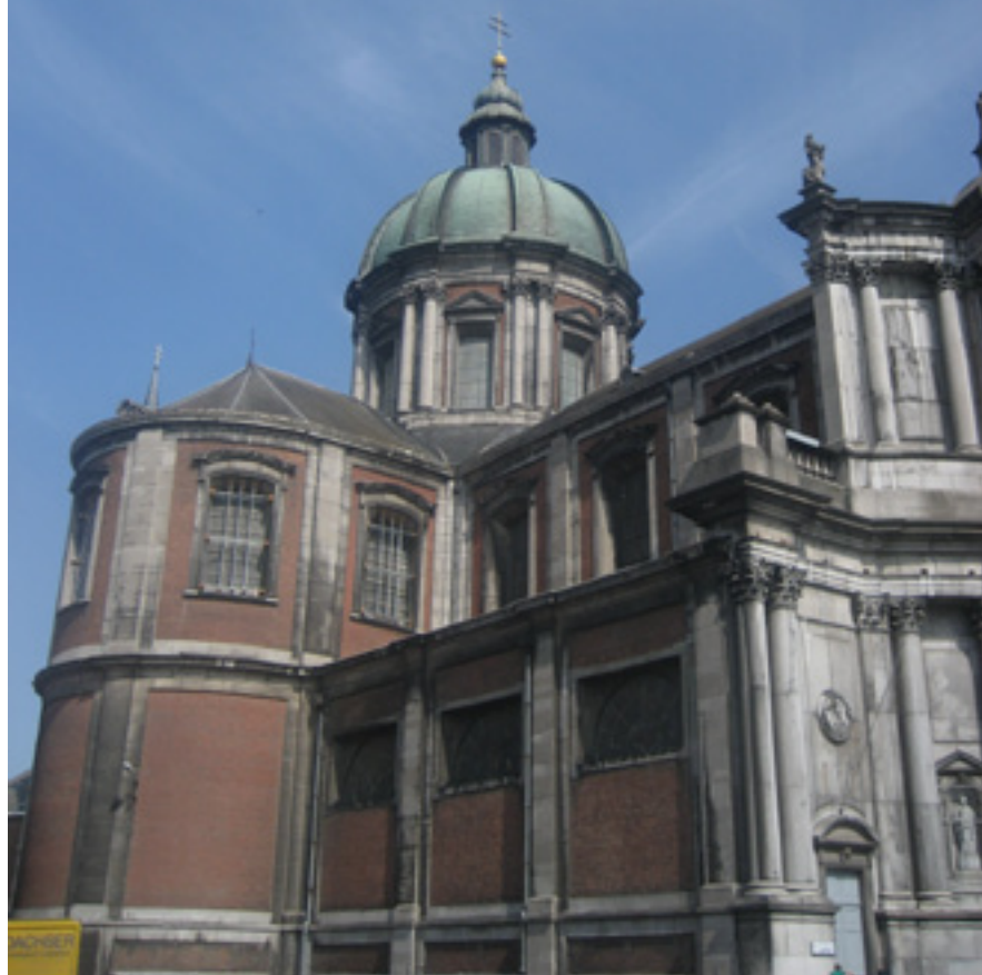
La cathédrale Saint-Auban

Passer un week-end à Namur, c'est découvrir une ville aux ressources hôtelières et gastronomiques abondantes et variées, l'histoire de ses habitants, une élégante ville et les petites boutiques du piétonnier ; c'est monter à la citadelle, passer une soirée au théâtre, jouir d'une croisière sur la Meuse. Tout cela à proximité de chez soi ! N'est-ce pas un atout dont il serait insensé de se priver ?