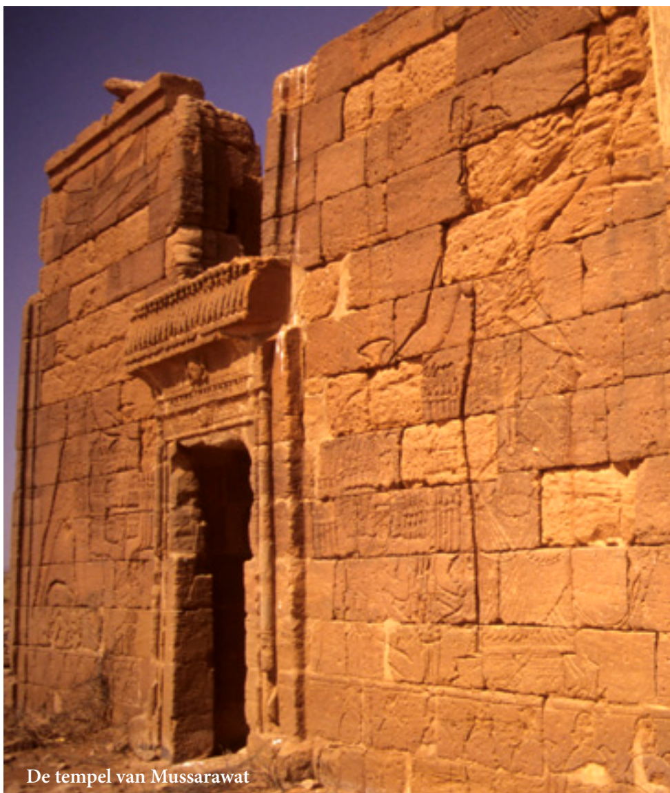
De tempel van Mussarawat

Nog onder de indruk van de bezienswaardigheden in Meroë en Naga vertrekken we naar de Bayoda woestijn en bereiken in de vooravond Karima. Het charmante en ecologisch ingerichte Karima Resthouse ligt aan de voet van de Heilige Berg Jebel Barkal en is gebouwd in de typische Nubische stijl met bogen en koepels. De temperaturen liggen hier iets hoger dan in Meroë. Om de verzengende middaghitte te vermijden beginnen we al vroeg aan het bezoek van de Heilige Berg Jebel Barkal. De rotstempel van Taharqa en de grote tempel van Amon behoren tot de beste bewaarde getuigen van het verleden van Soedan. We beklimmen de 100 meters hoge berg van waaruit we een uniek zicht hebben op het tempelcomplex. We volgen het ritme van de plaatselijke bevolking en nemen een welverdiende siësta. In de late namiddag bezoeken we El-Kurru, een begraafplaats, met piramides en koninklijke tumuli. De schitterend bewaard gebleven tekeningen en teksten in puur Egyptische stijl op de muren van de kleine onderaardse grafkamer van koningin Kalhata zijn indrukwekkend en van een buitengewone schoonheid en kunnen moeiteloos concurreren met deze in Egypte. Niet ver daar vandaan liggen fossiele bomen, restanten van een miljoenen jaren oud oerbos. Na het hoogtepunt van de vorige dag zoeken we wat ontspanning op de markt van Karima, waar we de Nubische