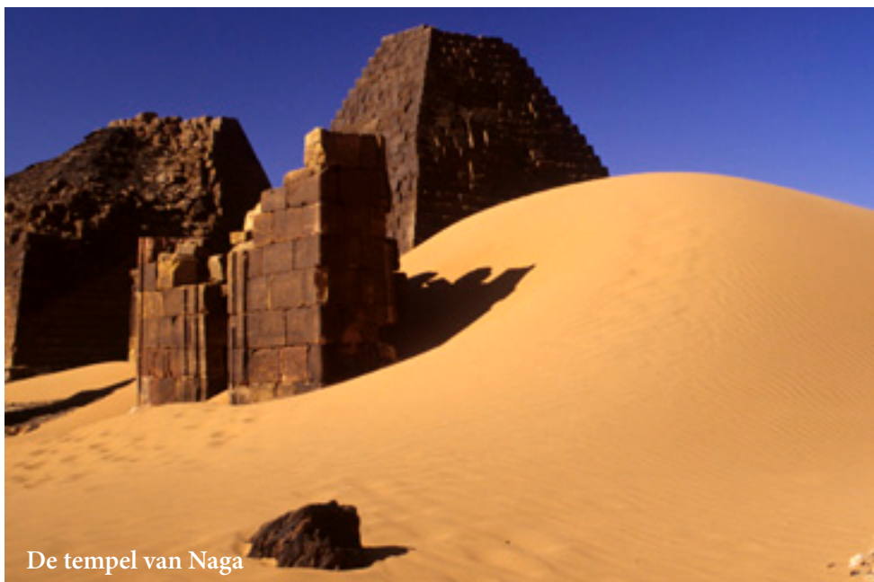
De tempel van Naga