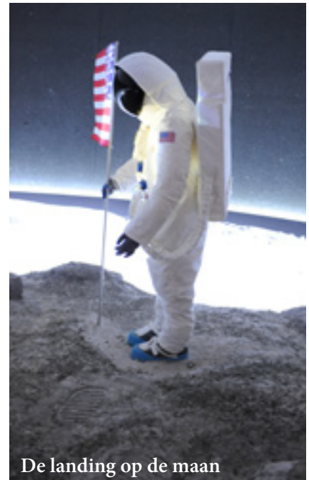
De landing op de maan