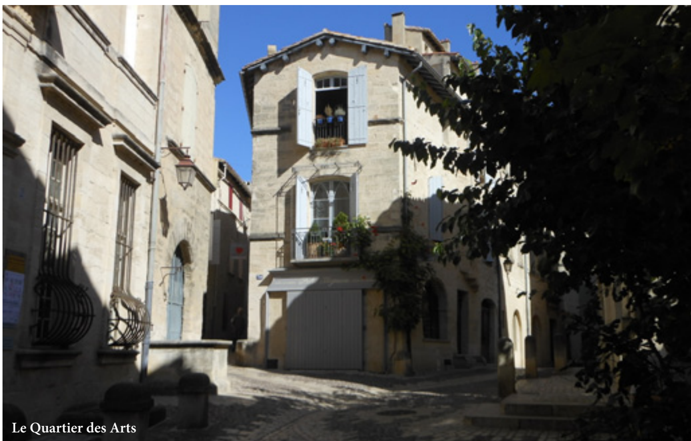
Le Quartier des Arts

de sa collection de statues et de toiles. Quelques-unes de ses compositions ornent ce musée atypique où l'on admire presque côte à côte une époustouflante chaise à porteurs, les célèbres meubles peints de paysages ou de scénettes, une spécialité des ébénistes d'Uzès et de sa région, quelques tableaux de belle facture évoquant Uzès d'antan et diverses poteries antiques et anciennes ainsi de des vitrines qui regorgent de céramiques diverses. Dans ses petites villes, le Gard recèle des « cavernes d'Ali Baba ». Une salle du musée est consacrée à l'auteur, prix Nobel de Littérature, André Gide et à sa famille, surtout « Oncle Charles ». Si l'on descend par les jolies ruelles du quartier des arts où il n'est pas vraiment indiscret de pousser une porte vénérable pour découvrir une cour intérieure inattendue, on arrive en vue de la silhouette d'un impressionnant donjon : le Duché, seul château de France à porter ce titre et preuve dans la pierre de l'ascension sociale des seigneurs de la Maisons d'Uzès. A partir de la vaste cour on peut se joindre à une visite guidée qui permet d'admirer quelques très belles salles intérieures à moins