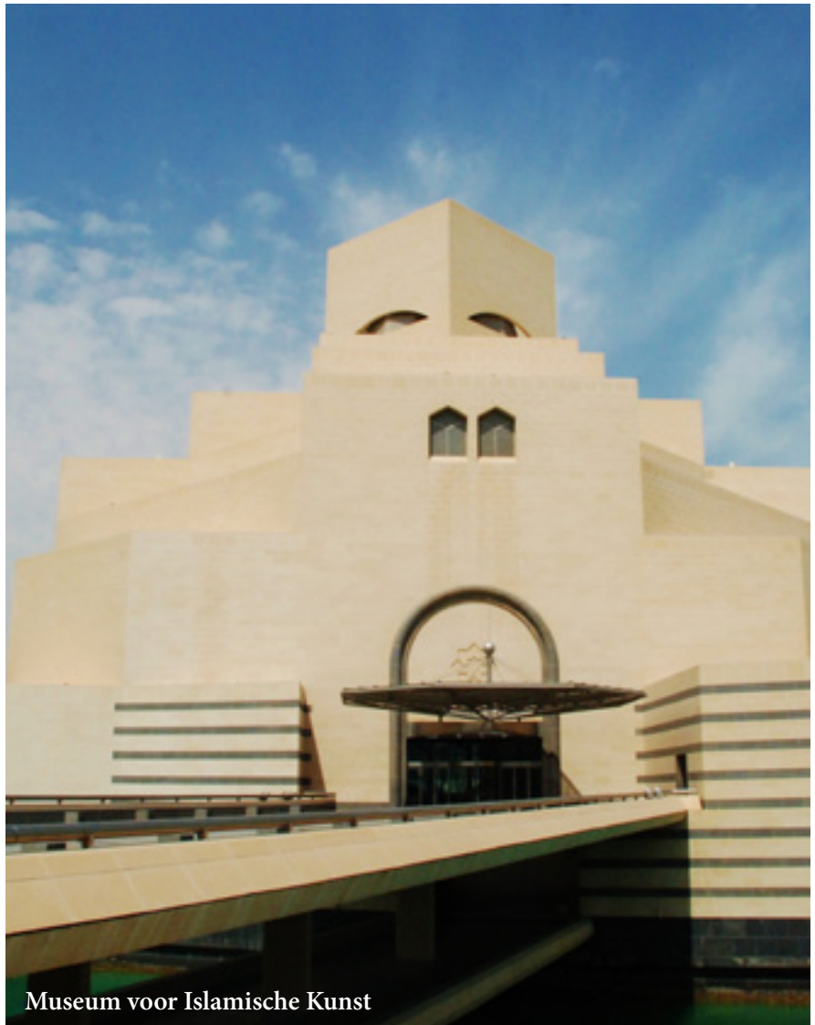
Museum voor Islamische Kunst

Bij aankomst op de luchthaven van Doha, krijgt u een visum in uw internationaal paspoort voor 20 €. Vriendelijk zijn ze er niet echt. Je moet ook op een gemarkeerde plaats staan en in recht in een camera kijken, want van iedere persoon wordt er een foto gemaakt (van de ogen /irissen). Een goede raad: indien je als toerist een aantal naburige landen na elkaar bezoekt, begin dan met Qatar. Het kan dan alleen NOG beter worden!