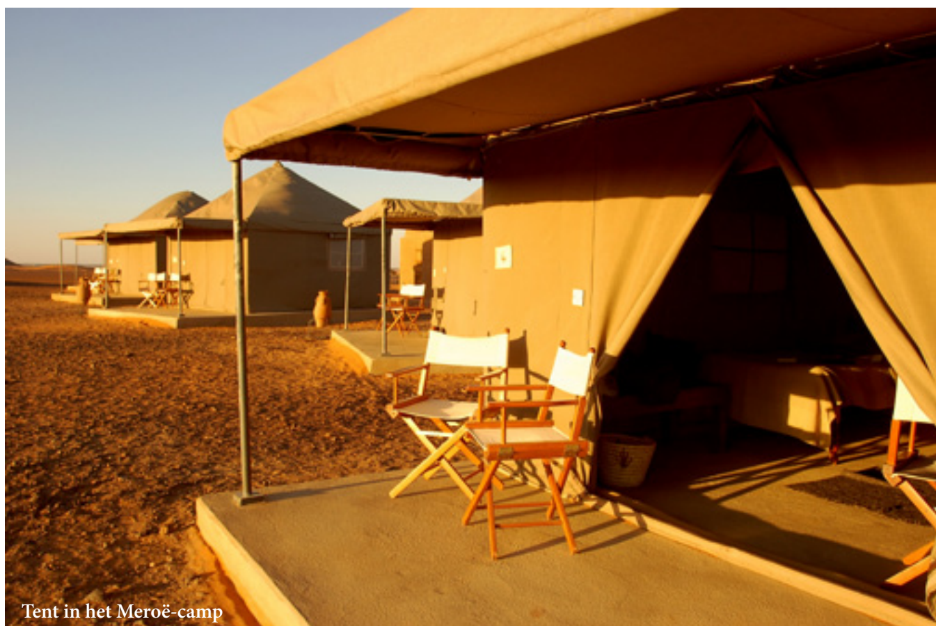
Tent in het Meroë-camp

midden een weids woestijnlandschap het permanente tentenkamp Meroë waar we 3 nachten zullen slapen. Het ligt vlak aan de indrukwekkende necropolis van Meroë en bestaat uit 10 luxueuze en uiterst gezellig ingerichte tenten met douche en toilet. Elke tent heeft een veranda met twee comfortabele stoelen