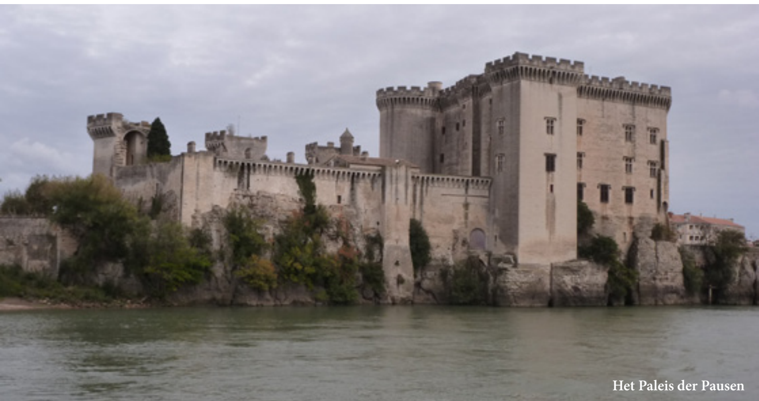
Het Paleis der Pausen