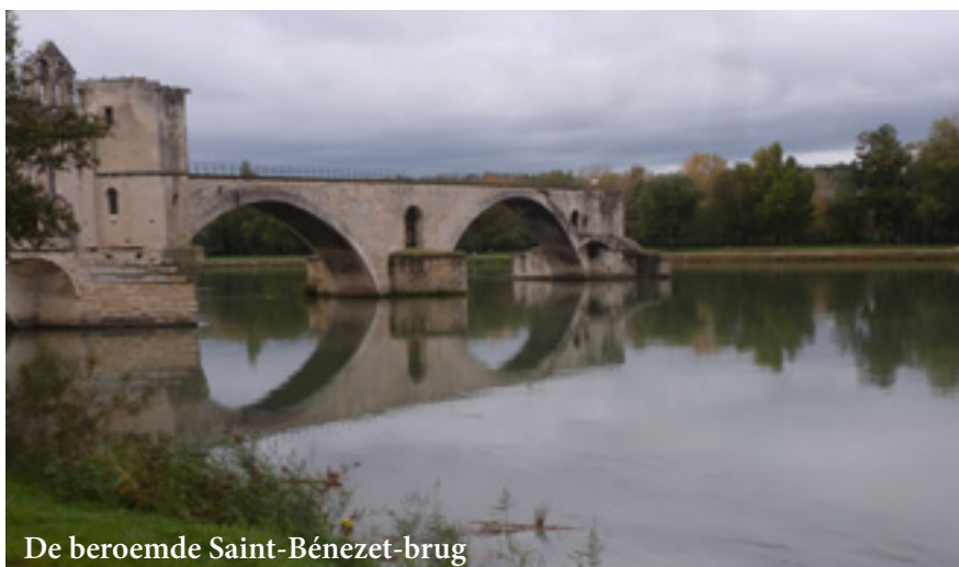
De beroemde Saint-Bézénet-brug