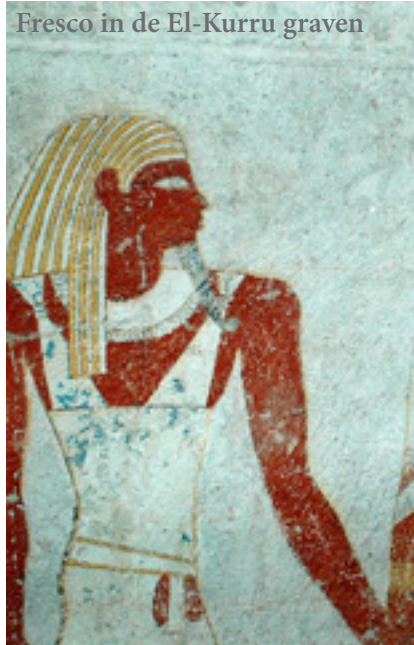
Fresco in de El-Kurru graven

Na een goede nachtrust, die toch even werd onderbroken door de dagelijkse nachtelijke zandstorm, nemen we een stevig ontbijt en vertrekken naar de necropolis van Meroë en de Koninklijke Stad. Meroë was de tweede hoofdstad van de schitterende beschaving van het rijk van de Koesh. De necropolis van Meroë omvat meer dan 20 piramides omgeven door een immense zandvlakte en voorafgegaan door merkwaardige grafkapellen. De grafkamer bevindt zich onder de massieve piramide. Veertig kilometer hier vandaan niet ver van de Nijl ligt de Koninklijke Stad van Meroë. Zij had een ommuurd gedeelte waar zich het paleis en enkele regeringsgebouwen bevonden. We kunnen hier het werk van Duitse archeologen volgen die beetje bij beetje het verleden van deze grote cultuur opnieuw aan de oppervlakte brengen. Deze dag is het eerste hoogtepunt van deze reis. De weg naar de mooiste Meroïtische sites van Naga is op zich al een belevenis. We rijden het grootste gedeelte van