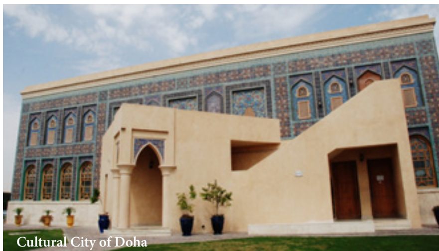
Cultural City of Doha

genoemd, is een archeologische site uit de 18de eeuw op 100 km van de hoofdstad. - Barzan Towers. Er werd gezegd dat de parelduikers deze torens reeds konden zien toen ze huiswaarts keerden van hun duikwerk. Oorspronkelijk waren de torens ook uitkijktorens met drie verdiepingen en een buitentrap. Deze zijn nu volledig gerestaureerd en kunnen bezichtigd worden. - Zubara, op 110 km van Doha, is gekend voor zijn oud fort, één van Qatar's meest bekende historische sites uit de 18de eeuw. Het was nog een handelspost tussen de Straat van Hormuz en het westerse gedeelte van de Perzische Golf. Twintig jaar geleden werd het gerestaureerd en is nu omgebouwd tot het Al Zubara Regionaal Museum. Doha huisvest ook "Education City", een gebied geheel gewijd aan research,