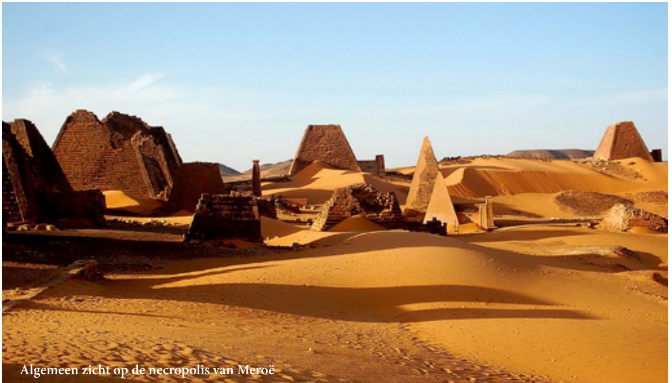
Algemeen zicht op de necropolis van Meroë

bevolking ontmoeten, het leven in een woestijnstad kunnen ervaren en genieten van de plaatselijke thee. Een aangename en ontspannen boottocht op de Nijl mag zeker niet ontbreken. Op een eilandje worden we gastvrij ontvangen bij de enige familie die het eiland permanent bewoont. Na de lunch, wanneer de grootste hitte voorbij is, varen we terug naar Karima en rijden noordwaarts door de woestijn naar de grootste piramide van de Nubische beschaving in Nuri.