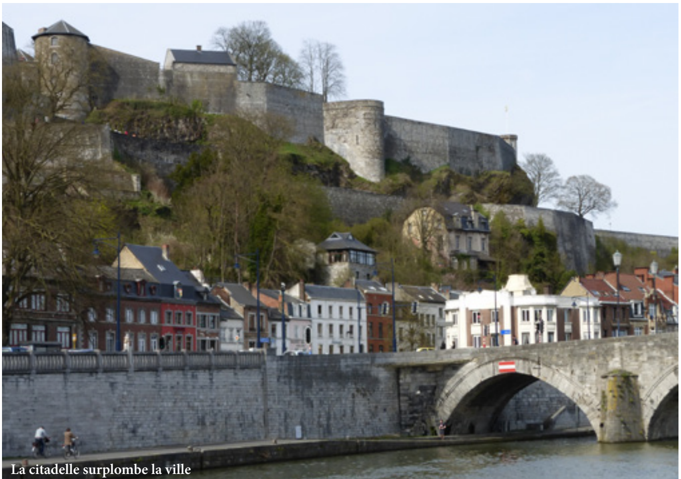
La citadelle surplombe la ville

Namur connaît une réelle urbanisation à l'époque des Romains. Le site est stratégique et se développe rapidement. Suivent les raids des Vikings et des Normands. Au 10 e siècle, s'installe dans son château dressé en haut du promontoire, le premier comte de Namur et en 1421, le dernier, ruiné vend la ville à Philippe le Bon, duc de Bourgogne.