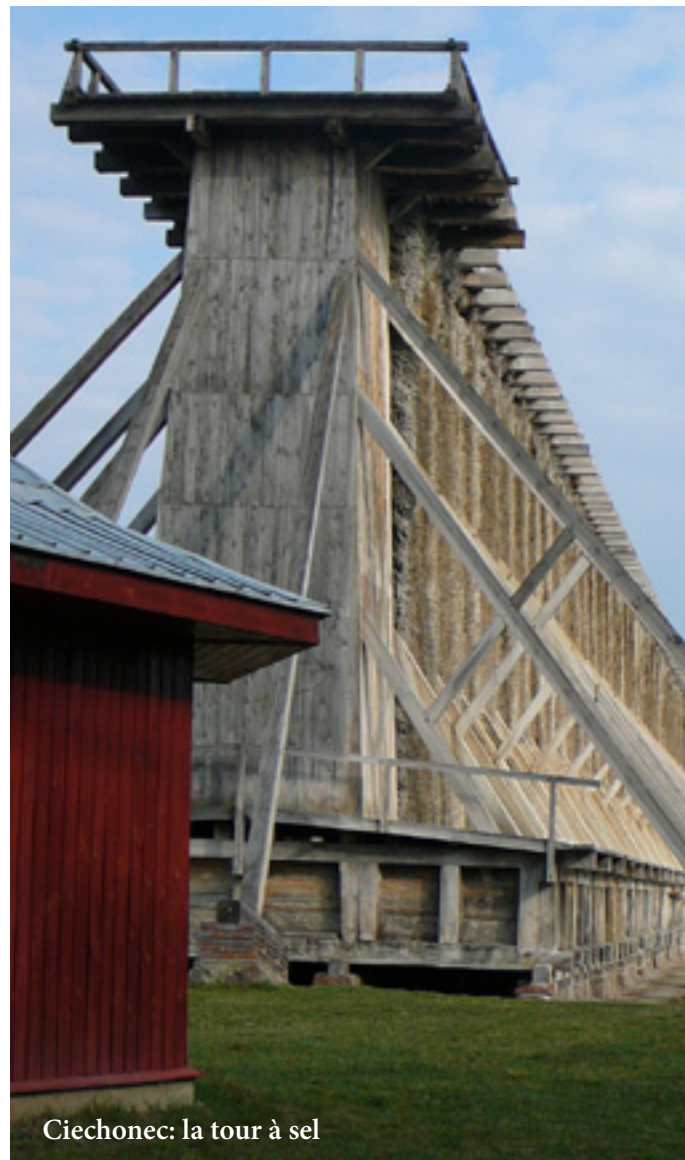
Ciechonec: la tour à sel