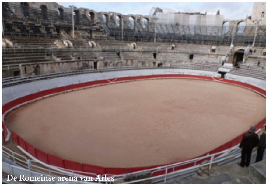
De Romeinse arena van Arles