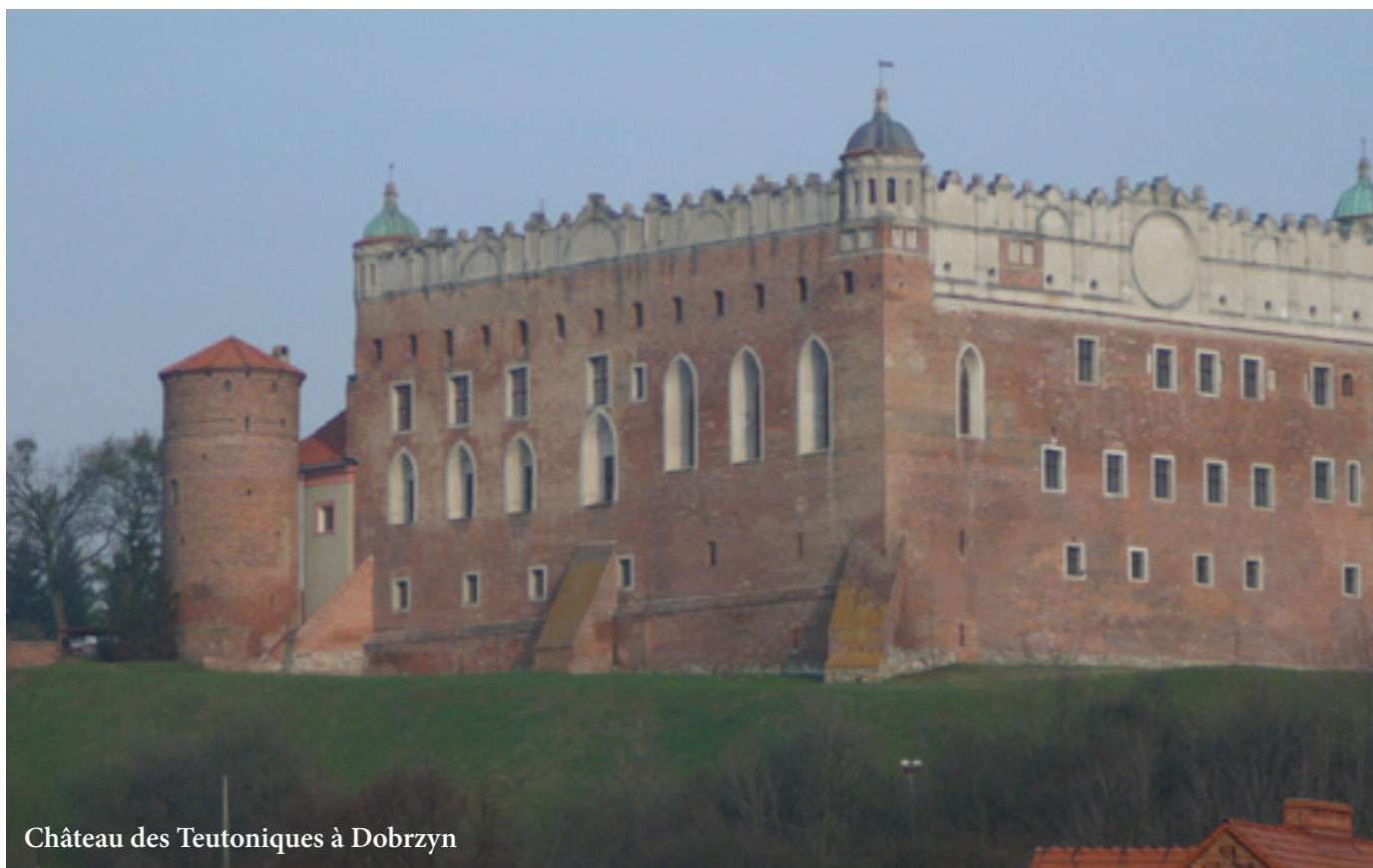
Château des Teutoniques à Dobrzyn

restaurants, un hôtel. Le championnat du monde de jogging y a lieu. Avec ses 3 millions de visiteurs par an, c'est un véritable poumon vert. Un petit train électrique fait le tour du domaine.