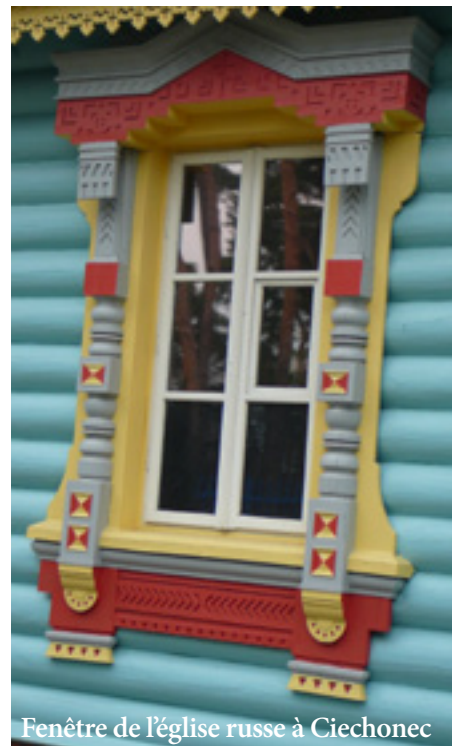
Fenêtre de l'église russe à Ciechonec

L'île du Moulin est une oasis verte située au cœur de la ville. On y trouve tout ce qu'on peut espérer comme activités de plein air, et même une plage avec le sable de la mer Baltique. Plusieurs musées sont installés dans des moulins et des greniers à blé du XIXe siècle. La promenade en navette fluviale autour de la ville est une grande attraction. Il y a aussi le Lesny Park avec un zoo, un parc de loisirs pour enfants, des pistes de vélo et une pour le ski, un centre équestre, un minigolf, des salles de concerts, des