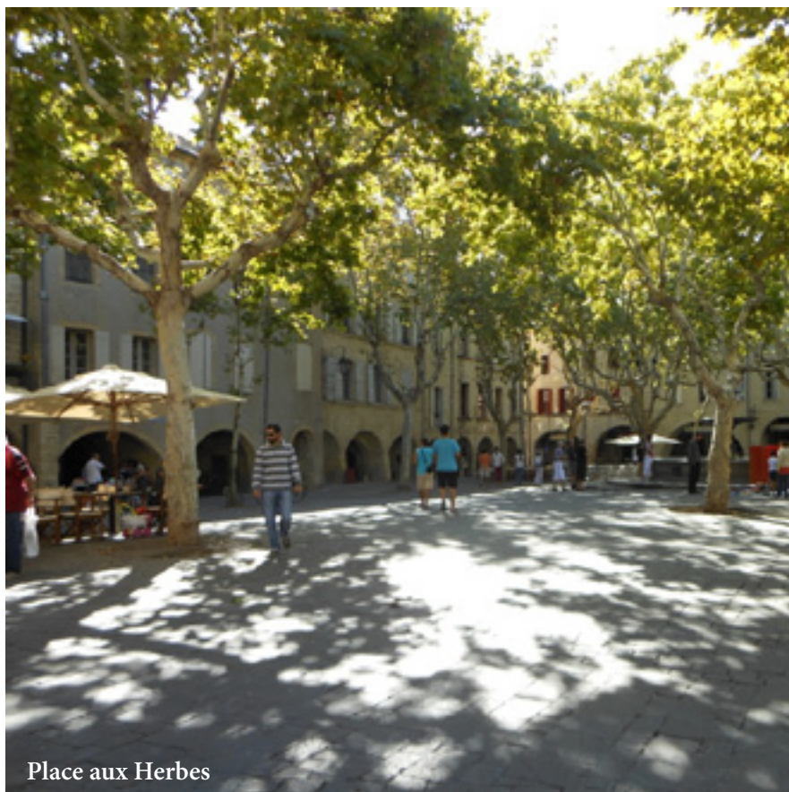
Place aux Herbes

De tous les temps, l'eau fut un facteur important de civilisation et le site d'Uzès avait la chance d'être à proximité des sources de l'Eure. Les Ligures vécurent paisiblement sur le site quand au Ve siècle avant Jésus-Christ, les envahisseurs celtiques entendirent partager les lieux. Mais la terre était riche et le lieu urbain également car nœud commercial, indispensable passage (payant) pour les Grecs allant chercher dans les Cévennes les minerais nécessaires à leurs industries.