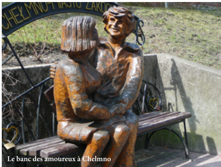
Le banc des amoureux à Chełmno

Pour toute information, contactez Joanna Lupinska que nous remercions pour son aide – Tél. 02 740 06 20 – Polish Tourist Organisation – www.pologne.travel .