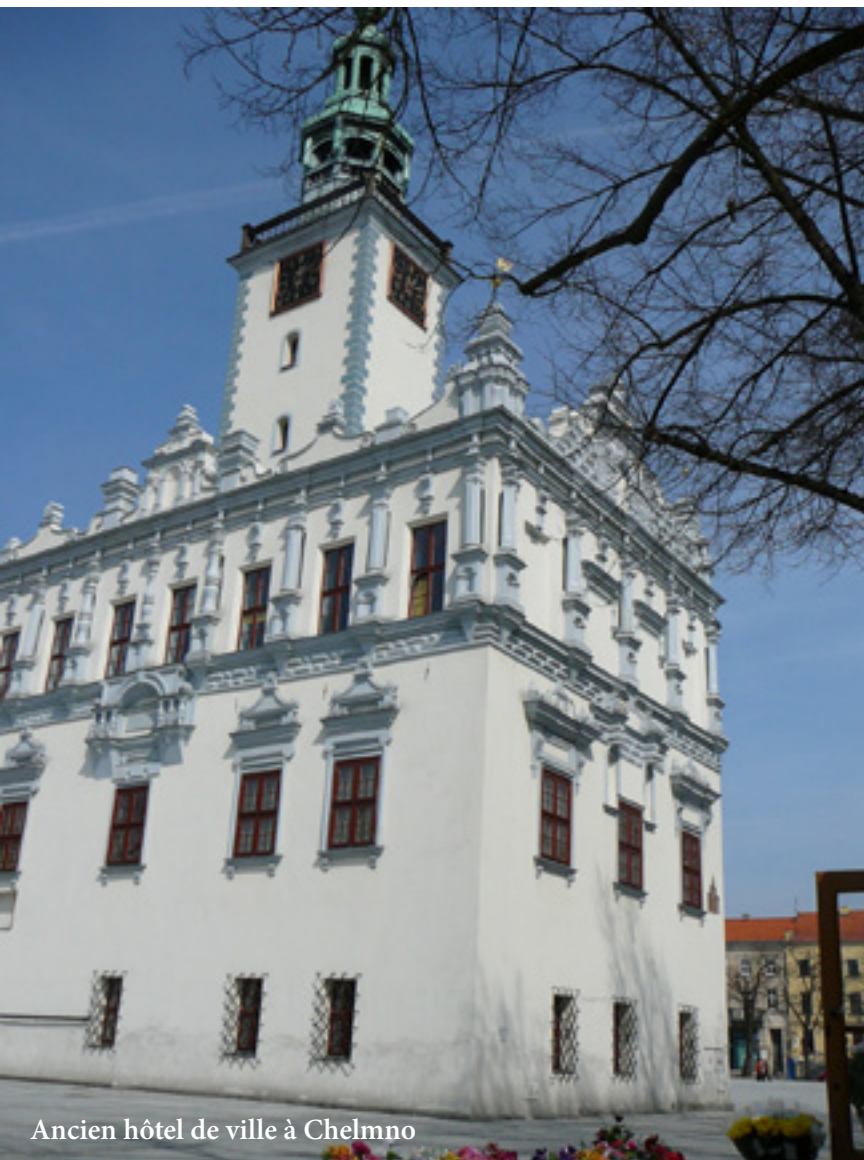
Ancien hôtel de ville à Chełmno