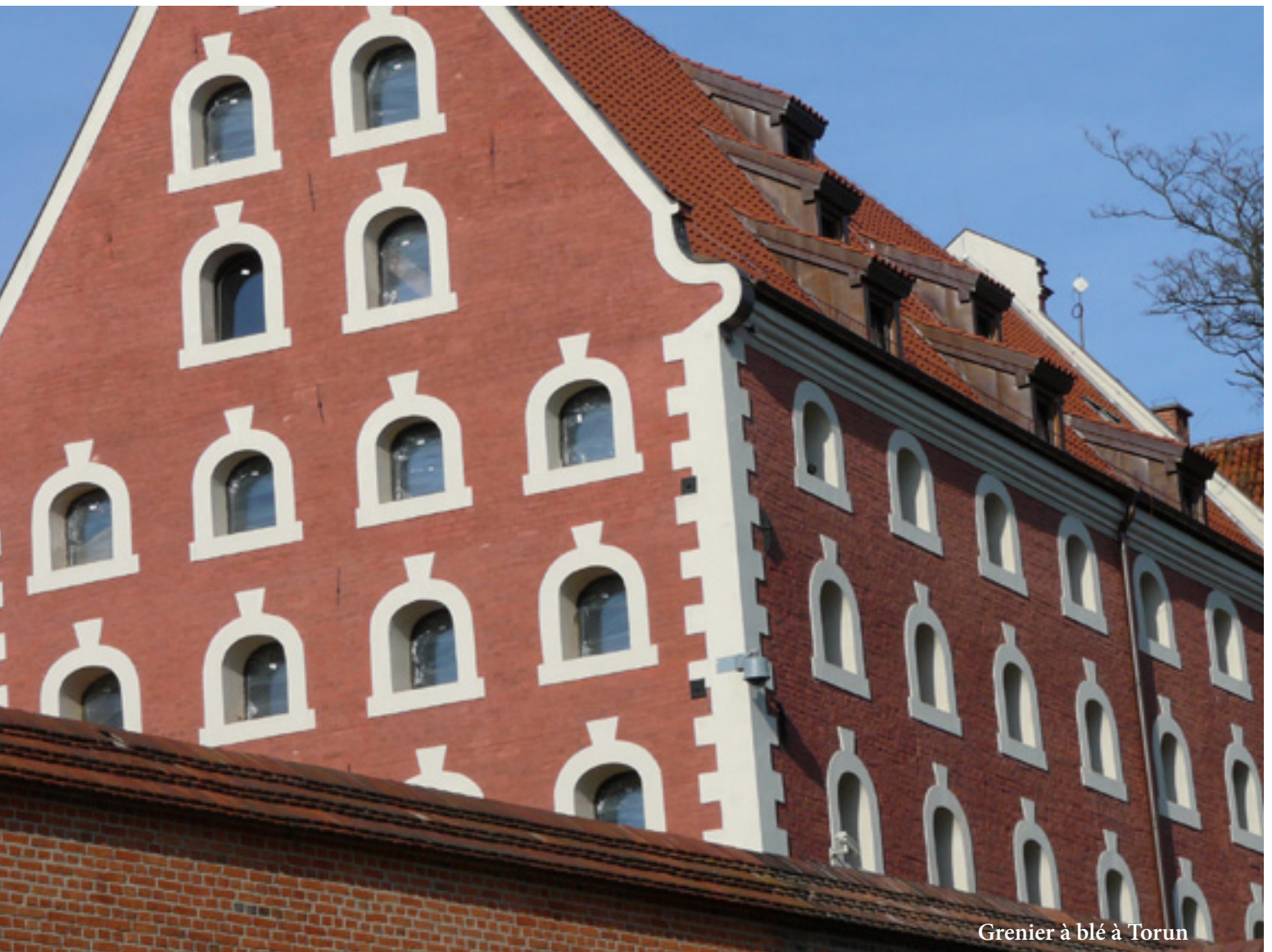
Grenier à blé à Torun