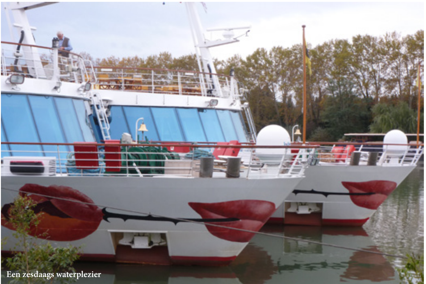
Een zesdaags waterplezier

Rhône & Provence, zesdaags waterplezier waarbij de Rhône achter elke bocht een stuk Unesco Werelderfgoed laat bewonderen. Volop te genieten van op het zonnedek van de A-Rosa Luna van de Duitse rederij Arosa, knap rivierschip dat zorgt dat het je aan niets ontbreekt, inclusief schitterende keuken.