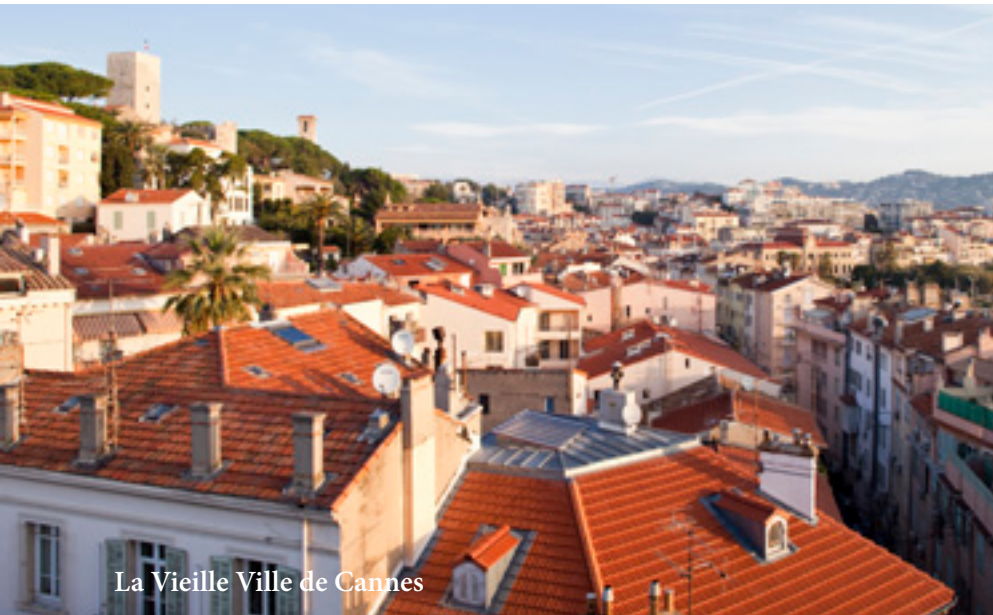
La Vieille Ville de Cannes