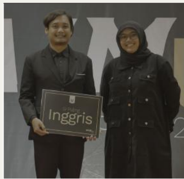
Si Paling Inggris Ustadz Rangga