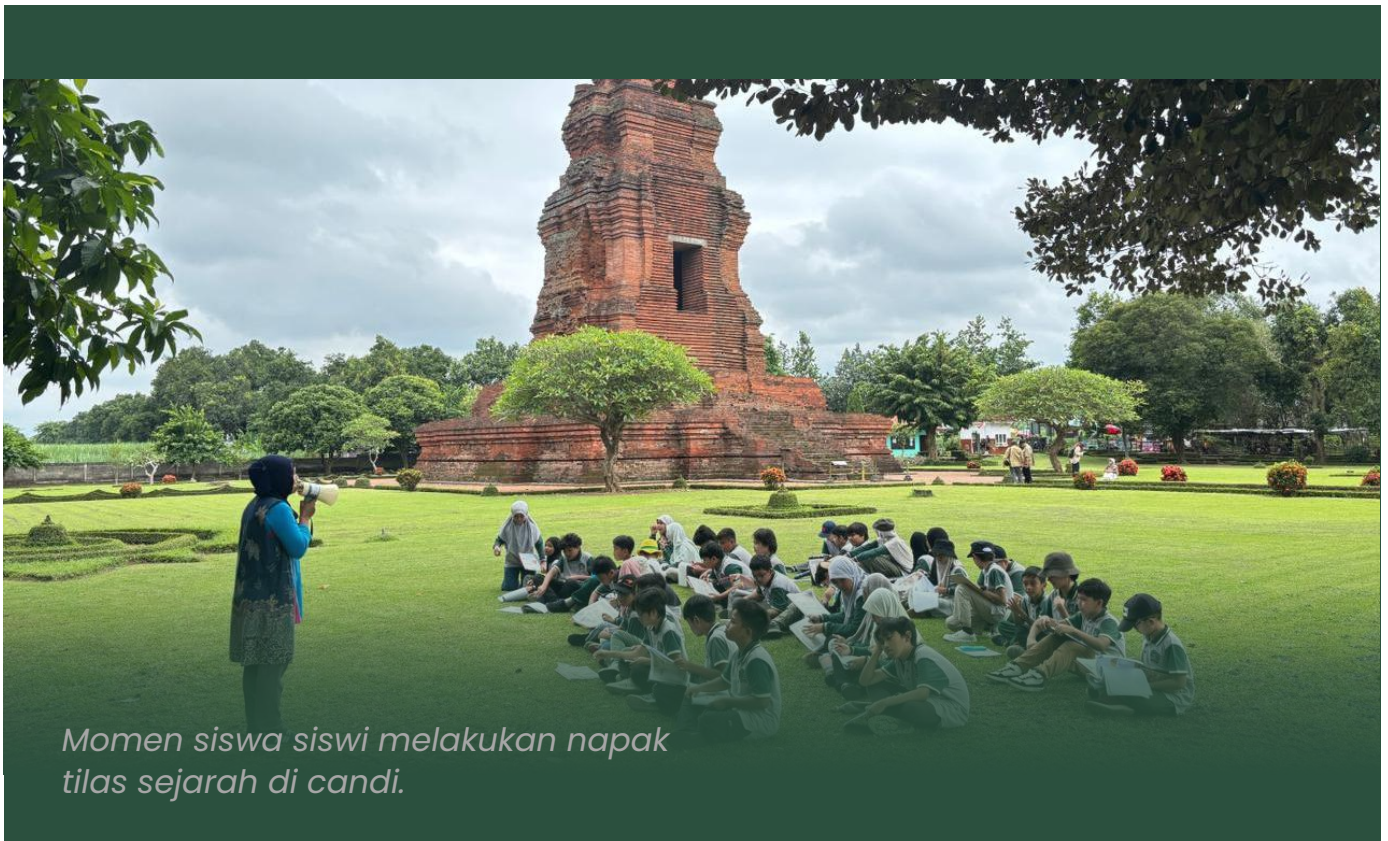
Momen siswa siswi melakukan napak tilas sejarah di candi.

Saat pulang, siswa membawa lebih dari catatan perjalanan. Ada rasa kagum dan bangga sebagai bagian dari sejarah bangsa. Melalui pembelajaran berbasis pengalaman ini, SD SAIM menanamkan kecintaan pada sejarah sejak dini sebagai bekal membangun masa depan. (ISN)