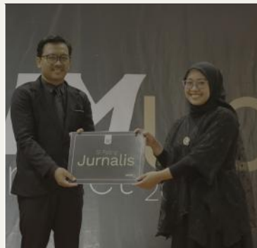
Si Paling Jurnalis Ustadz Yono