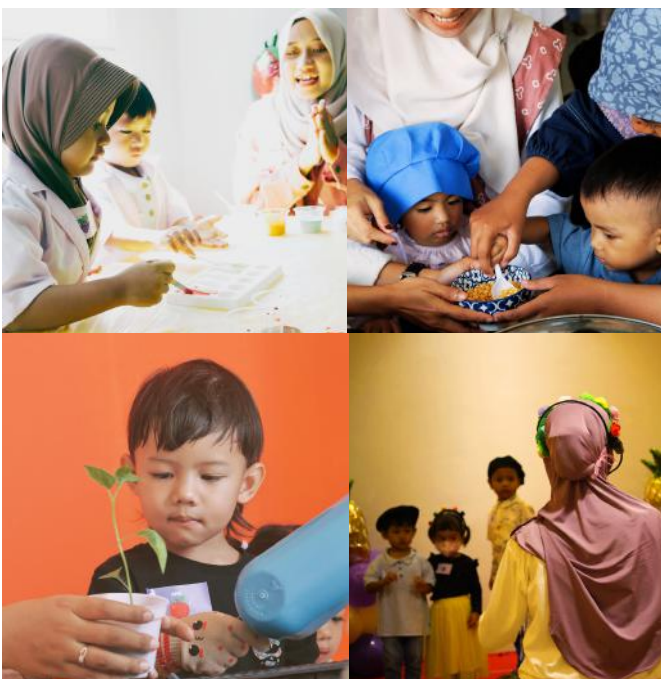
Moment anak-anak sedang beraktivitas di masing-masing booth.

Melalui SAIM WonderDay, SAIM menunjukkan komitmen menghadirkan lingkungan belajar yang menyenangkan, aman, dan bernilai Islami, agar setiap anak tumbuh optimal sesuai tahap perkembangannya. (rek)