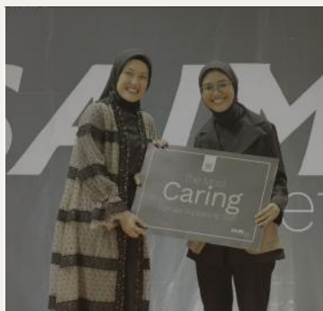
The Most Caring Female Staff Bu Bariroh