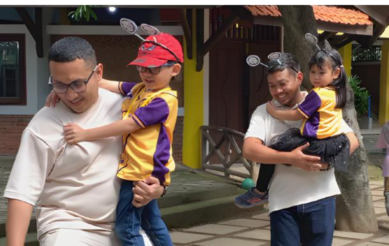
Moment bersama Ayah saat kegiatan Dad Day's Out