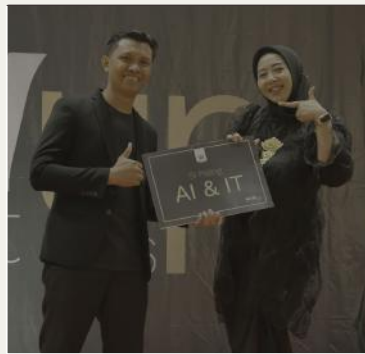
Si Paling AI & IT Ustadz Mufti