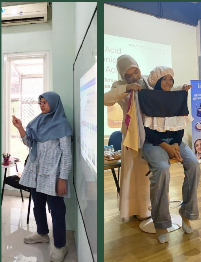
Sedikit pembekalan diberikan kepada peserta calon magang

Program ini berlangsung selama satu bulan (Januari–Februari 2026) dan diawali dengan pembekalan, mulai dari komunikasi profesional hingga grooming class bersama Paragon Corp Wardah. Selanjutnya, siswa menjalani magang sesuai minat di berbagai bidang, seperti pendidikan, teknologi—termasuk di Institut Teknologi Sepuluh Nopember—serta layanan kesehatan dan kecantikan.