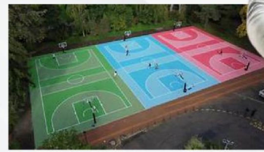
Rouen, implantation de terrains de basket 3x3 qui reçoivent des noms féminins (inclusifs)

Les plateaux multisports, présents dans de nombreux quartiers urbains, jouent un rôle essentiel dans le tissu social et la dynamique communautaire. Leur polyvalence et leur accessibilité en font des espaces propices à l'engagement communautaire, à la pratique d'activités physiques collectives et à la promotion de la diversité culturelle. En effet, Gasparini et Vieille Marchiset (2008) soulignent que ces espaces sont le reflet des préoccupations sociales et politiques de notre époque, favorisant l'animation pour la paix sociale dans les banlieues et le développement d'un loisir sportif de proximité et de qualité. Par cet axe, nous voulons mettre en avant l'impact social des plateaux multisports dans les quartiers urbains, mettant en lumière leur contribution à la cohésion sociale, à l'inclusion et au bien-être collectif.