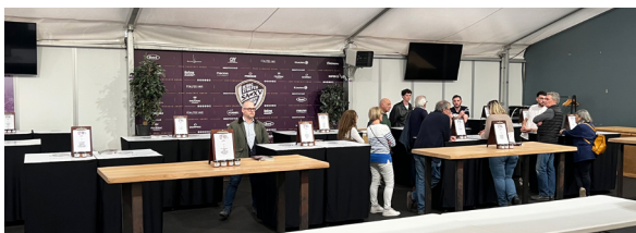
Repérage des espaces de réception du stade Chanzy par une partie du Comité_125 ans, le 25 février 2026