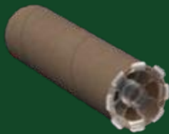
Oude plastic kernpluggen