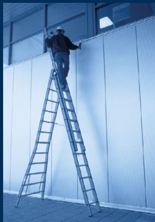
ladders & trappen