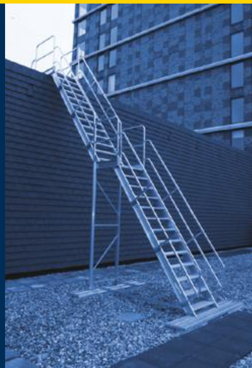
kooiladders & moduletrappen

Deurneseweg 5 • 5709 AH Helmond • T (0492) 538 124 • www.dirks.eu