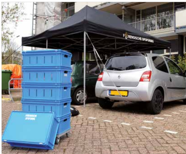
Stapelbare Kisten mit Schlitten, Schnappverschluss und Aufdruck für die Aufbewahrung von Zelten der forensischen Ermittler.

Archiv für Beweismaterial. E-LINE-Behälter können verplombt werden und eignen sich deshalb sowohl als Aufbewahrungsbehälter als auch als Versandeinheit.