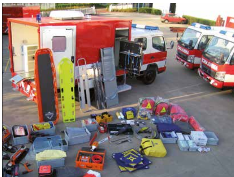
Inhalt Rettungscontainer für den Transport per Flugzeug.

Durch die einheitliche Einrichtung kann das Personal jeder Einheit blind die benötigten Dinge im Container einer anderen Einheit finden. Stress ist bei der Katastrophenbekämpfung unvermeidlich. Doch bei der Suche nach den erforderlichen Gerätschaften gibt es keinen Stress mehr. So kann sich das Personal voll und ganz auf seine Aufgaben konzentrieren. Und genau darum ging es.