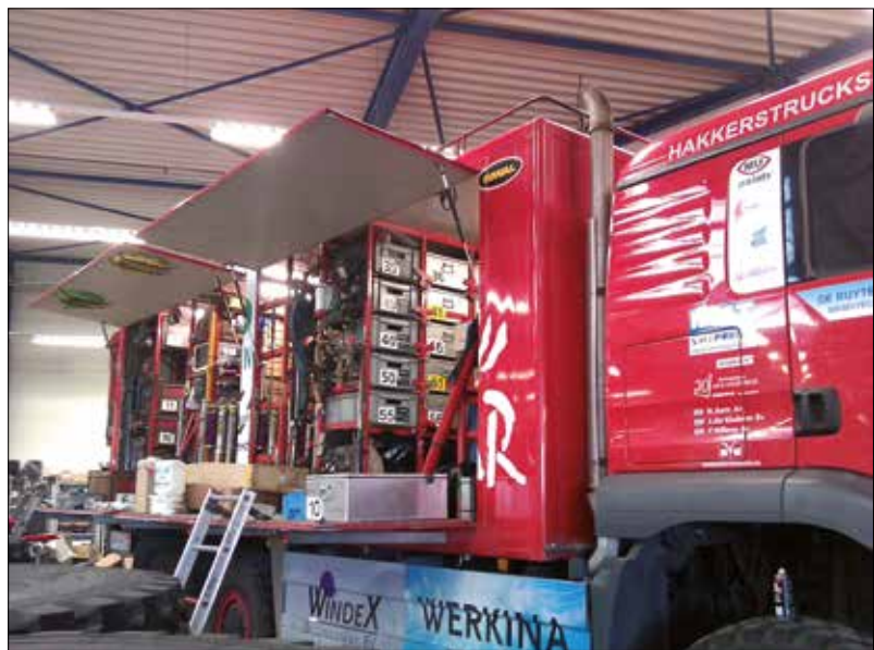
Einrichtung Hilfs-LKWs für Paris - Dakar.