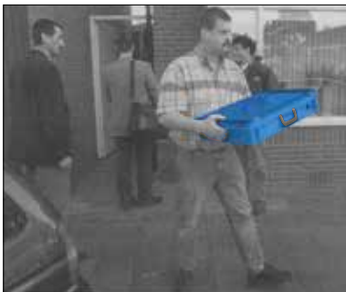
Abtransport von Beweisstücken in einem E-LINE-Behälter.