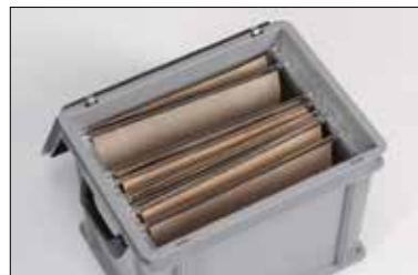
Mit Aluminium-Schienen versehen sind unsere Koffer für A4-Hängemappen geeignet.