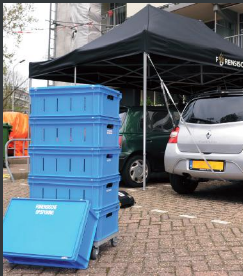
Polizei und Justiz