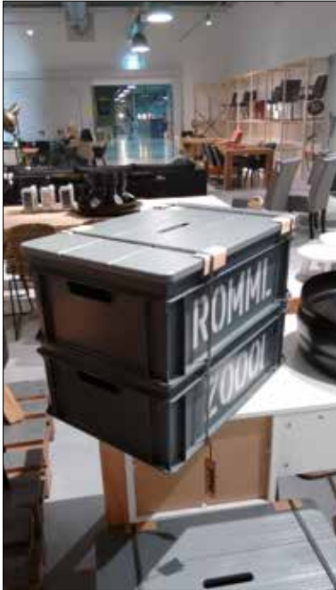
Kunde: Loods 5.