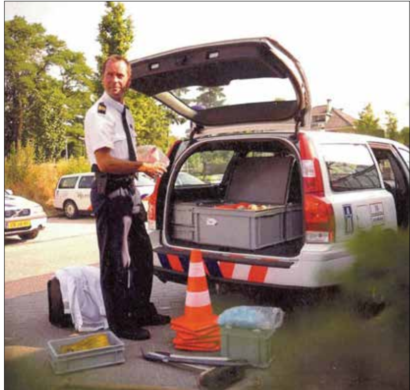
Alles passt in E-line-Behälter.