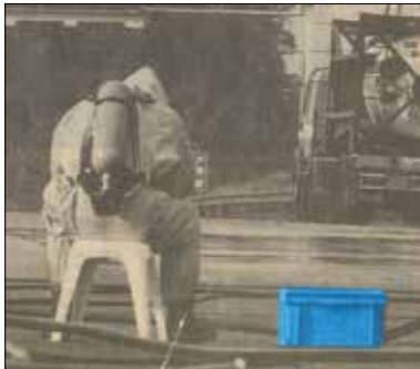
Bei einem Unglück mit Gefahrstoffen, E-LINE-Behälter mit Hilfsmaterial.

Häufig sind, wenn Polizei oder Hilfsdienste in den Nachrichten gebracht werden, auch unsere Behälter zu sehen. Ob es nun um eine Transportverpackung von Beweisstücken geht oder um Kisten mit Hilfsmaterial, wir sind immer ein wenig stolz darauf, wenn wir in der Presse darauf stoßen.