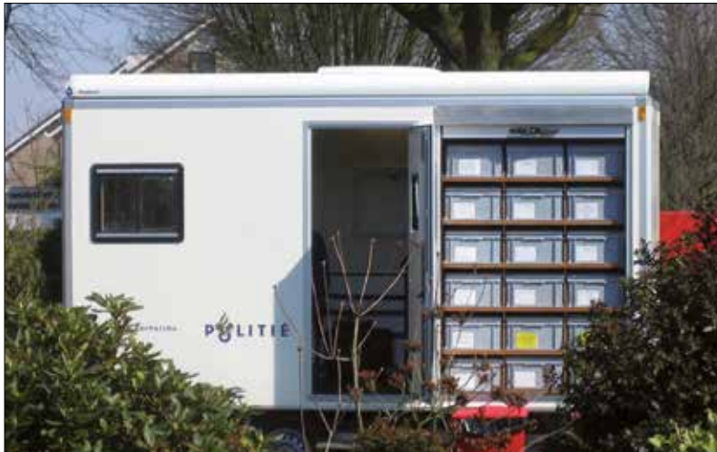
Mobiler Arbeitsplatz der zivilen landesweiten Polizei der Niederlande mit RAKO-Behältermagazin und rotem Abfallbehälter in Industriequalität.

E-line-Behälter werden aufgrund ihrer klaren Formgebung und den vielen Zubehörteilen (selbstklebende Halter, selbstklebende magnetische Flächen, Barcode-Aufkleber mit Notizfeld, Plomben, Plomben mit Barcode und Emblem) mindestens genauso häufig zu Lagerungszwecken wie für Transportzwecke ausgewählt.