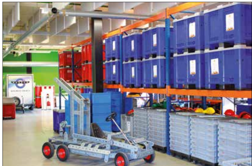
Kunde: Dukino Business Events, Spezialist für Teambuilding-Aktivitäten.