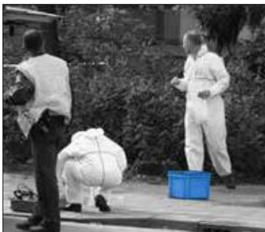
E-LINE-Behälter mit Geräten für die forensische Untersuchung.