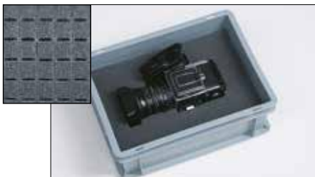
Blockschaumplatten, Perforation 20 x 20 mm. Indem Sie Blöcke abreißen, gestalten Sie Ihr eigenes Interieur.

Behälter mit Facheinteilung, der beim Training von Polizeihunden für die Aufbewahrung von Geruchsproben verwendet wird.