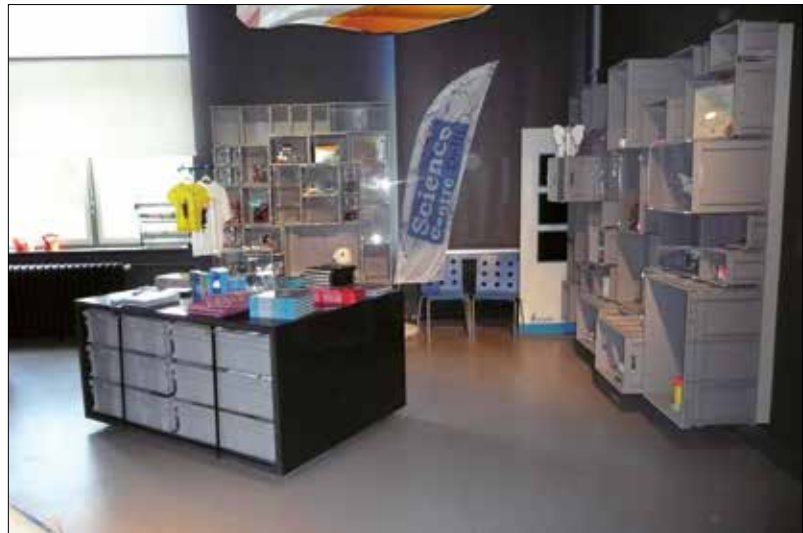
Kunde: Wissenschaftliches Zentrum der TU Delft.

Jedes Gerät in der kürzest möglichen Zeit an die richtige Werkbank. Effizient arbeiten dank eines intelligenten Logistiksystems bei Electronic Service Cooperation.