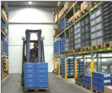
Kunde: VCN Mass Turning.