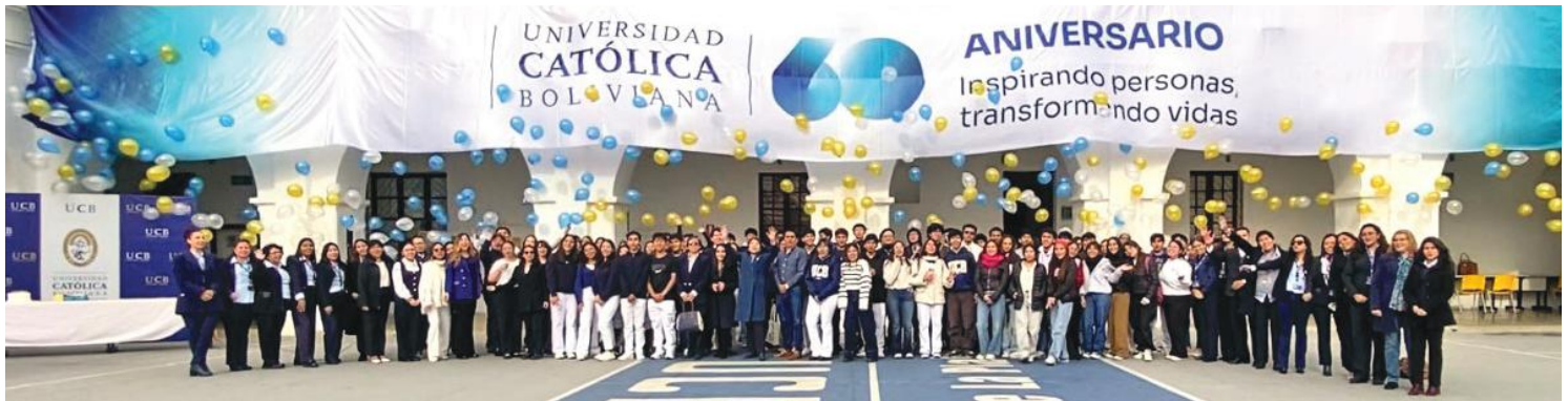
CELEBRACIÓN DEL 14 DE MAYO: Una monumental bandera y una colorida lluvia de globos enmarcan el orgullo de la comunidad de la Universidad Católica - Sede La Plata en el día central de los 60 años de la UCB.

Al concluir este mes festivo, la U.C.B. Sede La Plata reafirma su compromiso con la formación integral, la excelencia académica y el servicio a la sociedad.