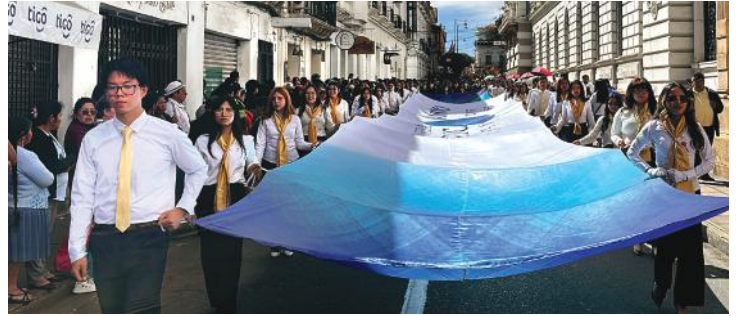
DESFILE CÍVICO DEL 25 DE MAYO: Estudiantes portan con orgullo la gran bandera conmemorativa de los 60 años de la Universidad Católica Boliviana “San Pablo” Sede La Plata – Sucre. Durante el desfile del 25 de mayo.

Las actividades también fortalecieron el compromiso de la