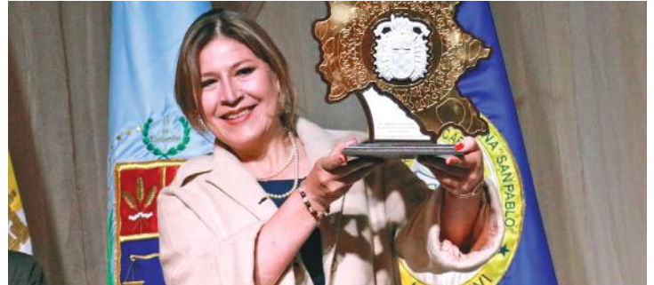
Reconocimientos destacan seis décadas de contribución al país en varios ámbitos.

En la ocasión, el Rector Nacional, Padre José Fuentes, valoró la formación de cientos de personas preparadas por la Universidad Católica que “se cuentan entre los profesionales de excelencia que aportan con su talento a la construcción de Bolivia y el mundo”.