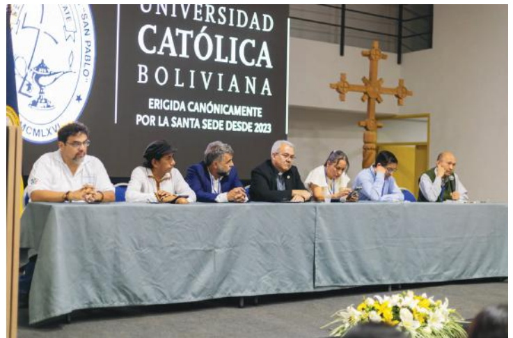
Mesa de diálogo del día 3 “Rol de la Sociedad ante la Crisis Climática”, Santa Cruz 2024

Además de conferencias y paneles especializados, el evento promoverá espacios de trabajo colaborativo destinados a vincular iniciativas de investigación, proyectos de desarrollo, experiencias comunitarias y estrategias de gestión pública. La finalidad es que los distintos actores puedan compartir conocimientos, identificar oportunidades de cooperación y construir propuestas conjuntas que contribuyan a enfrentar los efectos de la crisis climática desde una perspectiva integral.