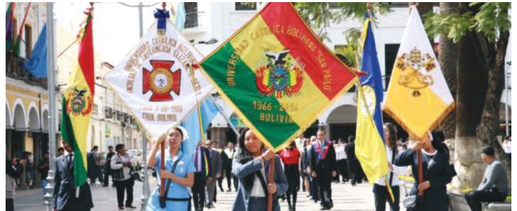
Banderas y estandartes institucionales marcaron la celebración de los 60 años.