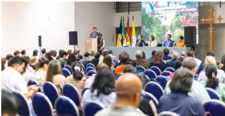
Acto de inauguración del Congreso Resiliencias frente a la Crisis Climática, Santa Cruz 2024

La realización del Congreso responde al compromiso asumido por la U.C.B. al cierre de la segunda versión del encuentro internacional, realizada en 2024 en la ciudad de Santa Cruz. En aquella oportunidad, los participantes reafirmaron la necesidad de fortalecer el trabajo conjunto entre diversos sectores y avanzar hacia respuestas integrales, solidarias y concretas frente a la crisis climática. Sobre esta base, la tercera versión busca consolidar un espacio permanente de encuentro que permita transformar compromisos en acciones colectivas con impacto real en los territorios.