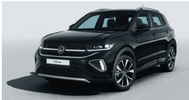
Deep Black Perleffekt-Lackierung