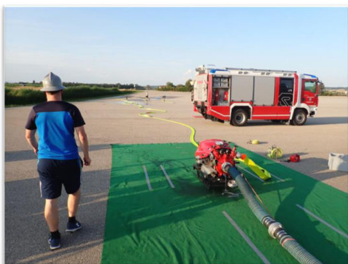
Um für den Nassbewerb bestmöglich vorbereitet zu sein, trainierten wir am Rübenthal den Löschangriff mit Wasser.