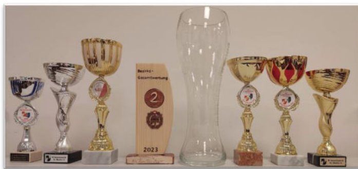
Pokalausbeute der Saison 2023