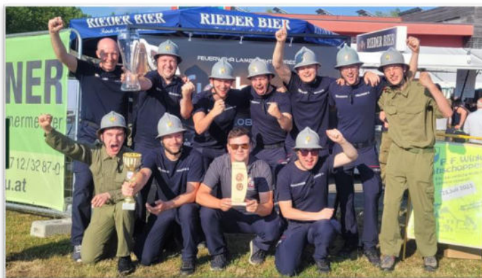
Gruppenfoto nach erfolgreichem Bezirksbewerb