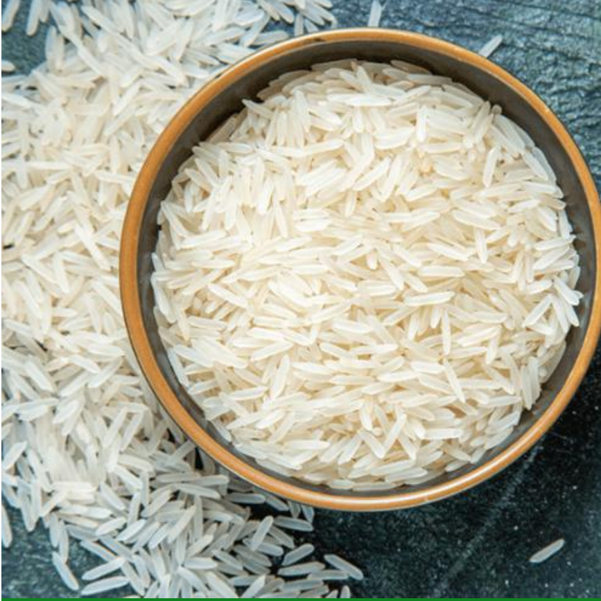
1121 أرز بسمتي