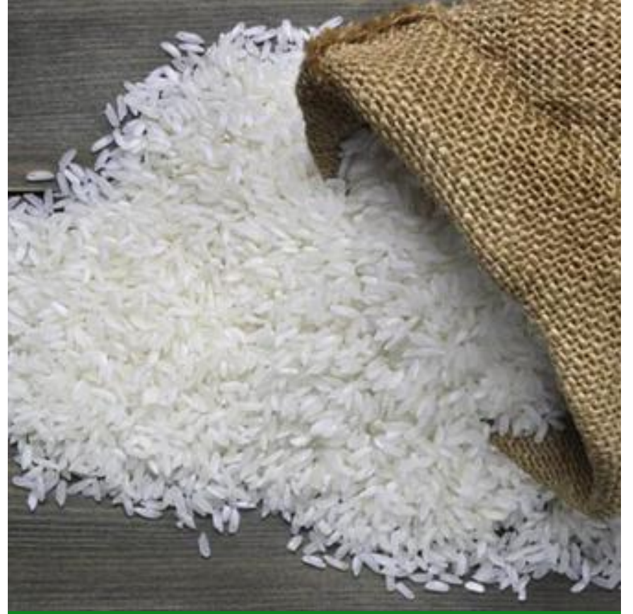
IR 64 أرز مسلوق جزئيًا