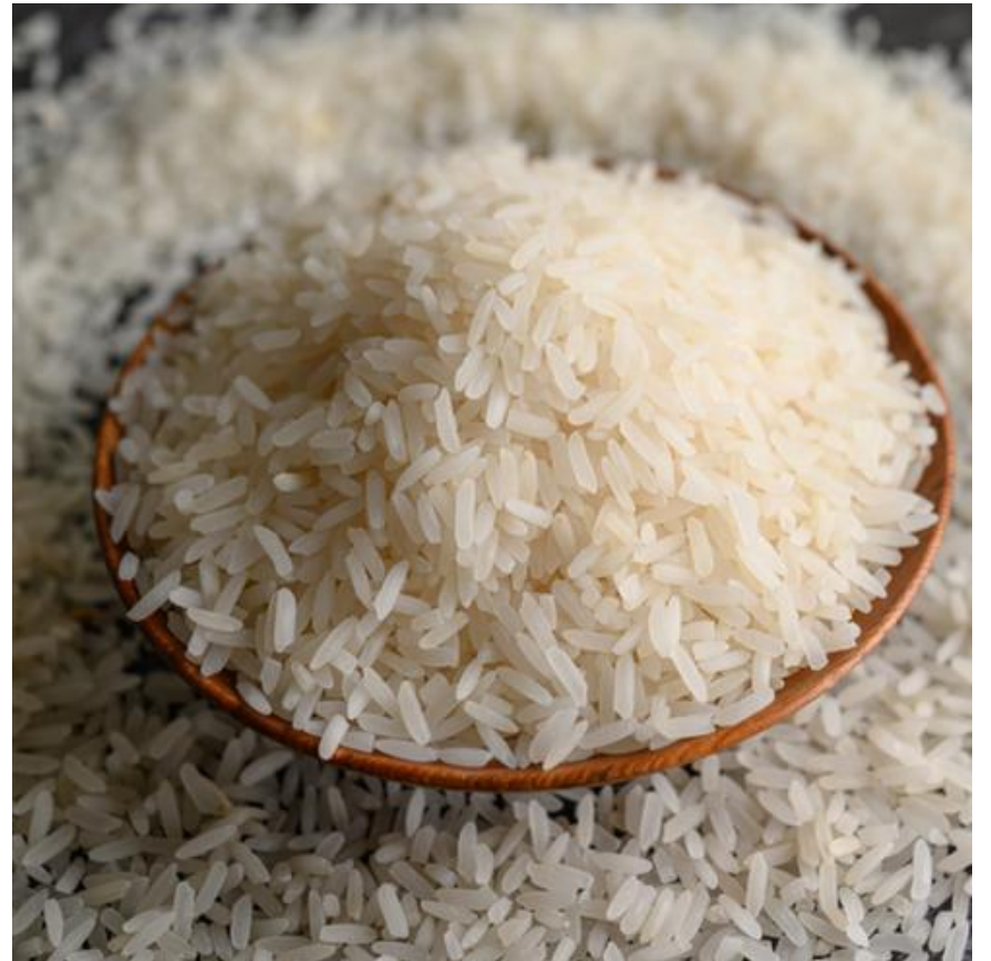
1718 أرز بسمتي