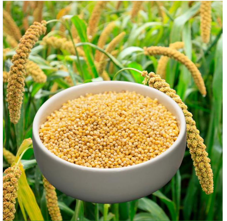
دخن ذيل الثعلب