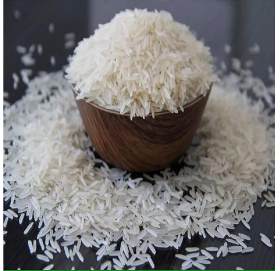
1509 أرز بسمتي