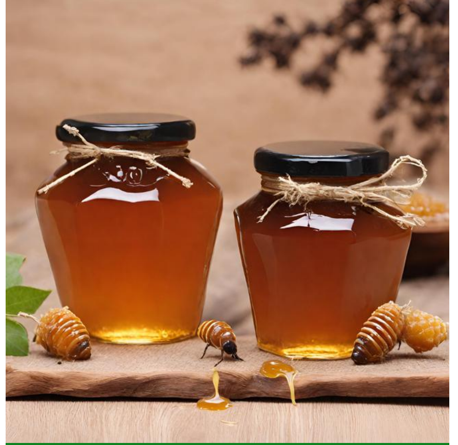
عسل الغابة البرية