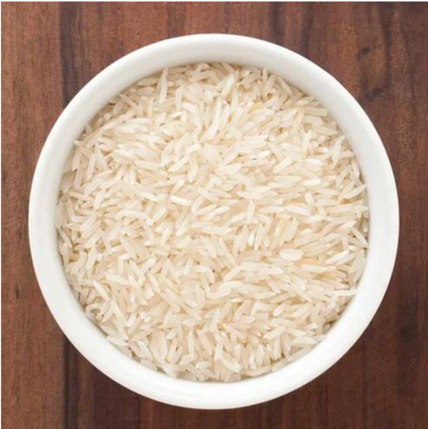
1401 أرز بسمتي