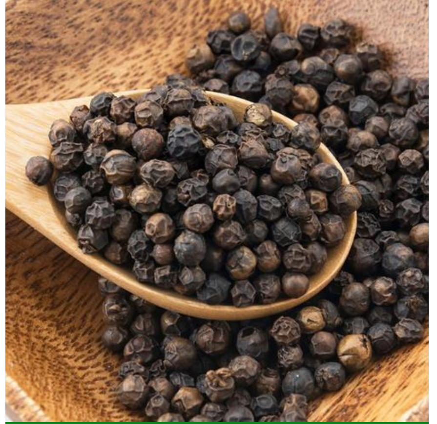
لفل أسود كامل