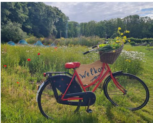
Inheemse bloemen op De Parel

gedurende het jaar. Deze insecten vormen op hun beurt weer een belangrijke voedselbron voor vogels. Meer inheemse plantensoorten leiden dus tot meer insecten, en daarmee tot meer vogels. Hoe groter de biodiversiteit, hoe sterker en gezonder het ecosysteem. Daarom planten onze groepen ook inheemse struiken en bomen aan.