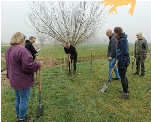
Aanplant Vogelbosje op Het Hogeland