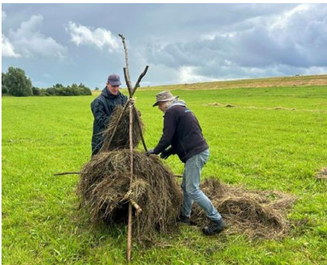
Muizenruiters in Zwolle