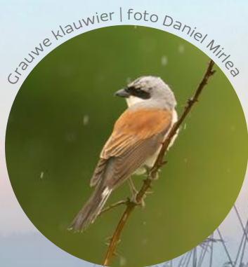
Grauwe klauwier