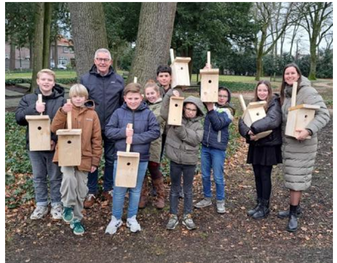
Nestkastjes maken in Veenendaal

Variatie: Een grote diversiteit aan inheemse plantensoorten zorgt voor een breder en langduriger aanbod van voedsel voor insecten