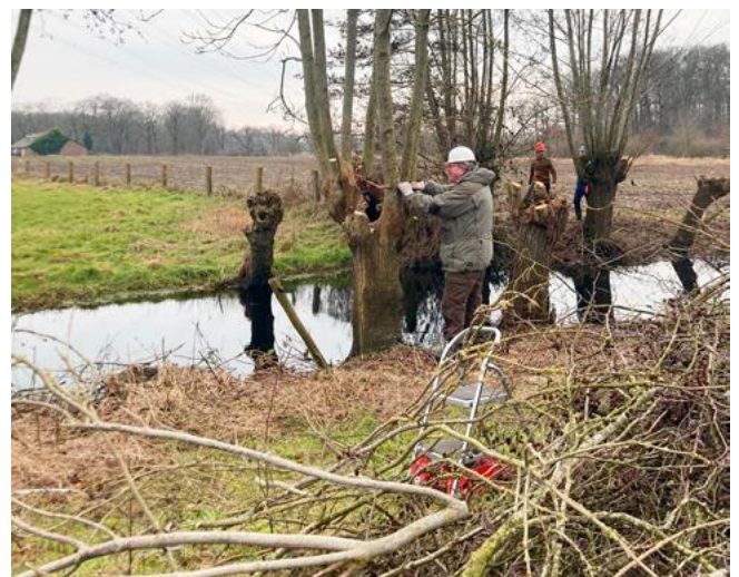
Wilgen knotten in Amersfoort