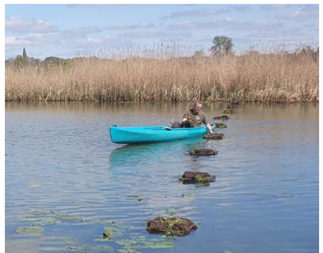
Nestvlotjes plaatsen voor zwarte stern