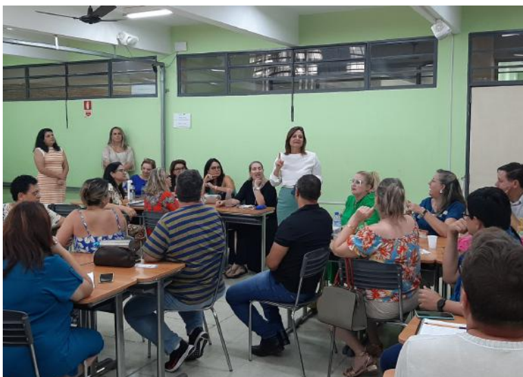
Orientação Técnica PEI.

Dessa forma a Diretoria de Ensino de Limeira se faz presente na orientação de nossos profissionais no cumprimento das Diretrizes Educacionais da Secretaria de Educação do Estado de São Paulo.