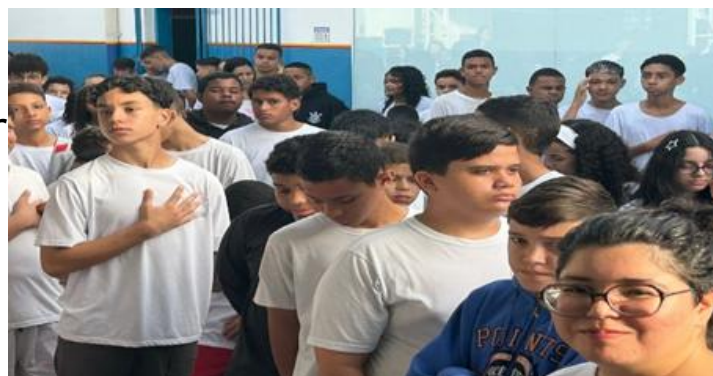
Alunos cantando o Hino Nacional e desenvolvendo atividades cívicas.