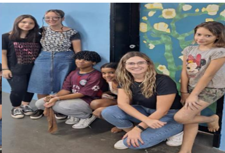
Equipe envolvida no projeto “Arte no Dom”.