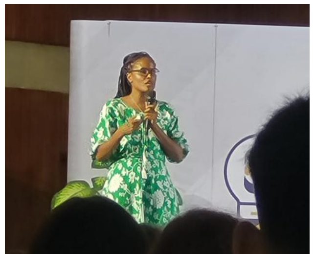
A Escritora e Filósofa Djamila Ribeiro