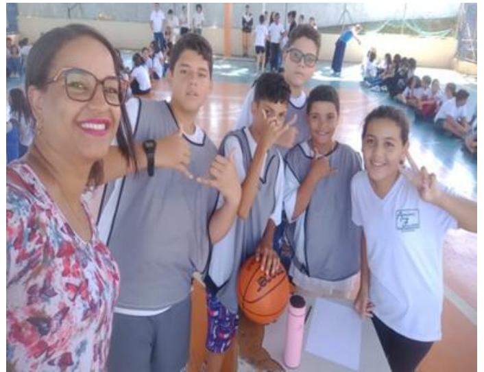
Sétimo ano comemorando ponto durante a gincana.