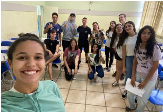
Formação em Dezembro/2023 dos Jovens Acolhedores.