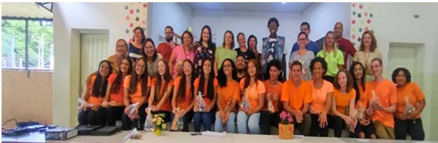
Jovens Acolhedores, Professores, Equipe Gestora e Funcionários Acolhimento 2024.