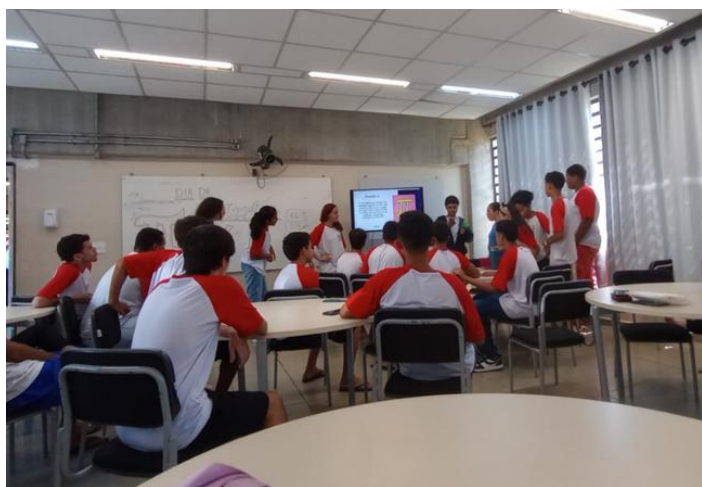
Estudantes envolvidos na atividade de Matemática

Nos dias 13 e 14 de março de 2024, foi realizada no horário da Pedagogia da Presença uma atividade de perguntas matemáticas e desafios em comemoração ao Dia Internacional da Matemática. O primeiro aluno que acertasse a pergunta ganhava um pirulito e o que acertasse o desafio ganhava um pacote de bala. Os alunos gostaram tanto que pediram para que sejam realizadas atividades nesse modelo toda semana. Essa atividade foi desenvolvida pelos estudantes acolhedores (Protagonismo Juvenil) com o apoio da Professora Rafaela de Matemática.