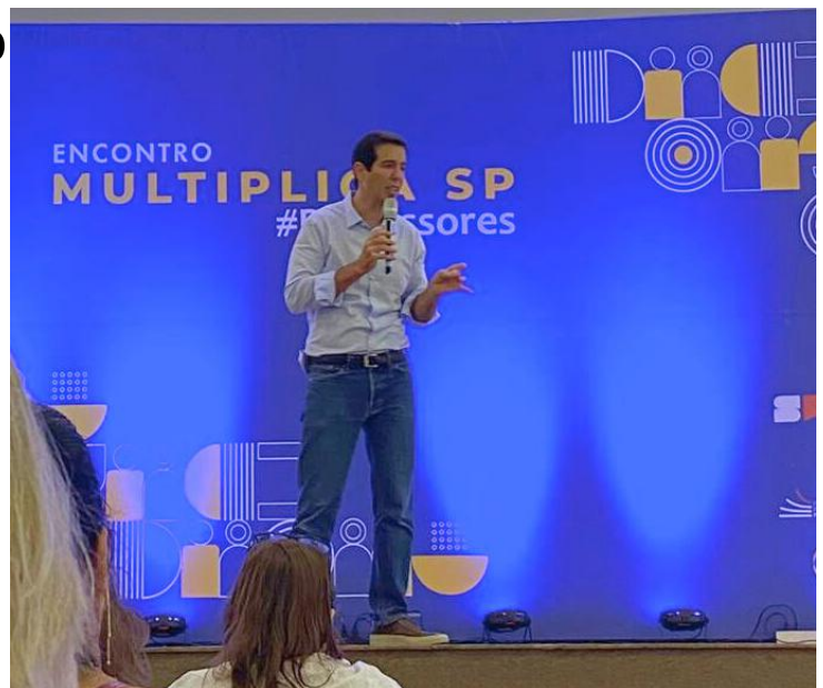
O Secretário de Educação Renato Feder durante o evento.