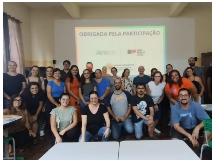
Orientação Técnica Alura.