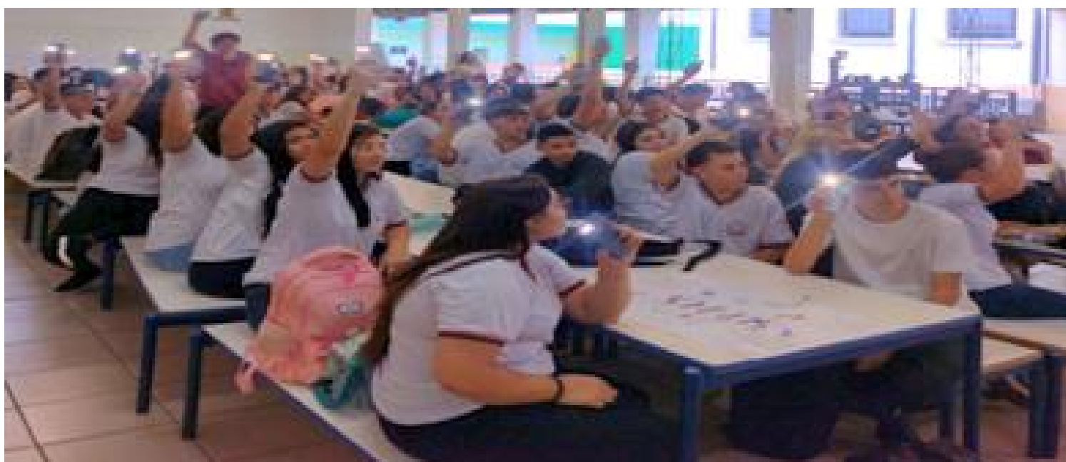
Estudantes participando das atividades de Acolhimento do ano letivo de 2024.