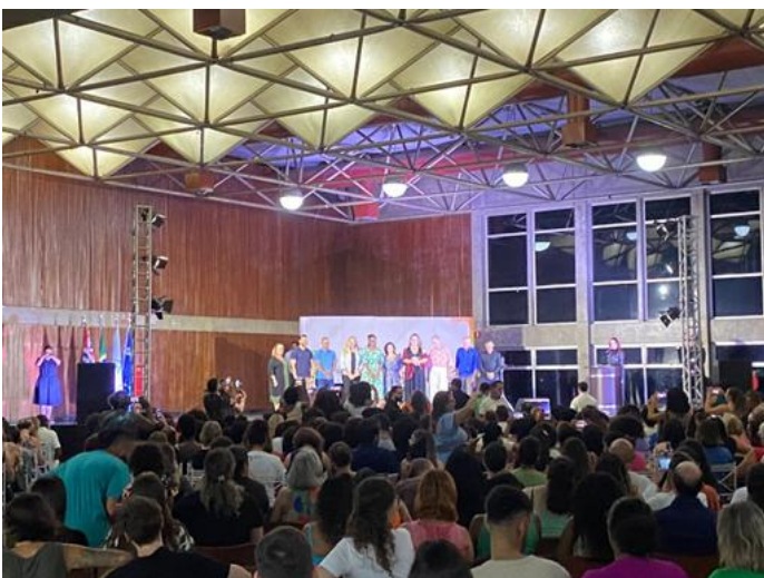
Palestra do Mês da Mulher no “Nosso Clube Limeira”

E para fechar as comemorações do Mês da Mulher teremos no dia 26 de março uma palestra com a ONG “Somos uma só” que realiza trabalhos voluntários com as mulheres da África e a entrega de absorventes sustentáveis para as alunas, confeccionados pela própria equipe da ONG.