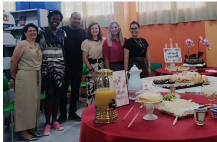
Acolhimento dos Professores com Café da Manhã.