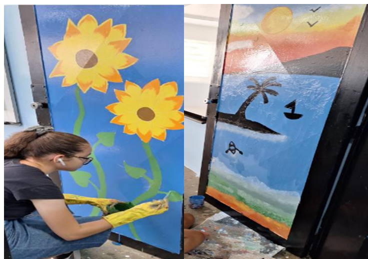
Portas recebendo pintura.