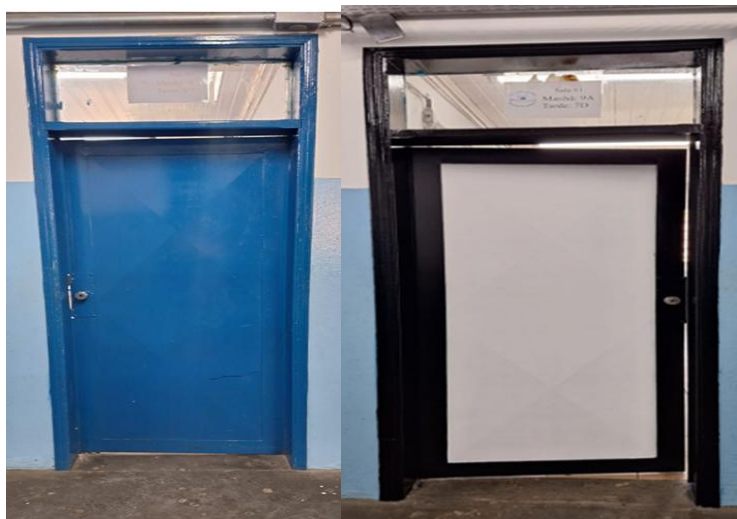
As portas antes de receber a pintura.