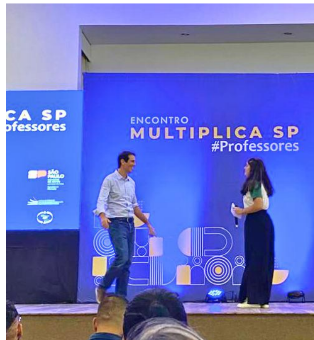
Camila recepciona o Secretário de Educação do Estado de SP Renato Feder