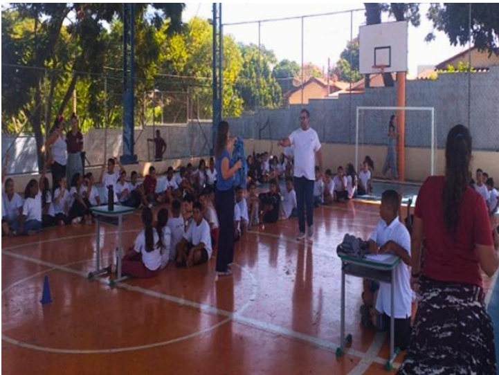
Organização dos estudantes dos 6os anos para o início da gincana.