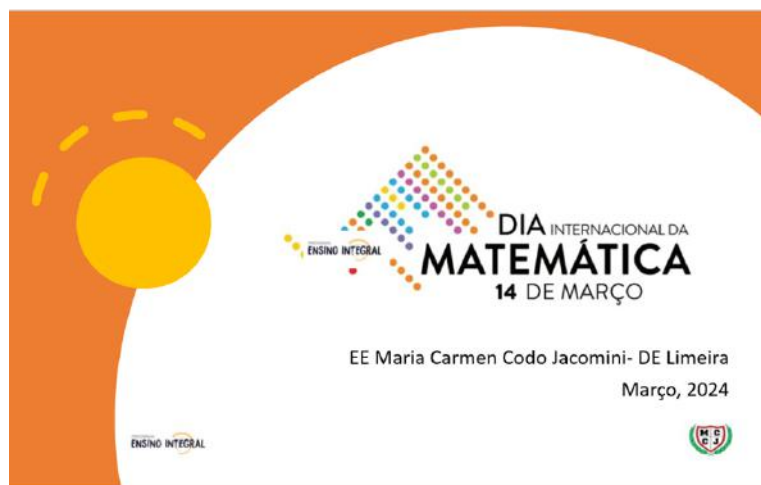
Material utilizado durante a atividade de Matemática