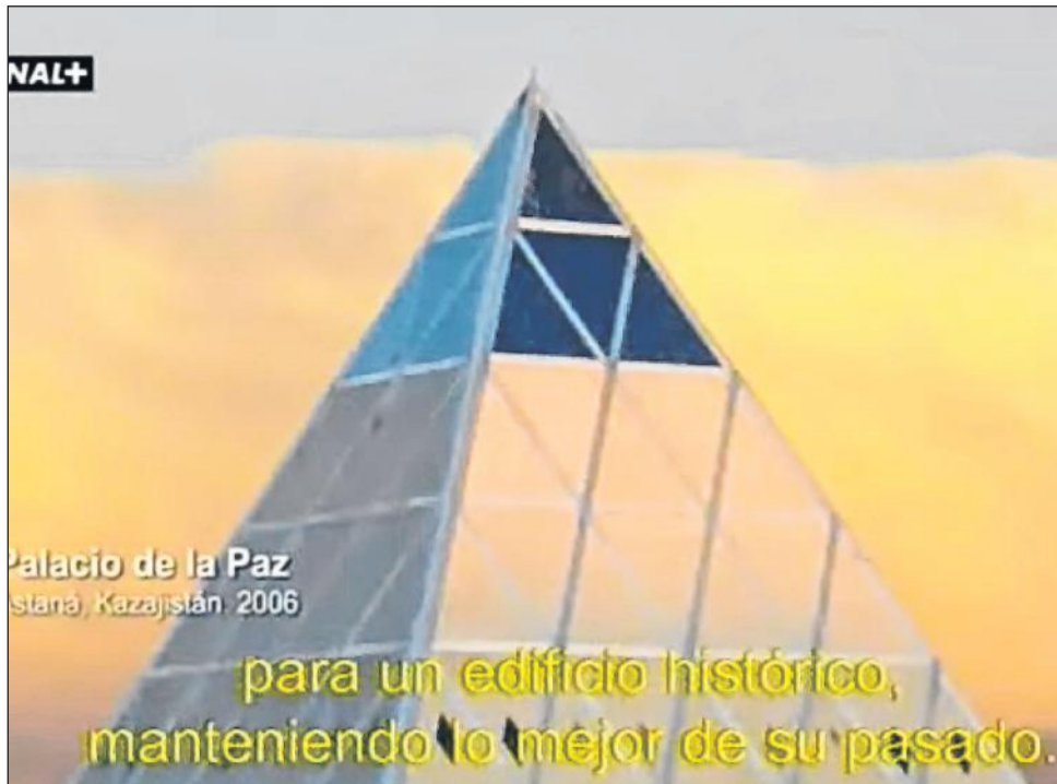
►El documental de Foster, desde sus primeros años hasta sus obras más reconocidas.