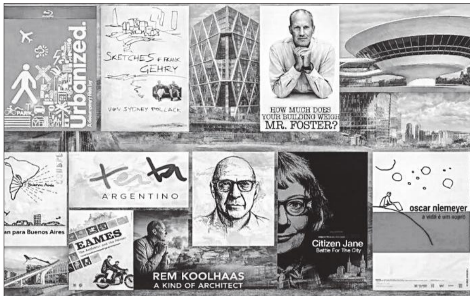
► Los documentales se han convertido en una herramienta valiosa para observar cómo trabajan los grandes arquitectos.

En ese sentido, los documentales se han convertido en una herramienta valiosa para observar cómo trabajan los grandes arquitectos, cómo organizan sus equipos y cómo enfrentan el desafío de transformar una idea en un edificio concreto. La siguiente selección reúne