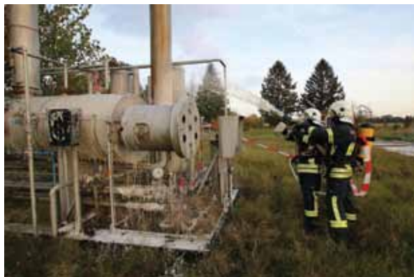
Intervencija na naftnom postrojenju

iran. Radi se o požaru u stožeru vježbe kojom prilikom je izvršena evakuacija stožera i nastavljen rad istog u terenskim uvjetima.