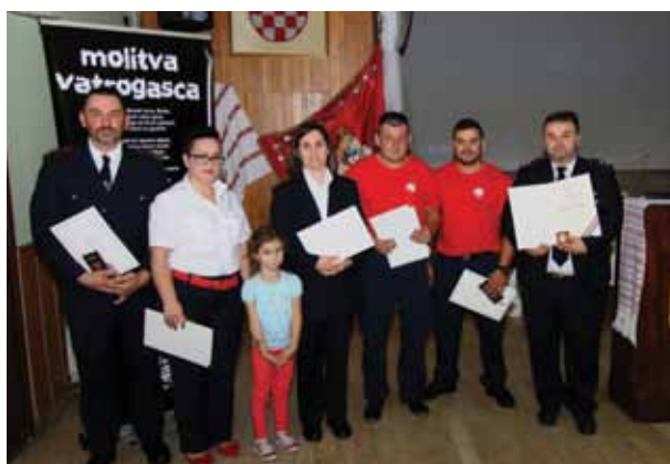
Uručene diplome i zahvalnice zaslužnim članovima Društva