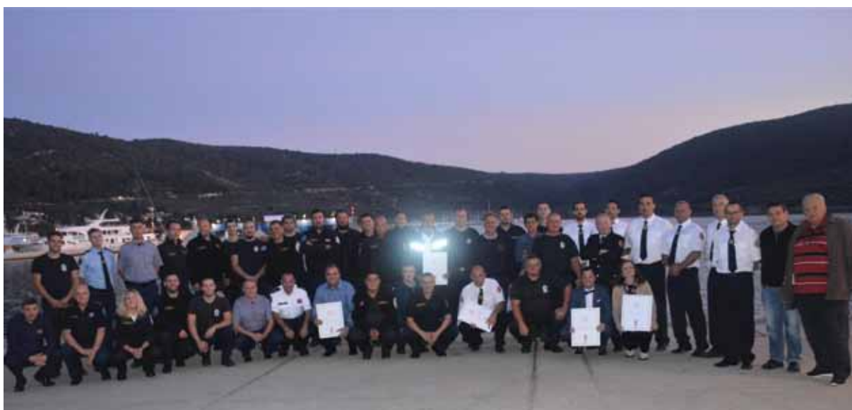
Nagrađeni sudionici vježbe „Cres Modex“