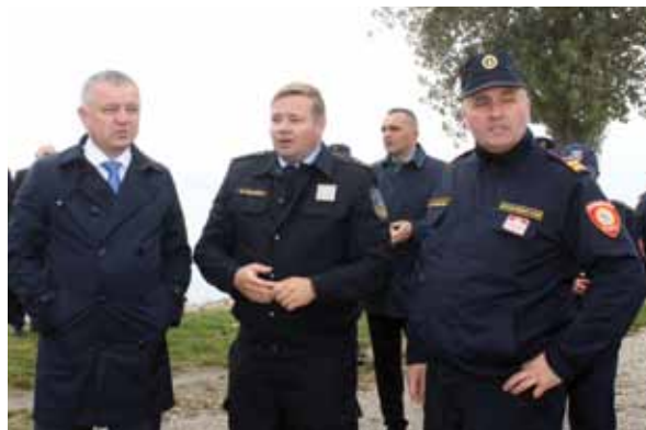
Darko Horvat s Mariom Medvedom i Mladenom Kanižajem, čelnim ljudima međimurskog vatrogastva

Pred okupljenim vatrogascima govorio je i ministar Horvat koji je istaknuo kako u opremanju vatrogasci s njihove strane nisu sami te je spomenuo nekoliko međimurskih sredina kojima je njihovo Ravnateljstvo već pomoglo u opremanju te je najavio kako to nije sve već da će u Međimurje doći dodatne brane i niz tehnoloških inovacija koje će uz vatrogasce moći koristiti i policija. Poručio je kako bi bio najsretniji da dobiv-