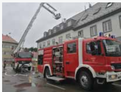
Pretpostavka vježbe je bilo širenje požara na krovnu konstrukciju

U Vatrogasnom operativnom centru, sukladno