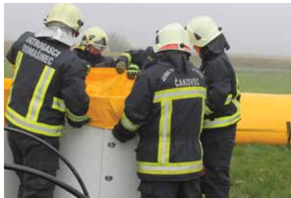
Demonstracija postavljanja brane

enu opremu vatrogasci nikada ne koriste, no isto tako bi i volio da tu istu opremu izvuku iz skladišta i koriste je za vježbanje uz poruku: - Zlu ne trebalo!