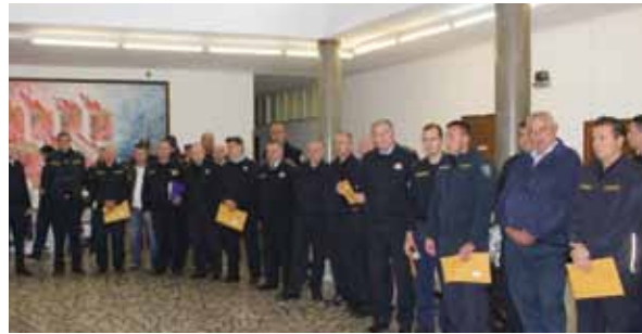
Predstavnici županija sudjelovali su na primopredaji opreme

U prostorijama Vatrogasne škole Hrvatske vatrogasne zajednice 29. listopada održana je primopredaja opreme koju je Veleposlanstvo SAD-a u Hrvatskoj doniralo hrvatskim vatrogascima. Rezultat je to težnje da se vatrogascima olakša njihov zahtjevan i odgovoran posao, a koji je prepoznalo i Veleposlanstvo SAD-a.