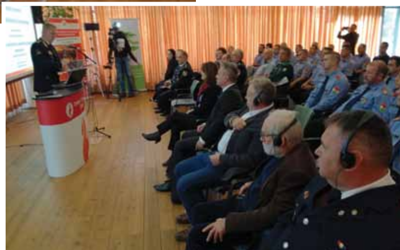
Na međunarodnoj konferenciji o zaštiti šuma od požara glavni vatrogasni zapovjednik RH upoznao je nazočne sa novim ustrojem u RH

Već 60-ih godina prošlog stoljeća uočene su negativne tendencije zapuštanja ruralnog