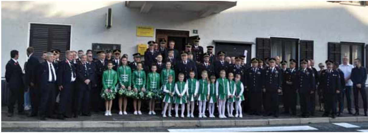
Čabarski vatrogasci - ponos svojega kraja

Vatrogastvo dobro funkcionira, čak i u okolnostima skromnog financiranja. Ipak, čini se da za čabarsko vatrogastvo stižu bolja vremena. Prema riječima čabarskoga gradonačelnika, Kristijana Rajšela, dvije okolnosti idu vatrogascima u prilog. - Prva je vijest da je Grad Čabar odustao od kandidiranja za EU sredstva putem LAG-ova, a odustao je u korist vatrogasaca kojima je prepuštao tu mogućnost. Budući da se radi o 300-400 tisuća kuna očekivanih sredstava, vjerujem da će to biti značajan doprinos našim društvima, kao pomoć pri nabavi opreme i drugih nužnih sredstava za rad. Druga dobra stvar je da HVZ i Vlada RH pripremaju novi Zakon o vatrogastvu kojim je, među ostalim, predviđeno da one jedinice lokalne samouprave koje su o neravnopravnom položaju u odnosu