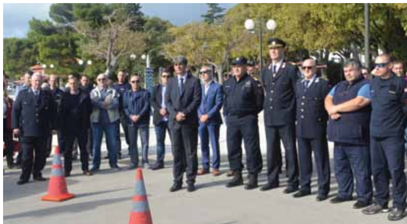
Visoki vatrogasni dužnosnici i građani Krka na primopredaji vozila

Mnogobrojnim visokim vatrogasnim dužnosnicima te građanima Krka, Petrov je s ponosom napomenuo da je riječ o iznimnom vozilu, u koje je ugrađena uistinu impresivna vatrogasna oprema. – Podvozje je proizvođača MAN, oznake TGM 13.290 4x4 BL FW, što definira ojačanu vojno-vatrogasnu verziju podvozja, s ukupnim opterećenjem od 16 t. Motor