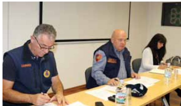
Detalj sa sjednice Stožera

U zaključcima 13. sjednice Stožera naglašeno je da je stanje sustava obrane od poplava na području Istarske županije na zadovoljavajućoj razini. Stalno