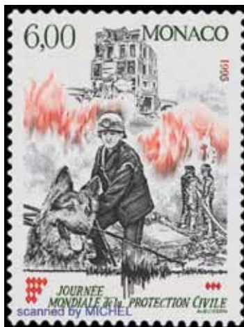
Potražni psi su neizostavni u vatrogasnoj službi, posebice onih država gdje postoji mogućnost od urušavanja zgrada u starim dijelovima gradova ili u urbanim sredinama gdje su neboderi