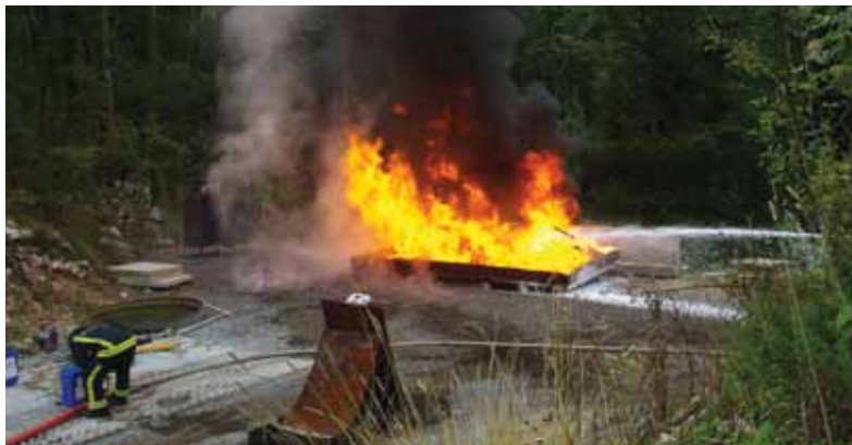
Respondol gasi sirovu naftu

Činjenica je da u svijetu postoji određena zabrinutost zbog unošenja produkata raspada organohalogenih u žive organizme, uključujući čovjeka. Fluorirani halogeni su vrlo stabilni, pa se teško i sporo raspadaju u prirodnom okolišu. Njihovi tragovi pronađeni su u ribama, krvi polarnih medvjeda, pitkoj vodi, kao i u ljudskoj krvi, što znači da se lako šire diljem svijeta. Nova pjenila koja se koriste u EU sadrže samo kratkolančane fluorotenzide (C6). Sva pjenila koja sadrže najopasniji fluorotenzid PFOS morala su do 27. lipnja 2011. biti uništena u zemljama EU. Počevši od 2015. korištenje dugolančanih fluorotenzida (C8) kao sastojaka pjenila s fluorom (FP, FFFP, AFFF i njihovih alkoholno rezistentnih varijanti) eliminirano je kroz dobrovoljni program američke EPA. Dok su sastojci pjenila C8-kemije imali PBT profil (Perzistentno, Toksično, Bioakumulativno), nova pjenila C6-kemije pokazuju samo perzistentnost i to mnogo manju nego C8. Ipak, sve je jači pritisak na vlasti razvijenih zemlja svijeta da ograniče ili čak zabrane korištenje pjenila s fluorom za gašenje požara. U skladu s time, neke su zemlje već zabranile njihovo korištenje (npr. neke savezne države Australije). Vatrogasne sposobnosti pjenila bez fluora bile su do prije nekoliko godina osjetno niže od sposobnosti pjenila koja sadrže fluor, no danas su se praktički izjednačile.