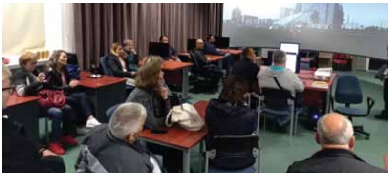
Stručni dio dijela savjetovanja obuhvatio je niz zanimljivih tema iz područja zdravstva

Potom je uslijedio obilazak učilišta posjetom vatrogasnoj postrojbi. Vatrogasna postrojba posjeduje svu potrebnu opremu