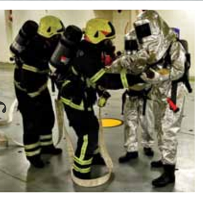
Požari na brodu među najzahtjevnijim su intervencijama