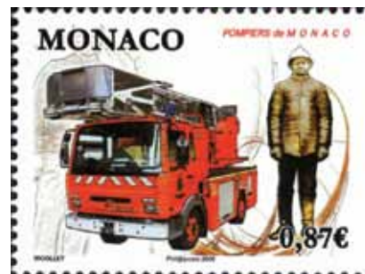
U vojnoj vatrogasnoj postrojbi Monaka nalazi se oko 150 pripadnika i 15-ak vatrogasnih vozila