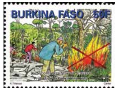
Kroz različite programe kneževina Monako pomaže unapređenju vatrogasne službe u afričkoj državi Burkini Faso, u kojoj oko 75 posto stanovništva živi na selu gdje je velika opasnost od otvorenih požara

najmanje srednjoškolsko obrazovanje, da su odslužili vojni rok u francuskim oružanim snagama ili prošli kompletnu vojničku izobrazbu, posjeduju ispravnu vozačku dozvolu za automobile i kamione, ispravnu putovnicu, odličan vid (bez korištenja optičkih pomagala kao što su naočale i leće) i dr.