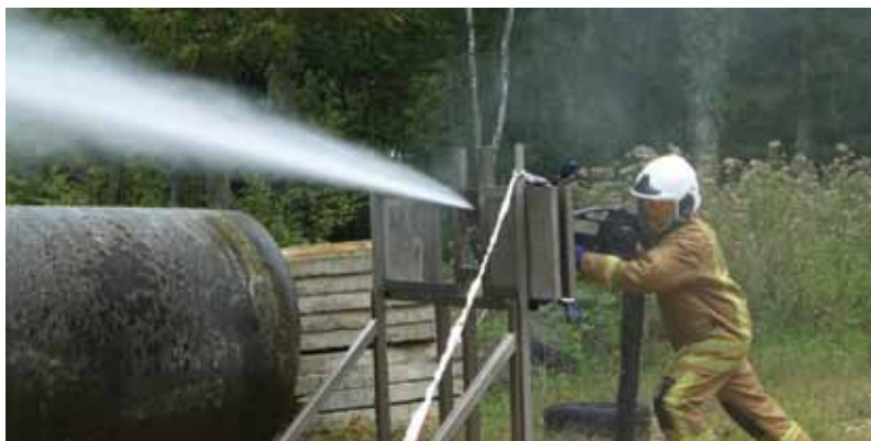
Coolfire probija čeličnu ploču