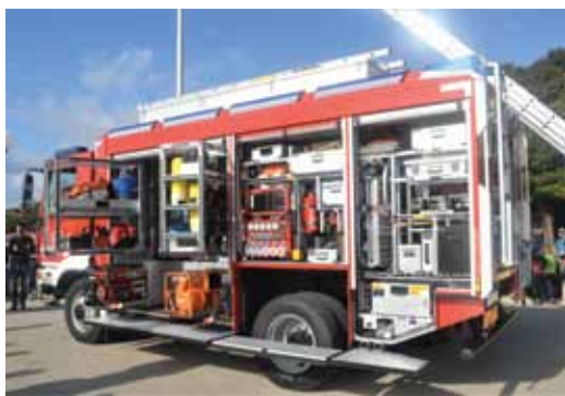
Mali div – posljednja riječ tehnologije

matski rasvjetni stup, sistem video nadzora, sustav za praćenje i navođenje, signalni sustav i sustav osvjetljenja, a ima čak i set za higijenu vatrogasaca nakon intervencije, pojasnio je Petrov, izrazivši nadu da će svoju pravu vrijednost i mogućnosti novo vozilo pokazati kad god to bude trebalo.