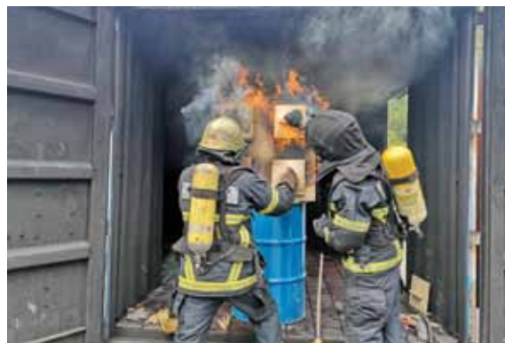
Zahtjevan praktični rad

Najvažnije što ovdje želimo naučiti su tehnike i taktike postupanja, kako bismo kontrolirali