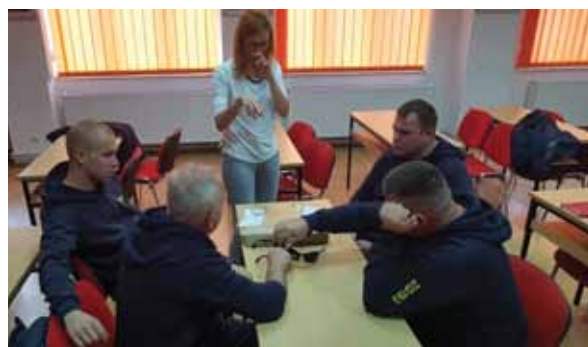
Odrađen je i teorijski i praktični dio radionice

Radionica se sastojala od praktičnog iskustvenog dijela u kojem su pripadnici Vatrogasne postrojbe Zagreb imali priliku postaviti se u ulogu osobe s različitim vrstama invaliditeta (slabo vidne i slijepe osobe, osobe s teškoćama kretanja, osobe s višestrukim teškoćama). Drugi dio radionice bio je teorijski, u okviru kojeg su obuhvaćene teme pristupa, komunikacije, postupanja i pružanja podrške osobama i djeci s teškoćama. Iskustvo je bilo obostrano korisno, baš zbog mogućnosti izmjene znanja i iskustava pripadnika postrojbe i