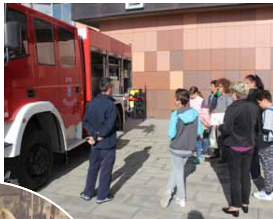
Vozilo DVD-a Sesvete

m a n j e p u t e m promotivnih i edukativnih materijala te izloženim vatrogasnim