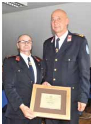
Zasluzeno priznanje HVZ-a

bez osnovnih sredstava za rad, ali su upornim radom i zalaganjem postupno jačali, brojčano i stručno, školovali kadrove, dopunjavali opremu i tehniku. Veliku pozornost oduvijek su posvećivali preventivnim ophodnjama i nadgledanjem svojega područja te vatrogasnim vježbama. Društvo se ponosi i svojim natjecateljskim uspjesima, a posebno onima ženske A ekipe koja je četiri godine zaredom (2000.-2004.) bila županijski prvak te sudjelovala na državnom natjecanju.