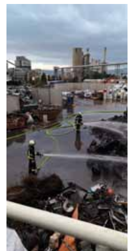
Hlađenje hrpe otpada