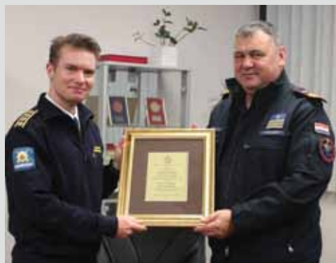
Glavni vatrogasni zapovjednik RH S. Tucaković uručio Plaketu HVZ-a zapovjedniku Szymanskom

Ured Hrvatske vatrogasne zajednice 31. listopada posjetio je zapovjednik vatrogasne službe u švedskoj sjevernoj Dalarni Johan Szymanski. Glavni vatrogasni zapovjednik RH Slavko Tucaković upoznao je zapovjednika Szymanskog o sustavu zaštite od