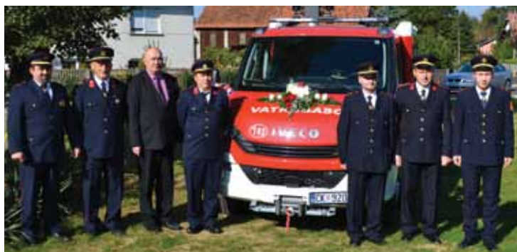
Uže rukovodstvo DVD-a Selnica s načelnikom Općine

Dobrovoljno vatrogasno društvo Selnica jedino je vatrogasno društvo na području Općine u koju spada 10 naselja i koje se brine za sigurnost svih mještana. Tako su 6. listopada vatrogasci imali svečanu primopredaju i posvećenje malog navalnog vozila, a osmjesi nisu silazili sa lica zadovoljnih članova i njihovih bližnjih. Najvažnija je sigurnost interventnih vatrogasaca kada krenu na intervenciju, a s novim vozi-