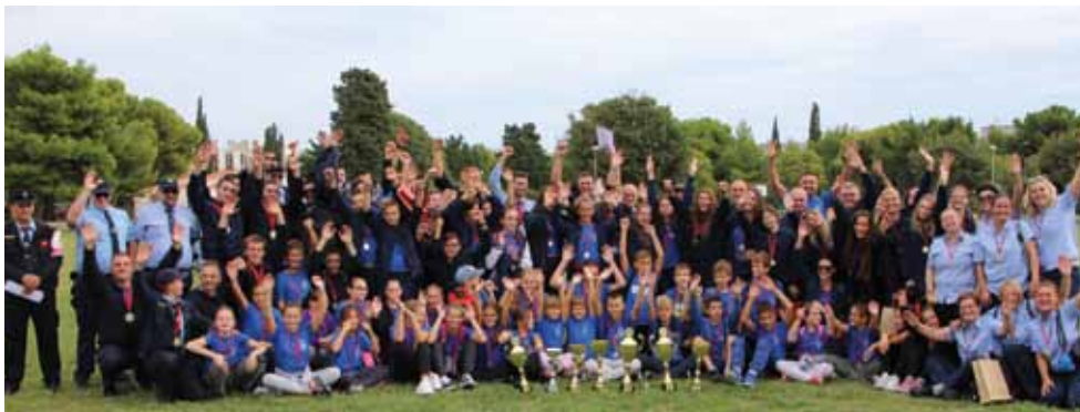
Natjecatelji DVD-a Mladost Kaštel Sućurac

U najbrojnijoj kategoriji, djeca M, prvo mjesto je osvojilo odjeljenje DVD-a Komiža 2, drugo odjeljenje DVD-a Marina, a treće odjeljenje DVD-a Solin 1. Među 8 odjeljenja djece Ž, najbolji rezultat su postigle djevojčice iz DVD-a Slatine, a