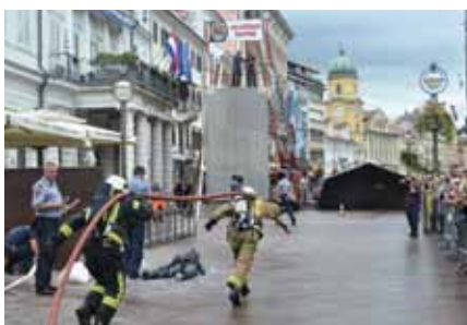
Riječki memorijal uvijek privuče veliku pozornost prolaznika

Očekivano, na natjecanju su prevladavale muške