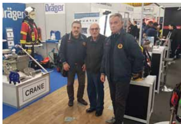
Odrađen je i teorijski i praktični dio radionice

U Postojni su prikazane i razne pokazne vježbe te materijalno-tehnička oprema iz područja sustava civilne zaštite. Glavna vježba upriličena je u petak, 18. listopada pod nazivom „VAJA POSTO-