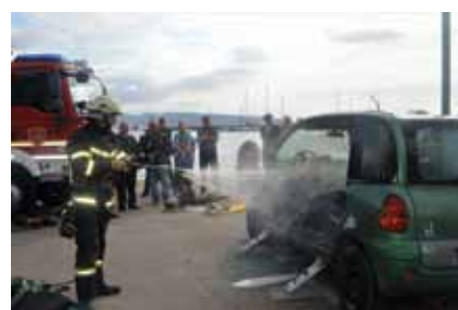
Dio nove opreme korišten i prilikom pokazne vježbe

vozila je Euro 5, snage 213 kW (290 KS), s kratkom kabinom za vozača i dva suvozača. Pogon je na sva 4 kotača (4x4), s blokadama diferencijala na prednjoj i zadnjoj osovini. Mjenjač je automatizirani, s 12 brzina. Podvozje je također opremljeno sistemom protiv blokiranja kotača kod kočenja, za terenske uvjete (ABS), sistemom protiv proklizavanja kotača (ASR), sustavom za elektronsku kontrolu stabilnosti vozila prilikom kočenja te sustavom ROTOGRIP, protiv proklizavanja u zimskim uvjetima. Sama nadogradnja napravljena je od aluminijskih panela i profila koji su međusobno spojeni inox vijčanom vezom, bez varenja, velike čvrstoće, tako da je unutrašnji prostor nadogradnje potpuno slobodan za ugradnju nosača i opreme po cijeloj dužini. Takav način izrade nadogradnje i uređenje unutrašnjosti (vijčana veza) omogućuje jednostavnu prenamjenu nosača i nakon više godina eksploatacije. Vatrogasno-tehnički utovar spremljen je u prostorima za opremu, pri čemu se vodilo računa o ergonomiji, zatvoren je sa sedam roleta, nepropusnih za prašinu i vodu. Za olakšani pristup opremi koja je smještena u gornjoj zoni nadogradnje ugrađena su preklopna gazišta. Na krovu je ugrađen nosač koji omogućuje skidanje ljestvi s poda. U vozilo