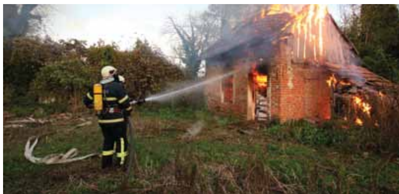
Kako bi se podigao stupanj realnosti, na vježbi je gašen pravi požar objekta

Scenarij 6. Požar stare škole u Legradu: U tijeku probe KUD-a Zrin Legrad, došlo je do eksplozije i požara u staroj školi, te je u školi ostalo zarobljeno 14 djece i voditeljica.