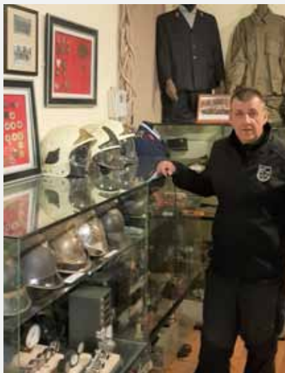
Bogata vatrogasna zbirka