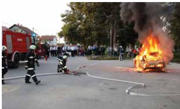
Vježbu su popratili mnogobrojni građani

važnost koju dobrovoljna vatrogasna društva imaju za svoja mjesta kao i potrebu daljnje podrške ovakvom obliku dobrovoljnog i humanog rada.