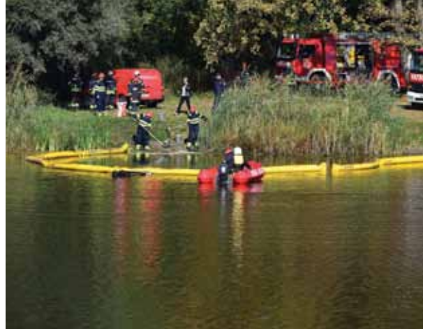
Isprobana je oprema i taktički pristupi u slučaju havarije broda za prijevoz nafte