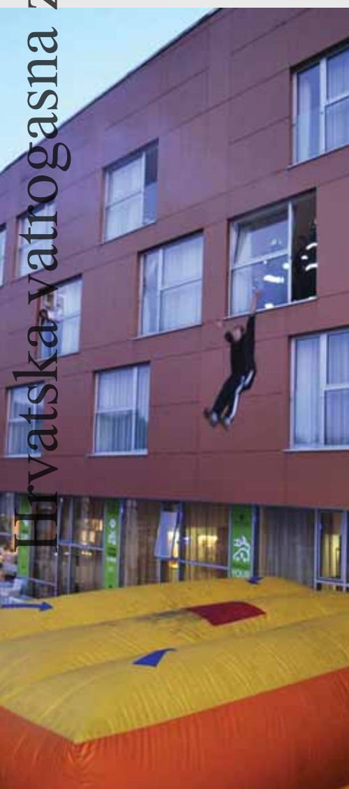
Spašavanje pomoću zračnog jastuka najatraktivniji dio vježbe