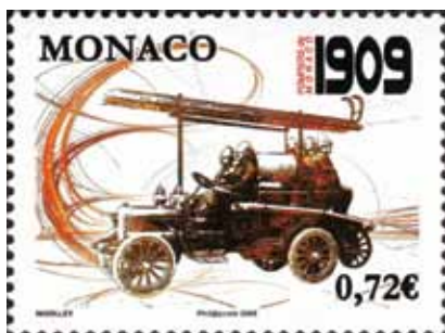
Vatrogasci Monaka se prvi put spominju sredinom XIX. stoljeća kao dio policijskih snaga