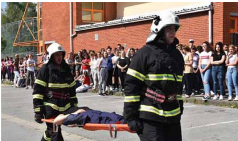
Vatrogasci pomoću nosila iznose unesrećene

Posada autocisterne 1 DVD Bedekovčina nakon primanja zapovijedi postavlja C cijevnu