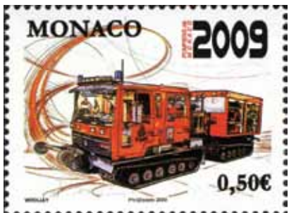
Specijalizirano vatrogasno vozilo za gašenje požara na nepristupačnim terenima opslužuje šest vatrogasaca. U minuti može izbaci 750 litara vode