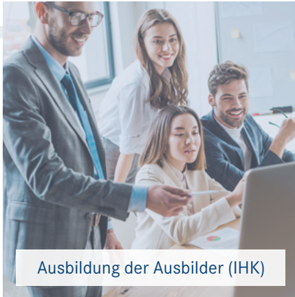
Ausbildung der Ausbilder (IHK)

Von der Vorbereitung auf die Ausbildeignungsprüfung vor der IHK bis Personalrecruiting – egal welcher Herausforderung Sie sich im Personalwesen stellen wollen, wir helfen Ihnen dabei, Ihr Fach- und Expertenwissen auszubauen!