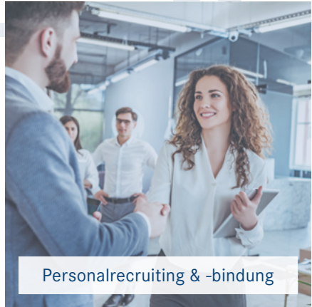
Personalrecruiting & -bindung