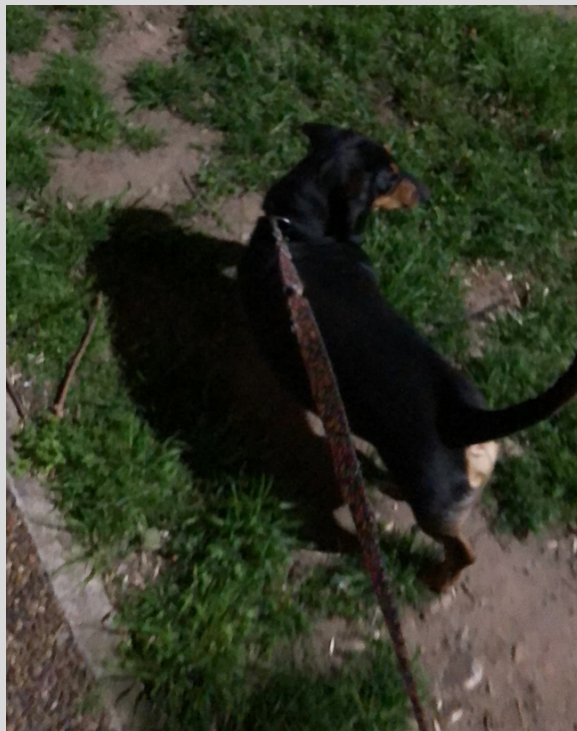
Esta foto fue hace 1 año cuando lo sacaron a pasear