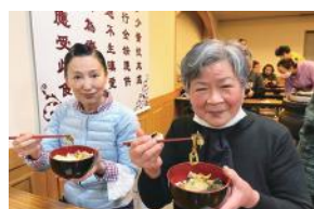
▲ 3月10日農曆二月初一，為星雲大師出家紀念日，為緬懷大師創辦佛光山，上午午供香圓滿後，住持覺用法師開示半碗鹹菜的緣起，感恩大師開創海戶外道場，大家一起向師父說謝謝。大寮亦準備一道鹹菜供養大眾，以實際行願力追隨大師的精神。同時在東京協會陳會長發動下，佛光會員及僧信二眾近200人分別參與線上佛光山開山祖師星雲大師讚頌會。