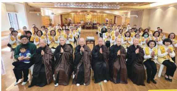
▲ 2月24日星雲大師圓寂一周年，上午經由與本山連線，東京佛光山寺僧信八十餘人於如來殿參與「佛光山開山祖師星雲大師圓寂周年紀念日追思典禮」，與本山大眾同步向大師獻花，致上最深之敬意與追思。