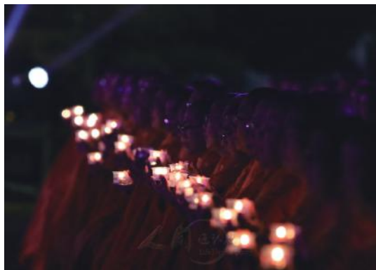
■燈燈相連綿延成無盡燈海，靜謐莊嚴，攝受人心。

人出席現場。未來更可望回復疫情前的盛況，聚集數萬人修行的力量，團結一心，點亮心中的智慧與光明，以慈悲照亮世間的幸福與安樂。