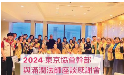
▲ 2月18日滿潤法師與東京協會的幹部舉行座談會，30名幹部除了聆聽滿潤法師開示外，也分享自己學佛及來佛光山的因緣，現場和樂融融，洋溢佛光人的歡笑聲。