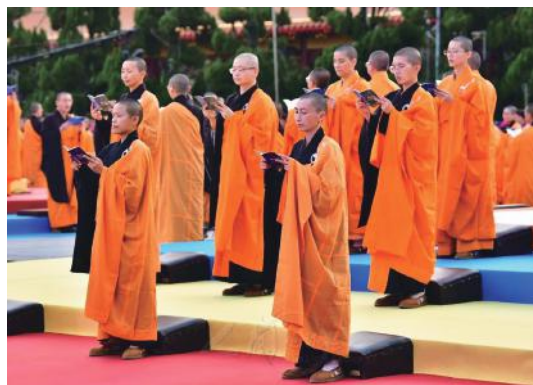
■佛光山法師帶領大眾修持。

除佛光山現場，部分海內外道場設置壇場，家中可透過人間衛視、YouTube「國際佛光會」頻道，同步精進修持，祈願世界和平。現場參與者3月2日為北桃竹苗區，三日為中南區的榮譽委員、護持委員，以及國際佛光會中華總會理監事、區協會幹部、督導長等核心幹部為代表，並特開放每分會五人（含分會會長）參加，預計逾兩千