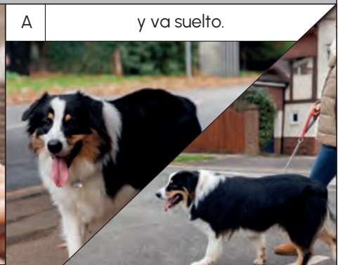
atado con correa.