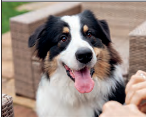
Paseo con mi perro...

PIPI CACA LIMPIAR RECOGER BOTELLA BOLSAS