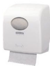
AQUARIUS* Rolhanddoek Dispenser Wit (7375), Zwart (7376)

De compacte dispenser die in één handeling te reinigen is