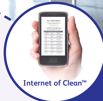
Internet of Clean™