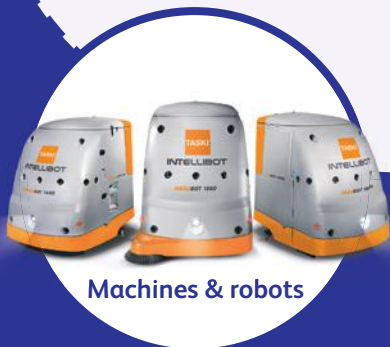
Machines & robots