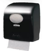
AQUARIUS* Rolhanddoek Dispenser SLIMROLL* Wit (7955), Zwart (7956)