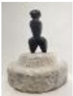
Earth Goddess Bronze on found marble column base unfinished unique 2022 39 x 33 x 34 cm