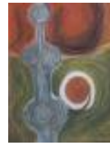
Woman in the Earth ancestor series Pastel on paper 2013 65 x 49 cm