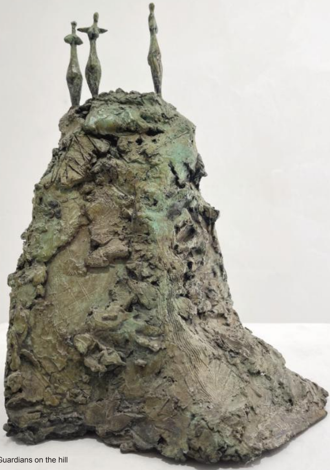
Guardians on the hill