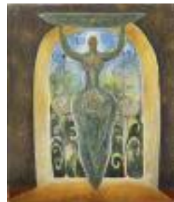
Printemps Pastel on paper 2023 163 x 140 cm