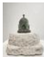
Temple Bronze unique cast 1996 23 x 21 x 21 cm