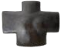
Torso bronze Edition 4 of 8 2010 48,5 x 62 x 9 cm