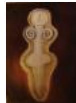
Woman Pastel on paper 2015 76 x 55 cm