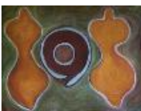
Guardians Pastel on paper 2015 120 x 150 cm