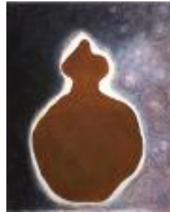
Night Sky Pastel on paper 2015 150 x 120 cm