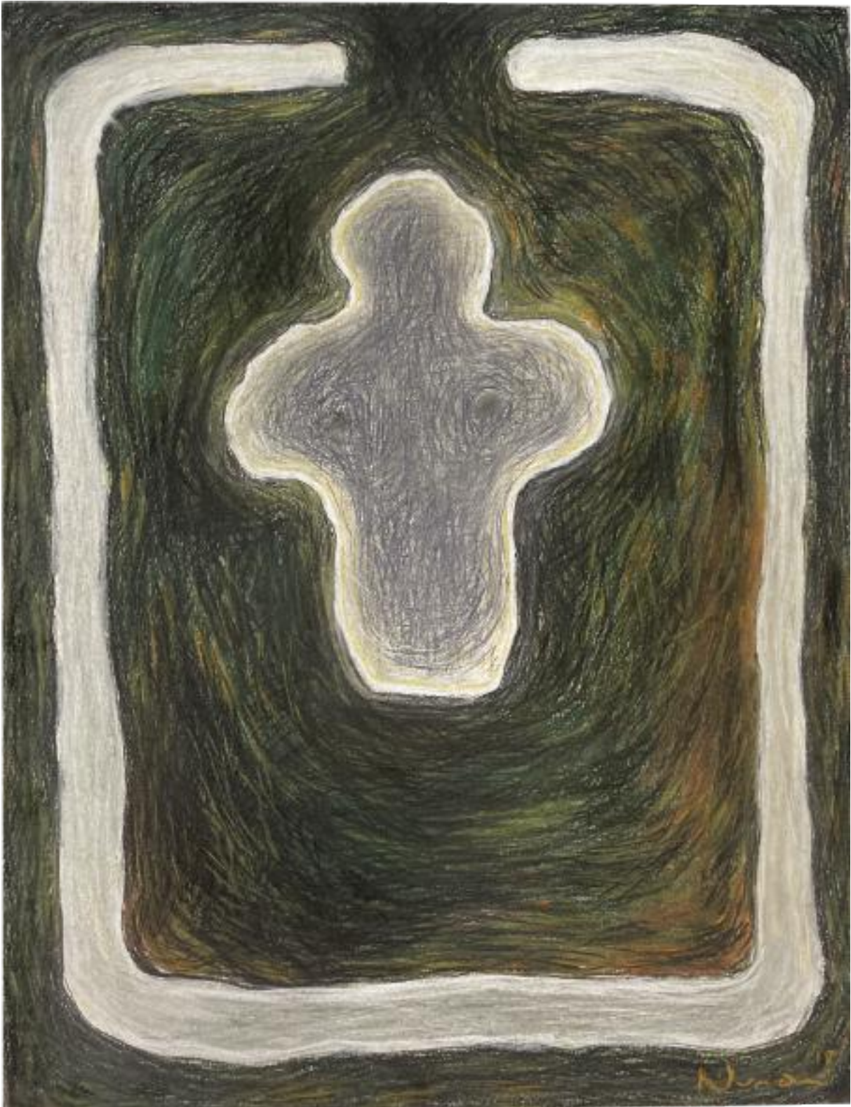
Woman in the Field - Cornwall ancestor series