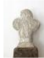
Ancestor Woman Plaster for bronze Edition of 8 20 44 x 32,5 x 14 cm