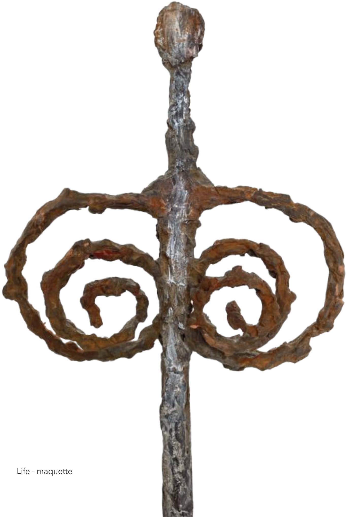
Life - maquette