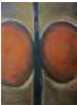
Woman Pastel on paper 2012 69 x 49 cm