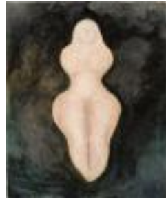
Goddess Pastel on paper 2020 169 x 140 cm