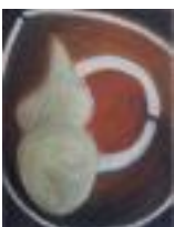
Venus Pastel on paper 2013 65 x 50 cm