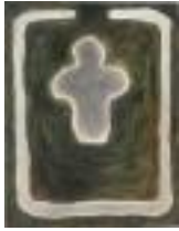
Woman in the Field Cornwall Ancestor series Pastel on paper 2018 64 x 49 cm