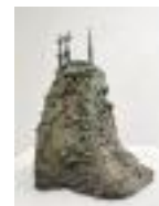
Guardians on the Hill Bronze unique cast 1994 30 x 21 x 15 cm