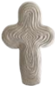
Ancestor Woman Plaster for bronze Edition of 8 2020 86 x 57 x 11 cm