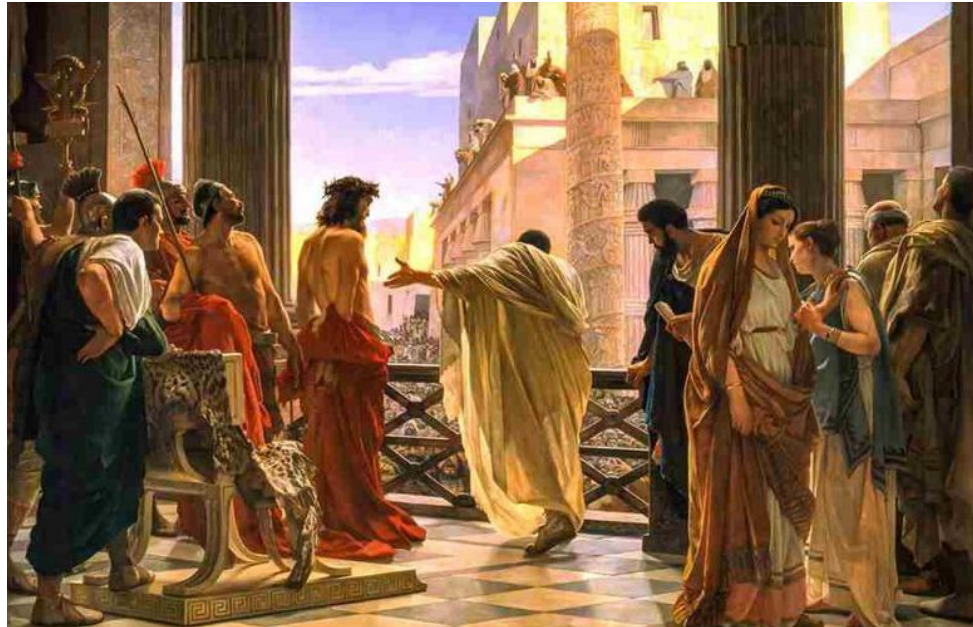
Ecce Homo ( "He ahí el hombre" ) Óleo, Antonio Ciseri (Italia 1871)

Tras su arresto, probablemente circularon rumores sobre los golpes, la tortura y la humillación que estaba sufriendo. María se habría sentido impotente y destrozada al saber que su hijo sufría tanto. María habría