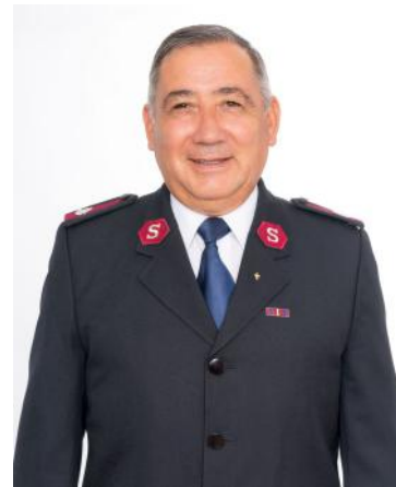
Mayor Hernán Moya Perú

Yo no sé qué proceso estás viviendo o cuál es la situación que te aflige hoy, pero recuerda que Él está presente y obra de manera maravillosa cuando necesitamos de su ayuda y guía.