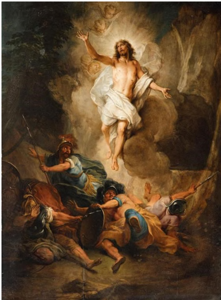
La resurrección de Cristo Óleo de Nicolas Bertin (París, 1667-1736)

Tal vez te estés enfrentando ahora a situaciones difíciles en tu vida. Debes estar seguro de esto: Dios tendrá la última palabra, y ningún enemigo o circunstancia puede oponerse a la palabra de nuestro Dios Todopoderoso.