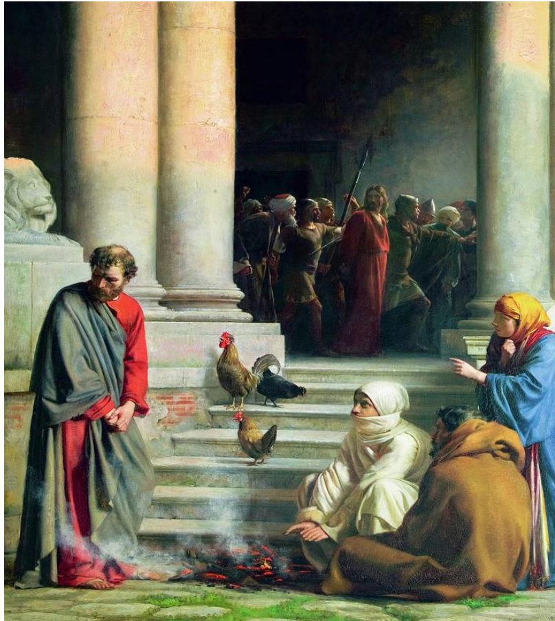
La negación de Pedro

el miedo (Mateo 28:2-4). Todo esto demostró que ningún pueblo o poder en la tierra puede impedir que Dios tenga la última palabra. Jesús había resucitado, estaba vivo de nuevo,