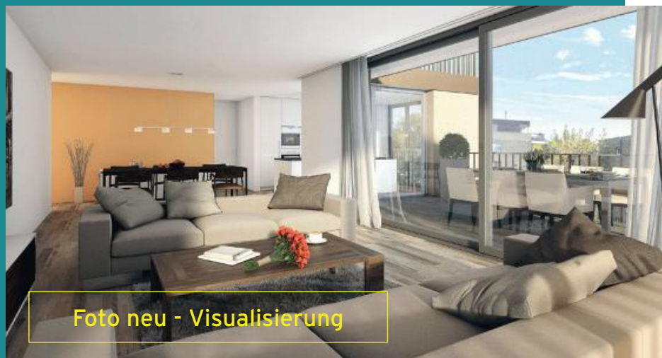
Foto neu - Visualisierung