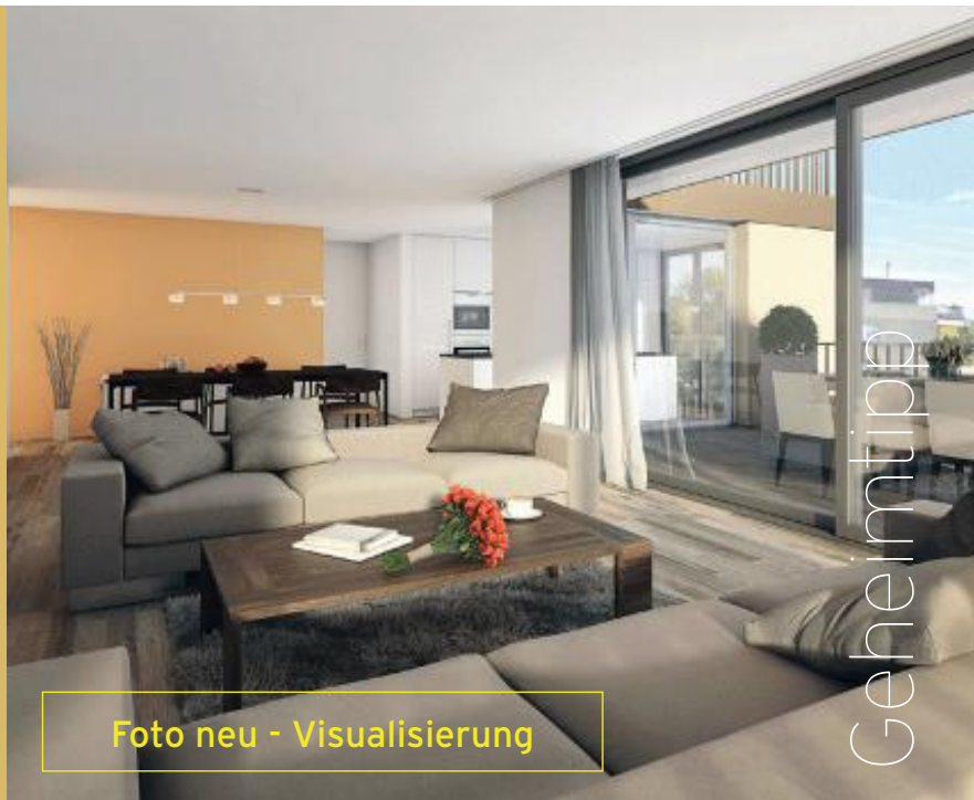
Foto neu - Visualisierung

Wenn Sie eines der Apartments kaufen möchten, sollten Sie sich schnell entscheiden, das Interesse ist groß, wobei die weiteren vier erst zu einem späteren Zeitpunkt errichtet werden.