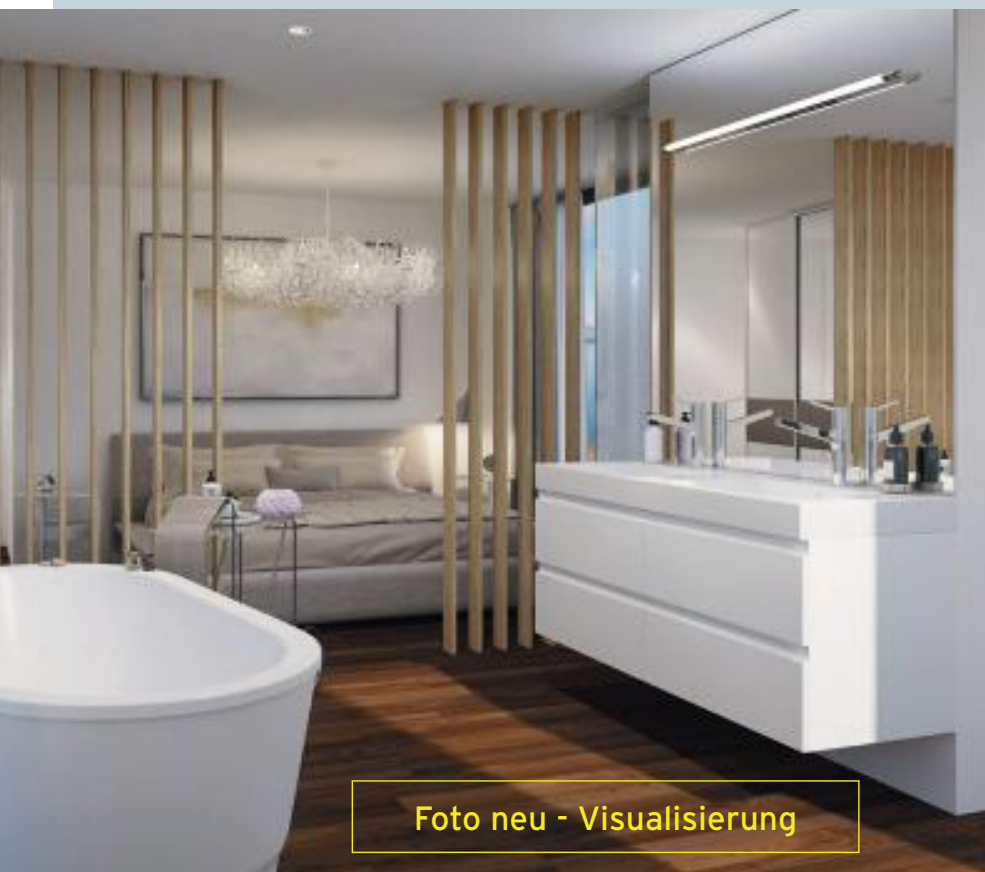
Foto neu - Visualisierung

In Ihrem neuen Zuhause gibt jedes Detail den Ton an.