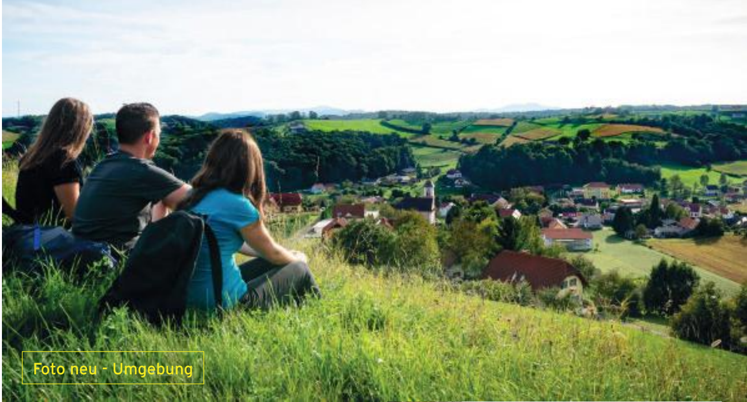
Foto neu - Umgebung