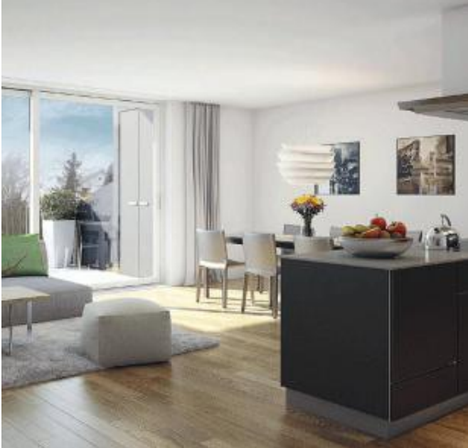
Foto neu - Visualisierung