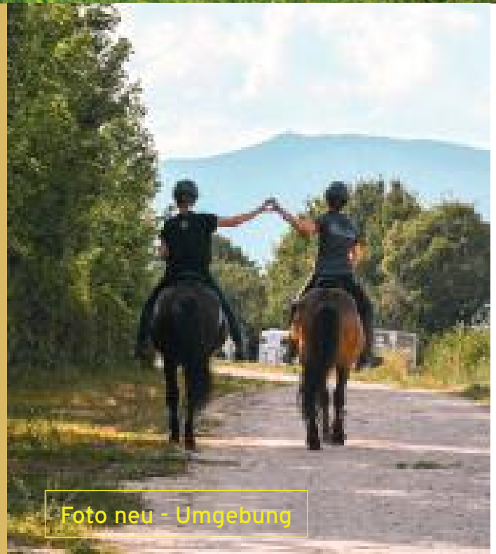
Foto neu - Umgebung

Sie werden auch die umliegenden, heimeligen Buschenschanken und Heurigen lieben, sowie die vielfältigen Restaurants in Fürstenfeld, ebenso wie die hohe Kochkunst im nur 65 km entfernten Graz.