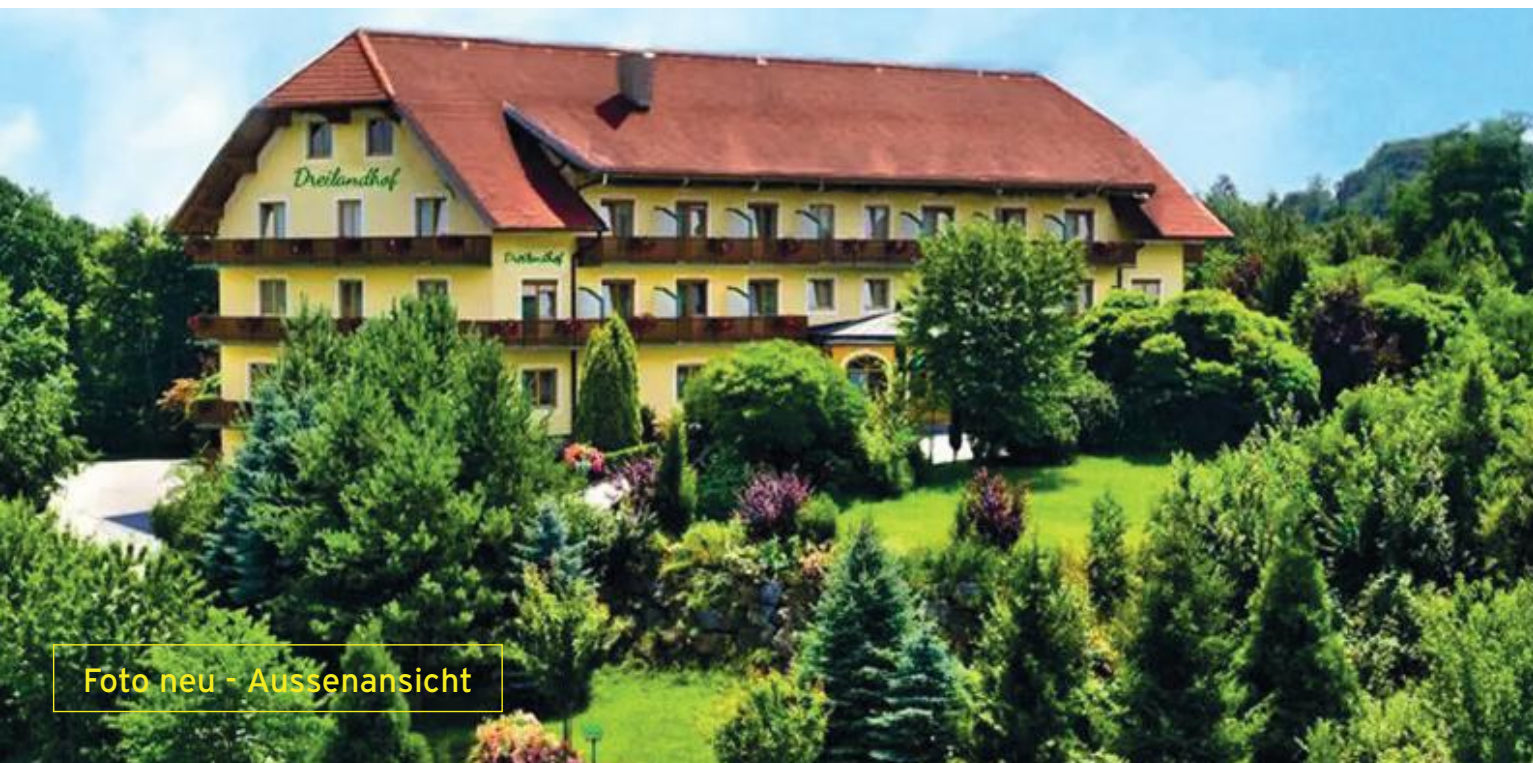
Foto neu - Aussenansicht