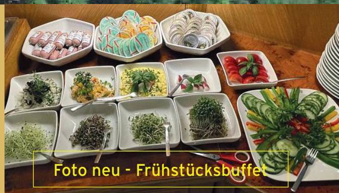
Foto neu - Frühstücksbuffet

Das romantische, bestens beleumundete Frühstückshotel ist umgeben von Wäldern, Grün- und Ackerflächen in einem dünn besiedelten Gebiet, ohne direkte Nachbarn.