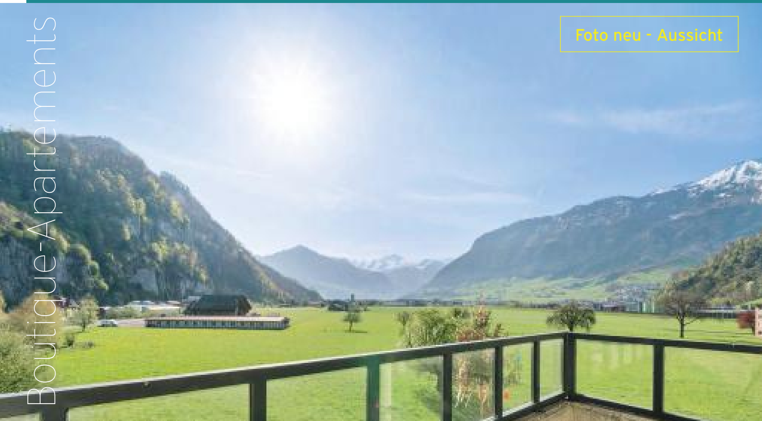
Foto neu - Aussicht