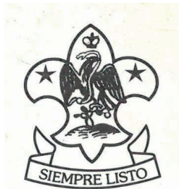
Exploradores Mexicanos de la República Mexicana.

VII. Conocer el alfabeto internacional Morse. Saber transmitir y recibir partes por medio del semáforo de banderas.