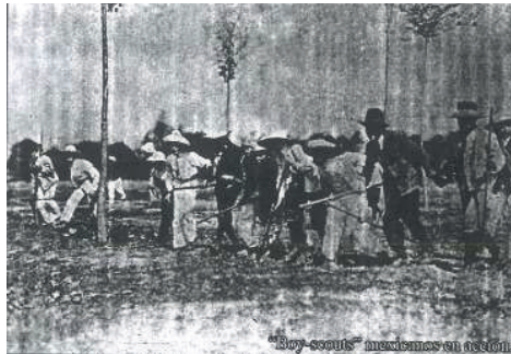
““Boy-scouts’ mexicanos en acción”, fotografía publicada en El Mundo Ilustrado .