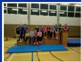
Leichtathletik 10/11 Jahre U12

Trainingszeiten: Montag 17:00-18:00 Uhr Trainerin: Pia Gebauer Syke Schiffer