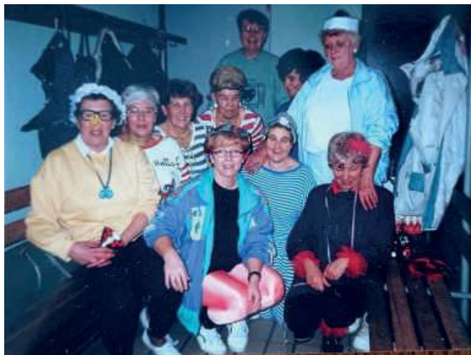
Karneval und die Geselligkeit gehörten vom ersten Tag an dazu.