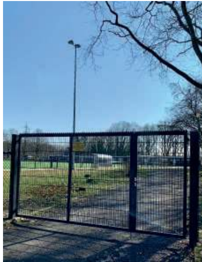
Das während der Bauzeit demolierte Tor wurde durch ein neues ersetzt.

Die zwei Eingänge zur Sportanlage am alten Kassenhäuschen an der Reuterstraße und am Parkplatz Stadionstraße sind in Eigenleistung der Alemannia mit neuen Toren versehen worden, die ein wenig Schutz bieten