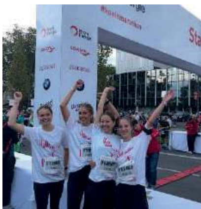
Auch außerhalb des Rasens, sportlich immer aktiv.

Exakt 116 Kilometer trennen die Wahlheimat einiger aktiver Alemannen und unser geliebtes Heribert-Ramrath-Stadion in Pfalzdorf. Dennoch nehmen die Sportlerinnen und Sportler den Weg entlang der A57 Woche für Woche in Kauf, um die Trainingsabende und Spiele ihrer Alemannia aktiv mitzugestalten. Grund genug, euch einmal die „kölschen Alemannen“ vorzustellen.