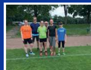
Leichtathletik Lauf Mittel- und Langstrecke ab 14 Jahren