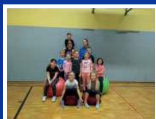
Kinderleichtathletik 8-9 Jahre U10