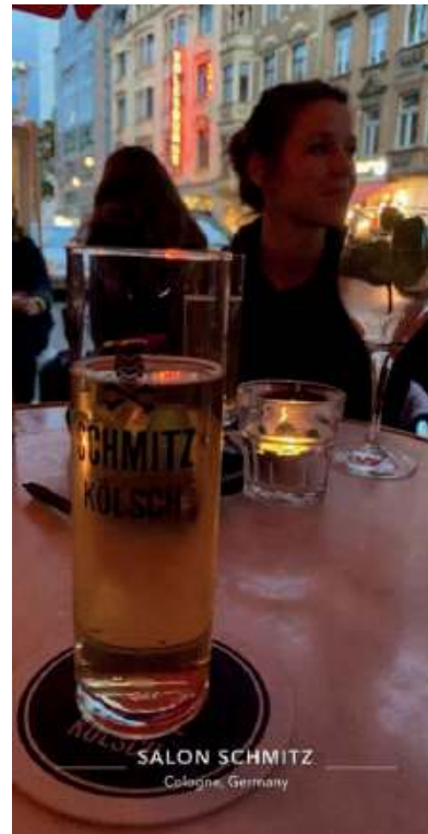
Ein Kölsch im Salon Schmitz schmeckt einfach lecker.