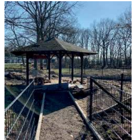
Hier entsteht für die jungen Fans und Besucher ein Spielplatz.

können vor unbefugtem Betreten der Sportanlage. Und auch die Stadt Goch trägt kräftig bei, das Bild der Sportanlagen der Alemannia in der Öffentlichkeit zu verschönern: auf dem ehemaligen Gelände der Schützen an der Stadionstraße werden jetzt Spielgeräte für die kleinen Bürger im Umfeld und die kleinen Bürger, die mit ihren Geschwistern, Eltern oder Freunden unsere