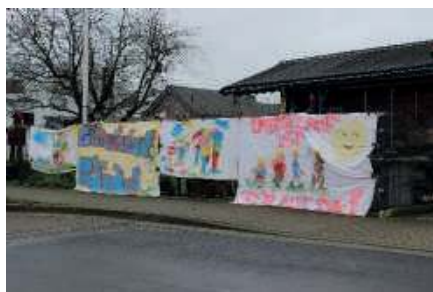
Vier Motto-Plakate unterstützten die Läufer.

schon morgens um sieben Uhr Richtung Schule, um dort die Leichtathletikabteilung beim Aufbau zu unterstützen. Der Silvestertag war jedes Jahr voll belegt. Der Lauf gehörte