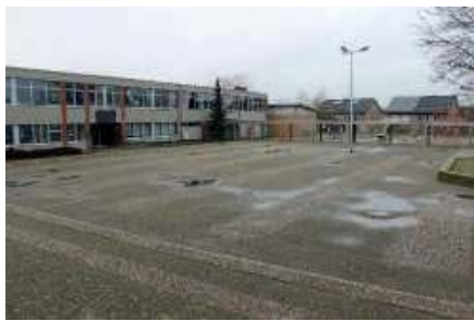
Am Schulhof herrscht sonst reges Treiben.

Am Silvestertag 2020 mache ich mich um 11:00 Uhr auf den Weg zum eigentlichen Epizentrum des Pfalzdorfer Sylvesterlaufs: das Schulzentrum unweit der St. Martinus-Kirche.