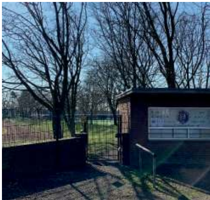
Neue Zaunanlage am Kassenhäuschen Reuterstraße.

können vor unbefugtem Betreten der Sportanlage. Und auch die Stadt Goch trägt kräftig bei, das Bild der Sportanlagen der Alemannia in der Öffentlichkeit zu verschönern: auf dem ehemaligen Gelände der Schützen an der Stadionstraße werden jetzt Spielgeräte für die kleinen Bürger im Umfeld und die kleinen Bürger, die mit ihren Geschwistern, Eltern oder Freunden unsere