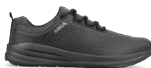
403222 / DYNAMIC / O2 SRC