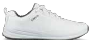
403222 / DYNAMIC / O2 SRC