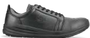
403233 / LIFEGRIP / O2 SRC

Het is misschien niet op het eerste gezicht duidelijk. Maar er gaat een echte werkschoen schuil achter het sneakermodel. Een schoen die alle comfort en functionaliteit biedt die u van werkschoenen mag verwachten. Ontworpen en ontwikkeld voor mensen die werken in de keuken-, hotel- en restaurantsector.