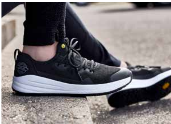
403211 / LIFE / O1 SRC

Het is misschien niet op het eerste gezicht duidelijk. Maar er gaat een echte werkschoen schuil achter het sneakermodel. Een schoen die alle comfort en functionaliteit biedt die u van werkschoenen mag verwachten. Ontworpen en ontwikkeld voor mensen die werken in de keuken-, hotel- en restaurantsector.