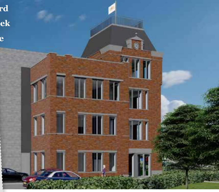
< Vervaardiger Attema, Y., Rijksdienst voor het Cultureel Erfgoed, Documentnummer 552.248

Op de nieuwe locatie zal de productie, assemblage en verpakking van een groot deel van het assortiment plaatsvinden. “Ons huidige aanbod bestaat uit zo’n