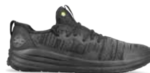
403244 / COMFIT / O1 SRC