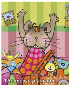
The messy playroom