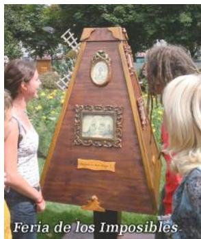
Feria de los Imposibles

17:30 y 21:00h MUSICAL. CHICAGO EL MUSICAL Lugar: CAEM. Entradas: 39, 47 y 54 €