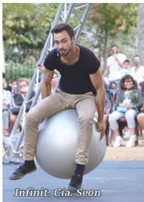
Infinit. Cía. Seon