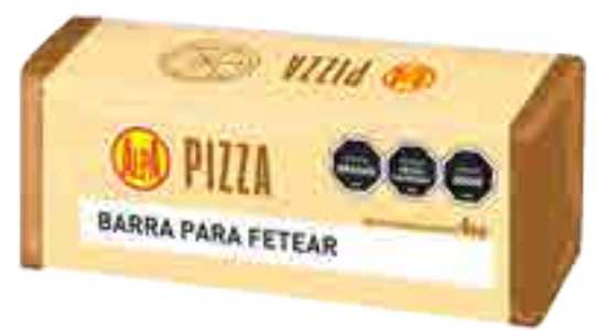
Alpa Pizza Cont. Neto 4 kg