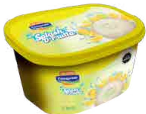
Helado Limón Cont. Neto 2 Litros