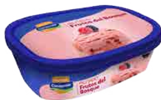
Helado Frutos del Bosque Cont. Neto 1 Litro