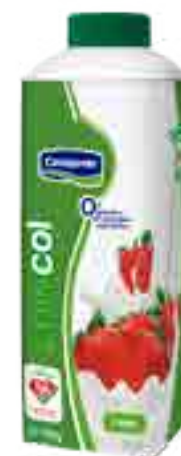
Frutilla 0% Cont. Neto 750 grs