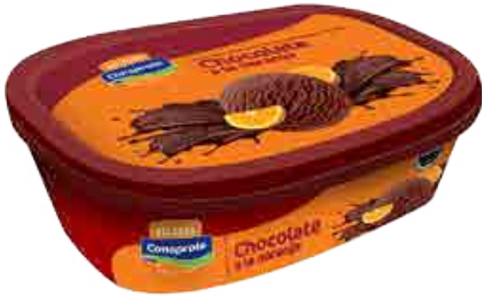
Helado Chocolate a la Naranja Cont. Neto 1 Litro