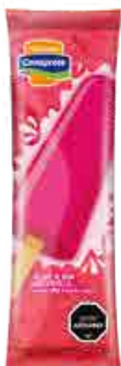
Helado de Frutilla Cont. Neto 58 grs