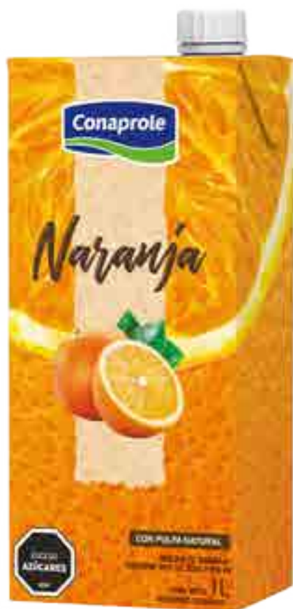
Jugo Naranja Cont. Neto 1 litro