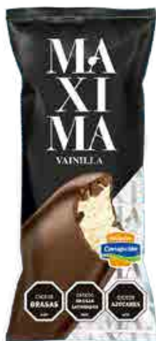
Maxima Vainilla Cont. Neto 62 grs