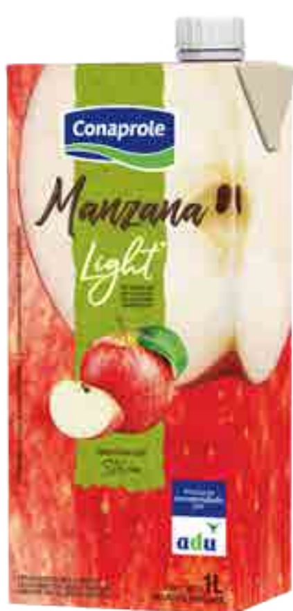
Jugo Manzana Light Cont. Neto 1 litro