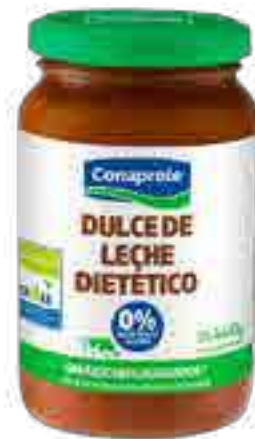
Dulce de Leche Dietético Cont. Neto 440 grs

0% grasa, 0% colesterol, sin azúcares agregado