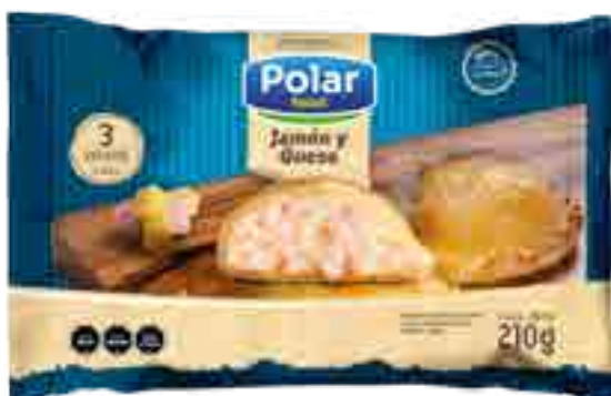
Empanadas Jamón y Queso 3 unidades Cont. Neto 210 grs