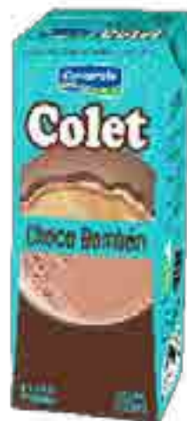
Colet Choco Bombón Cont. Neto 250 ml