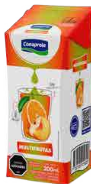
Jugo Multifrutas Cont. Neto 250 ml