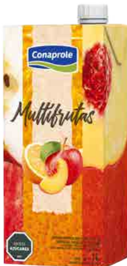
Jugo Multifrutas Cont. Neto 1 litro