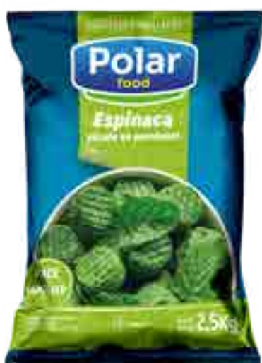
Espinaca Picada en Porciones Cont. Neto 2,5 kg