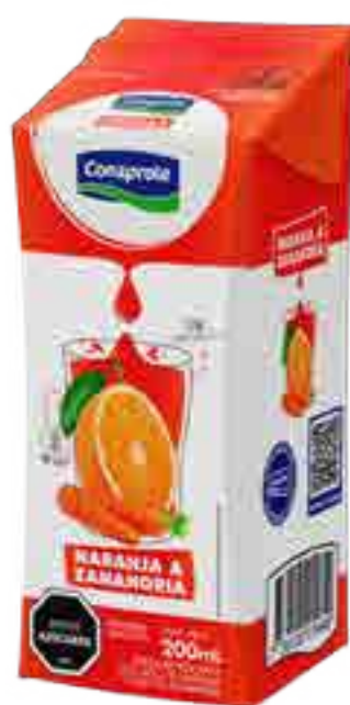
Jugo Naranja y Zanahoria Cont. Neto 250 ml