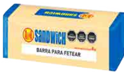
Queso Sandwich Alpa Cont. Neto 4 kg