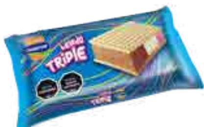
Triple Crema, Chocolate y Frutilla Cont. Neto 75 grs