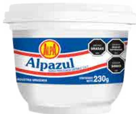
Queso Alpazul Cont. Neto 230 grs