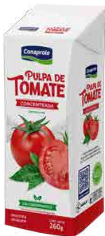
Pulpa de Tomate Cont. Neto 260 grs