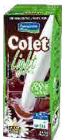
Colet Light Cont. Neto 250 ml