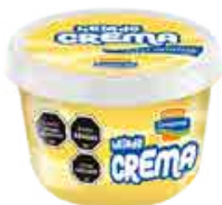
Helado Crema Cont. Neto 250 ml