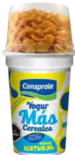
Más Cereales Cont. Neto 166 grs