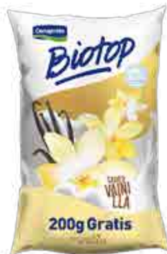
Biotop Vainilla Cont. Neto 1,2 kg