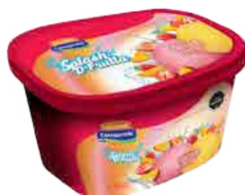
Helado Frutilla y Mango Cont. Neto 2 Litros