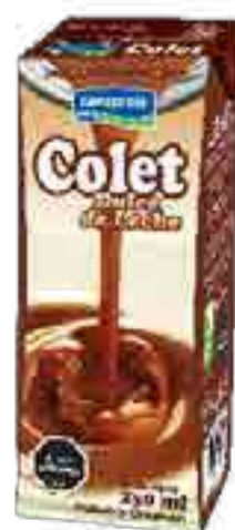
Colet Dulce de Leche Cont. Neto 250 ml