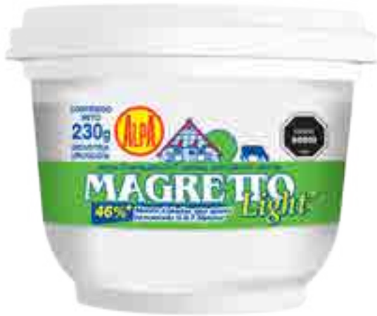
Queso Magretto Light Cont. Neto 230 grs