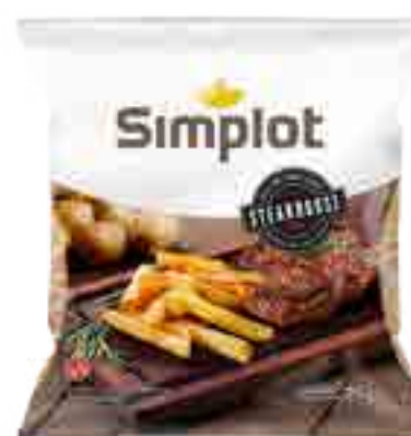
Papas Steakhouse Cont. Neto 2 kg