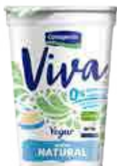
Viva Natural Cont. Neto 200 grs