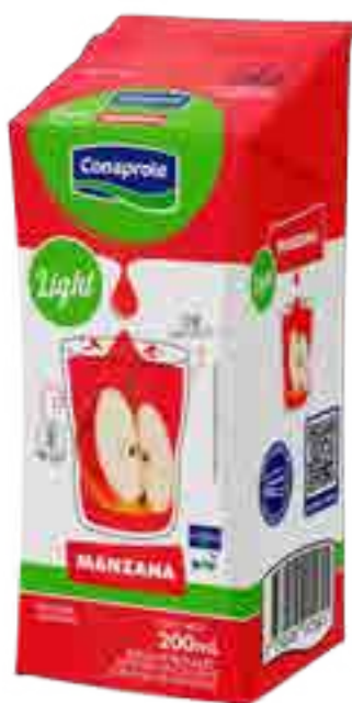
Jugo Manzana Light Cont. Neto 250 ml