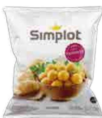
Papas Noisettes Cont. Neto 1,1 kg