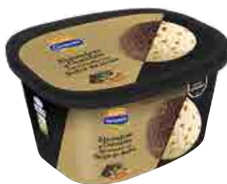
Almendras y Chocolate tipo Holandés con Dulce de leche Cont. Neto 2 Litros