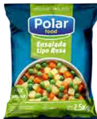
Ensalada Jardinera / Rusa Cont. Neto 2,5 grs