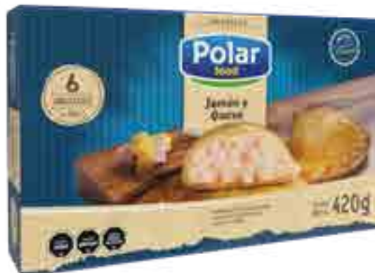
Empanadas Jamón y Queso 6 unidades Cont. Neto 420 grs