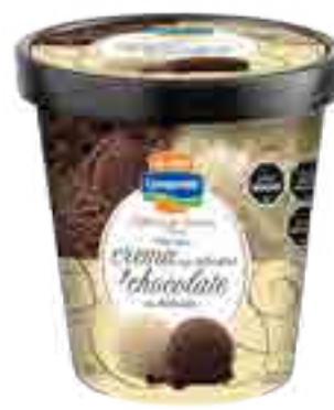
Crema tipo Irlandesa y Chocolate tipo Holandés