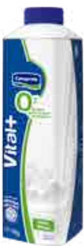
Natural 0% Cont. Neto 1 kg

0% grasa, 0% colesterol, sin azúcares agregado