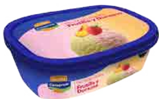
Helado Frutilla y Durazno Cont. Neto 1 Litro