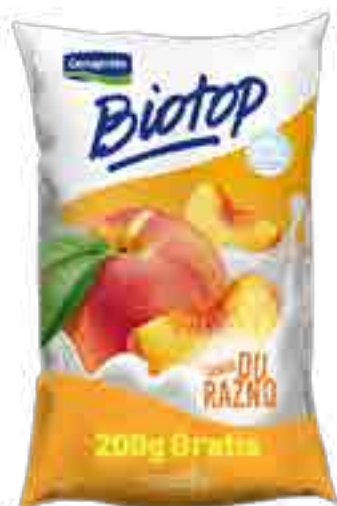
Biotop Durazno Cont. Neto 1,2 kg