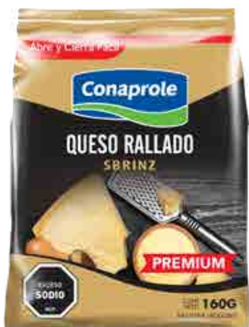
Queso Rallado Cont. Neto 160 grs