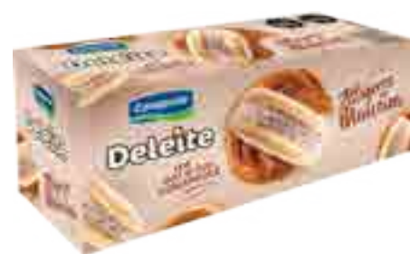
Alfajores Maicena Cont. 6 uni x 60 grs (360 grs)