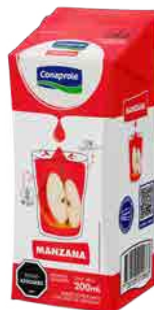
Jugo Manzana Cont. Neto 250 ml