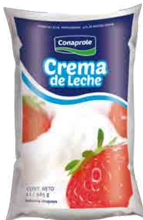
Crema de Leche Cont. Neto 1 litro