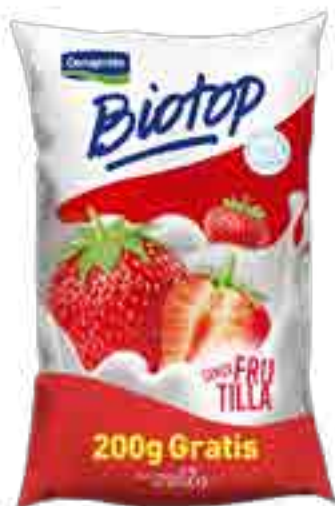
Biotop Frutilla Cont. Neto 1,2 kg