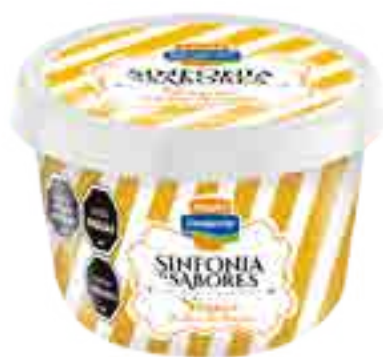
Súper Dulce de Leche Cont. Neto 250 ml