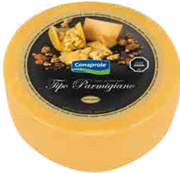
Queso Parmigiano Cont. Neto 7,5 kg