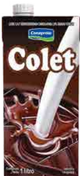
Colet Clásico Cont. Neto 1 Litro