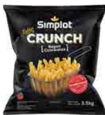
Papas Tradicionales Extra Crunch Cont. Neto 2,5 kg