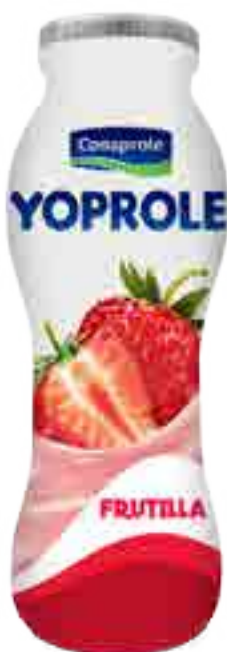
Yoprole Frutilla Cont. Neto 185 grs