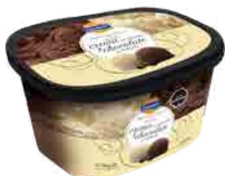
Crema tipo Irlandesa y Chocolate tipo Holandés Cont. Neto 2 Litros