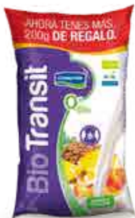
Ananá Durazno Light Cont. Neto 1,2 kg