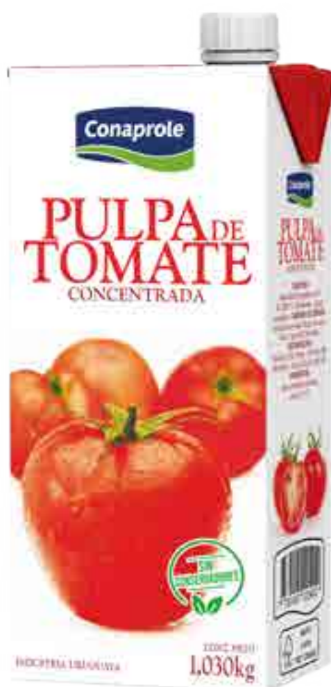
Pulpa de Tomate Cont. Neto 1,030 grs