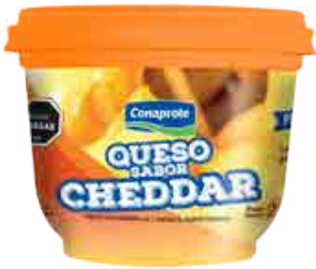
Queso Sabor Cheddar Cont. Neto 230 grs