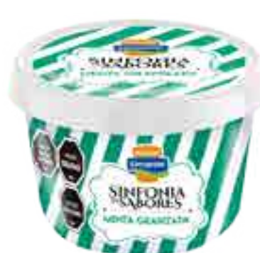
Menta Granizada Cont. Neto 250 ml