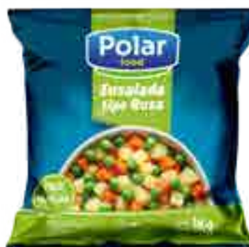
Ensalada Jardinera / Rusa Cont. Neto 1 kg