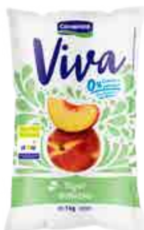
Viva Durazno Cont. Neto 1 kg