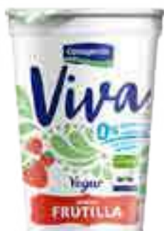
Viva Frutilla Cont. Neto 200 grs

0% grasa, 0% colesterol, sin azúcares agregado