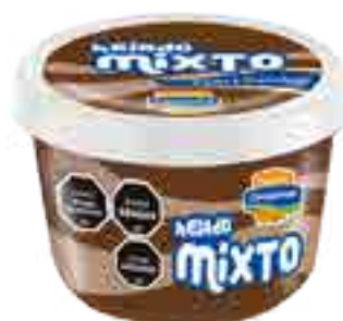
Helado Crema y Chocolate Cont. Neto 250 ml