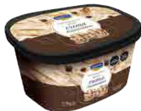
Crema Tramontana Cont. Neto 2 Litros