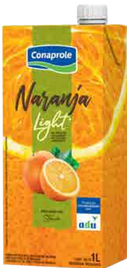
Jugo Naranja Light Cont. Neto 1 litro