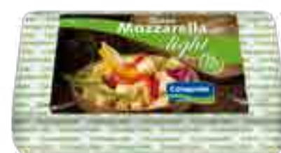
Queso Mozzarella Light Cont. Neto 3 kg