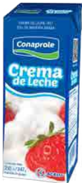
Crema de Leche Cont. Neto 250 ml