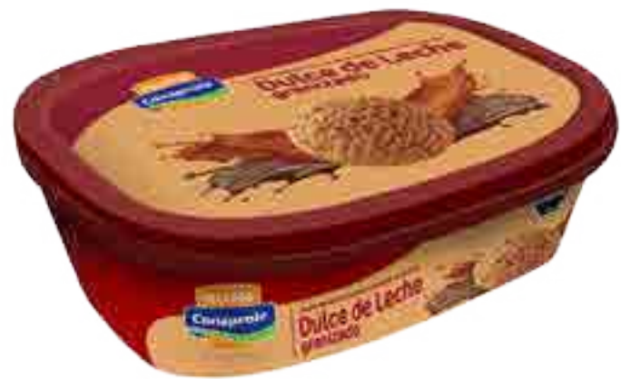
Helado Dulce de Leche Granizado Cont. Neto 1 Litro