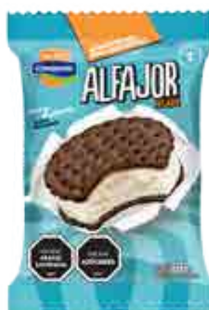
Alfajor Vainilla Cont. Neto 66 grs