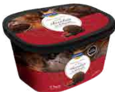
Chocolate tipo Holadés Marmolado con Dulce de Leche Cont. Neto 2 Litros