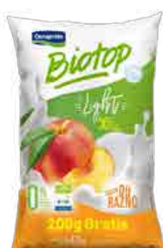
Biotop Durazno Light Cont. Neto 1,2 kg