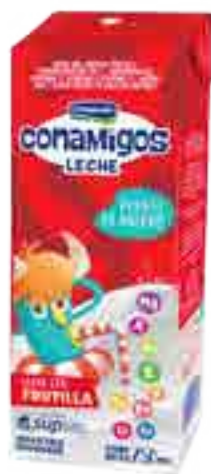
Leche Frutilla Conamigos Cont. Neto 250 ml