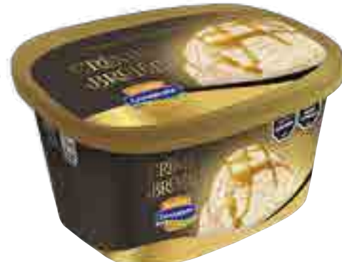
Crème Brûlée Cont. Neto 2 Litros