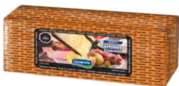
Queso Parrillero Cont. Aprox 3 kg