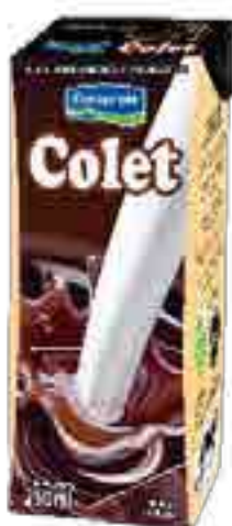
Colet Clásico Cont. Neto 250 ml