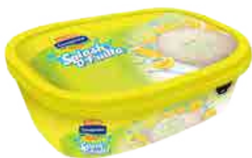
Helado Limón Cont. Neto 1 Litro