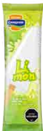
Helado de Limón Cont. Neto 58 grs