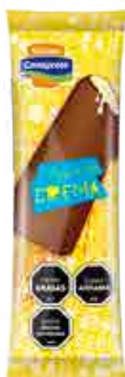
Barrita de Crema Cont. Neto 69 grs