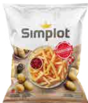
Papas Tradicionales Cont. Neto 2 kg