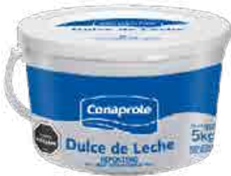
Dulce de Leche Repostero Cont. Neto 5 kg