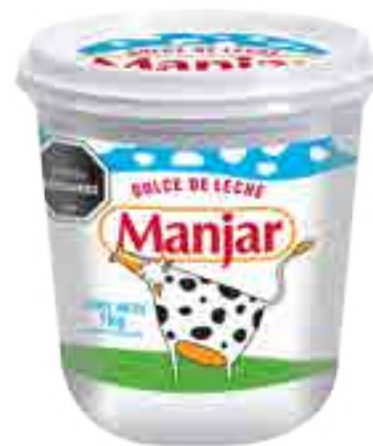
Dulce de Leche Manjar Cont. Neto 1 kg