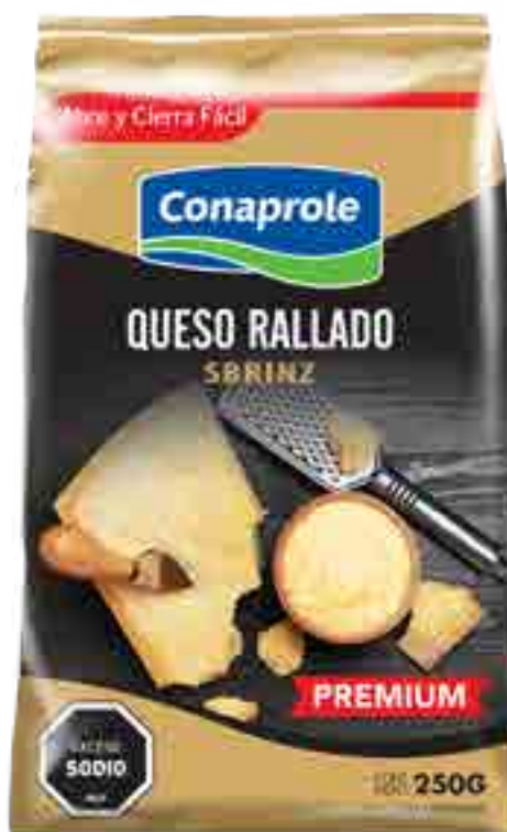
Queso Rallado Cont. Neto 250 grs