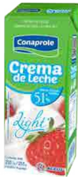
Crema de Leche Light Cont. Neto 250 ml