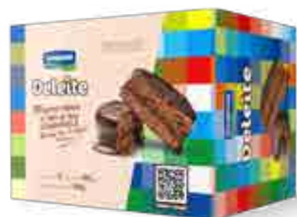
Alfajor Deleite Chocolate Cont. 3 uni x 60 grs (180 grs)