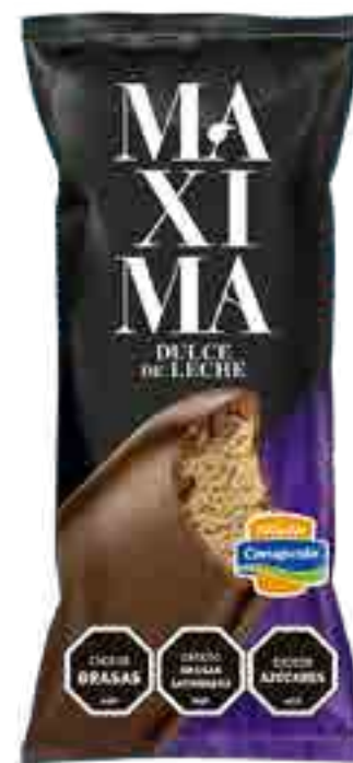
Maxima Dulce de Leche Cont. Neto 65 grs