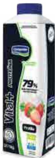
Vital + Proteína Cont. Neto 1 kg