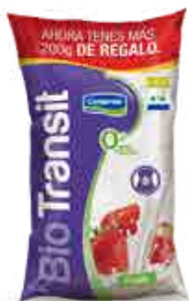
Frutilla Light Cont. Neto 1,2 kg

0% grasa, 0% colesterol, sin azúcares agregado