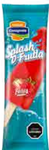
Splash D-Fruta Frutilla Cont. Neto 56 grs