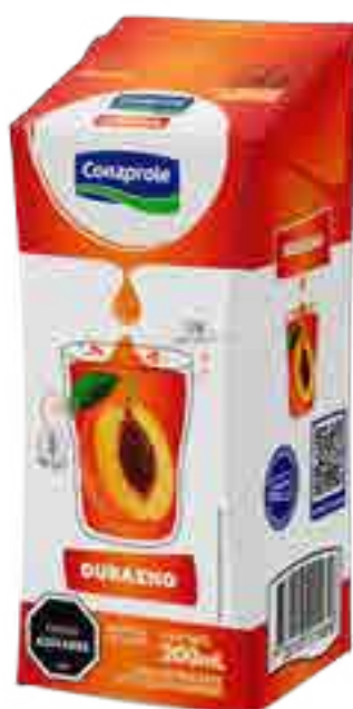
Jugo Durazno Cont. Neto 250 ml