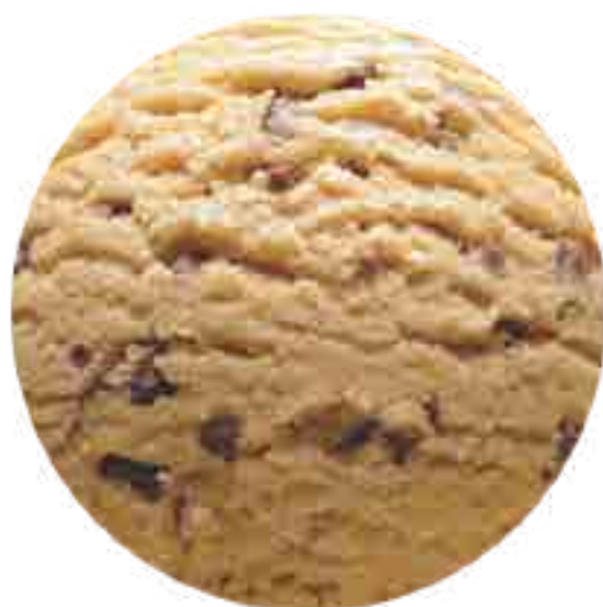
Helado Dulce de Leche granizado