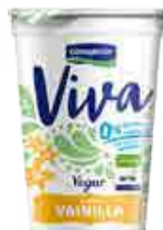
Viva Vainilla Cont. Neto 200 grs