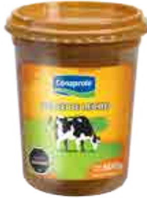
Clásico Cont. Neto 500 grs