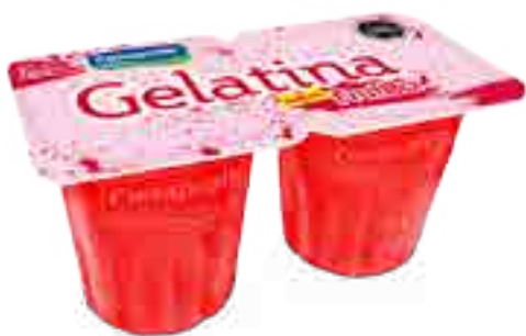
Frutilla Cont. Neto 2 x 104 grs