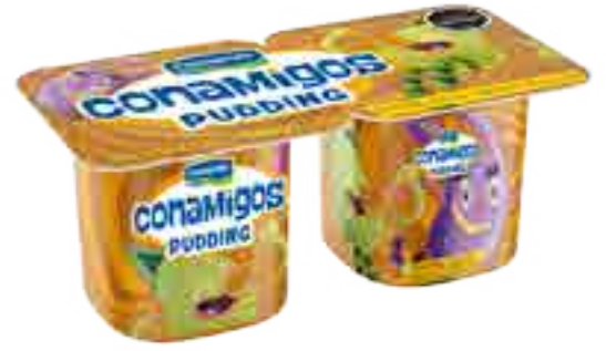
Pudding Dulce de Leche Cont. Neto 2 x 110 grs