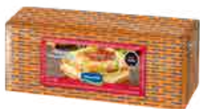
Queso Mozzarella Cont. Neto 3 kg