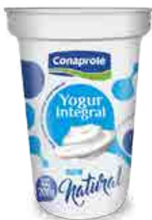
Integral Natural Cont. Neto 200 grs