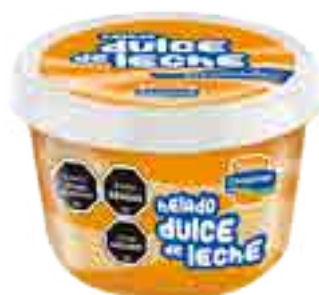
Helado Dulce de Leche Granizado Cont. Neto 250 ml