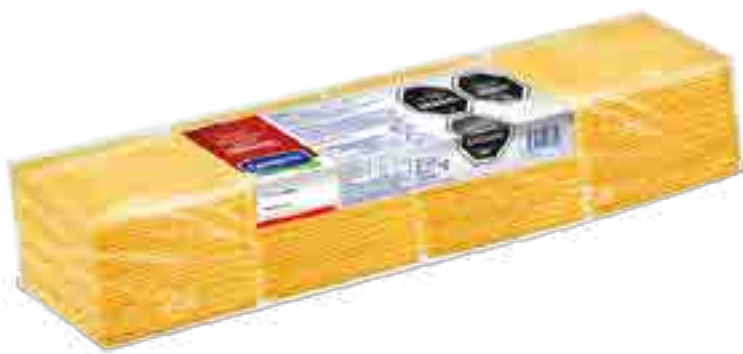
Cheddar en Fetas Cont. Neto 2,270 kg