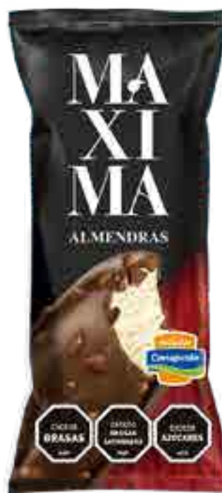
Maxima Almendras Cont. Neto 65 grs