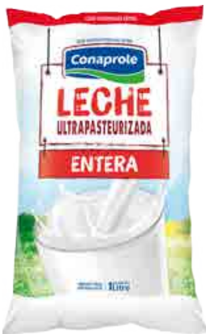
Leche Ultrapasteurizada Entera Cont. Neto 1 Litro