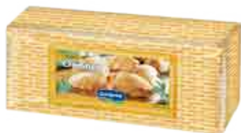
Queso Cremoso Cont. Aprox 3 kg