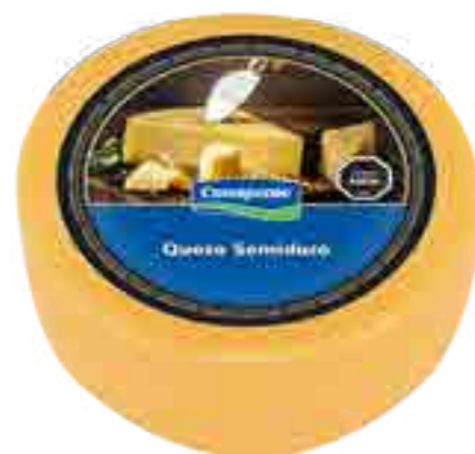
Queso Semiduro Cont. Aprox 6,2 kg