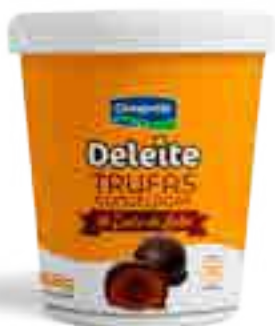
Trufas Chocolate Cont. Neto 168 grs