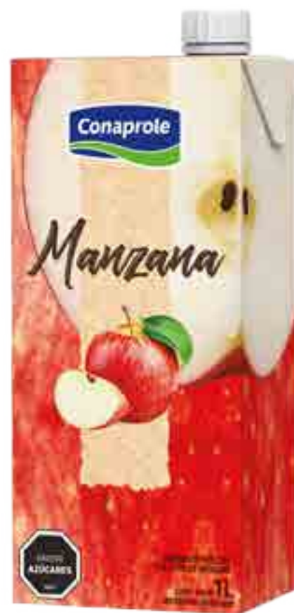
Jugo Manzana Cont. Neto 1 litro