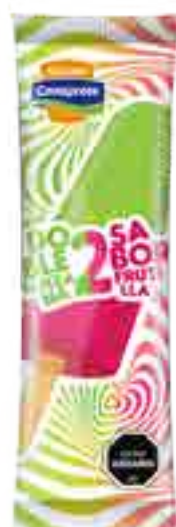
Frutilla Manzana Cont. Neto 58 grs