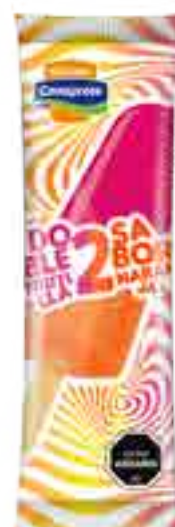
Frutilla Naranja Cont. Neto 58 grs