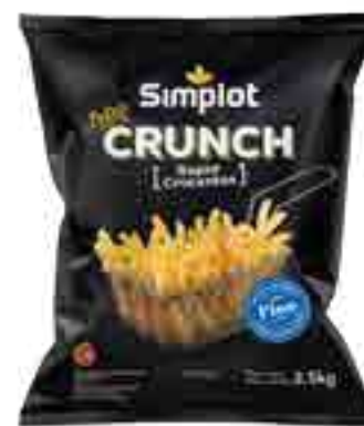
Papas Corte Fino Extra Crunch Cont. Neto 2,5 kg