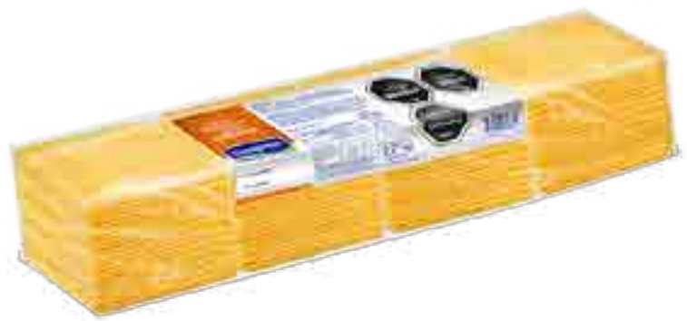
Emmental en Fetas Cont. Neto 2,270 kg