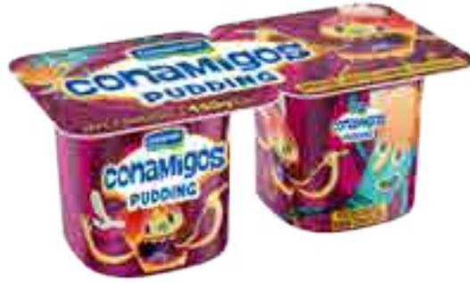
Pudding Chocolate Cont. Neto 2 x 110 grs