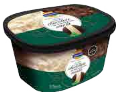
Crema de Chocolate tipo Holandés y Menta Cont. Neto 2 Litros