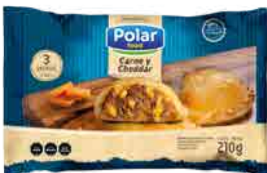
Empanadas Carne y Cheddar 3 unidades Cont. Neto 210 grs