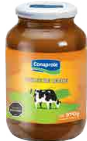
Clásico Cont. Neto 970 grs