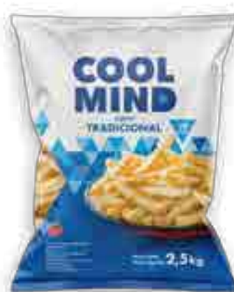
Cool Mind Corte Tradicional Cont. Neto 2,5 kg