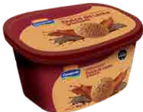
Helado Dulce de Leche Granizado Cont. Neto 2 Litros