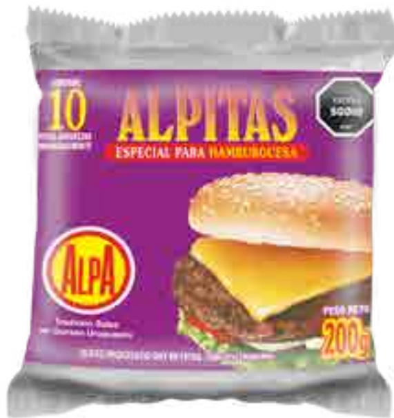
Alpititas para Hamburguesa Cont. Neto 200 grs