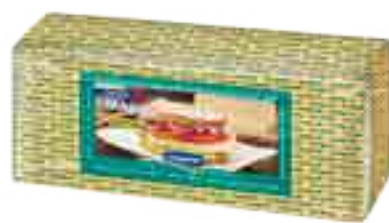
Queso Magro sin sal Cont. Aprox 2,8 kg