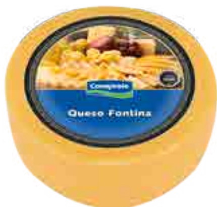
Queso Fontina Cont. Aprox 4,2 kg