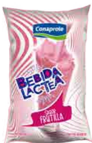
Bebida Láctea Frutilla Cont. Neto 1 Litro