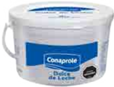
Dulce de Leche Común Cont. Neto 3 kg