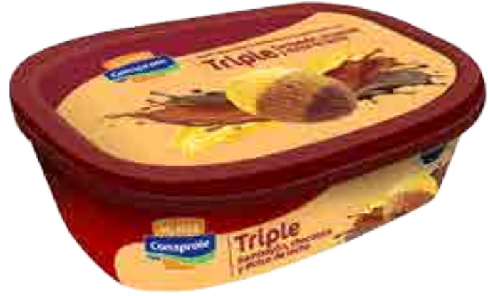
Helado Sambayón, Dulce de Leche y Chocolate Cont. Neto 1 Litro