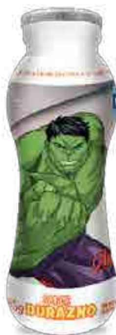
Conamigos Durazno Cont. Neto 185 grs