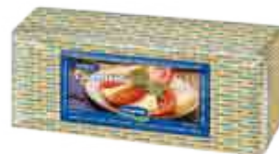
Queso Cuartirolo Cont. Aprox 3,2 kg