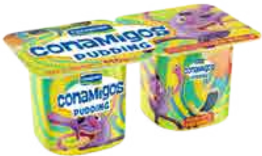
Pudding Vainilla Cont. Neto 2 x 110 grs