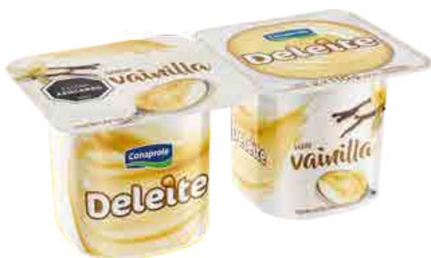
Deleite Vainilla Cont. Neto 2 x 110 grs