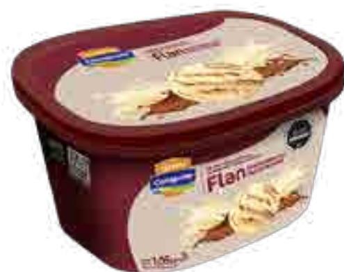
Helado Flan Marmolado Dulce de Leche Cont. Neto 2 Litros