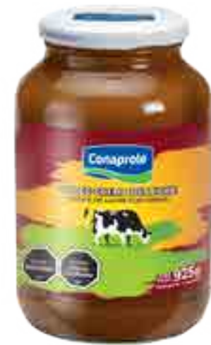
Dulce Crema de Leche Cont. Neto 925 grs