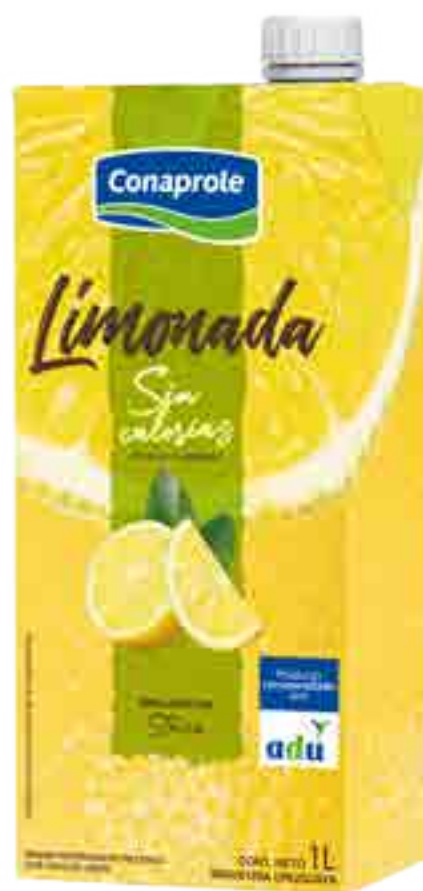
Limonada Light Cont. Neto 1 litro