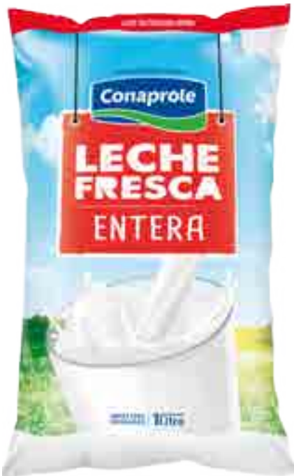
Leche Fresca Entera Cont. Neto 1 Litro