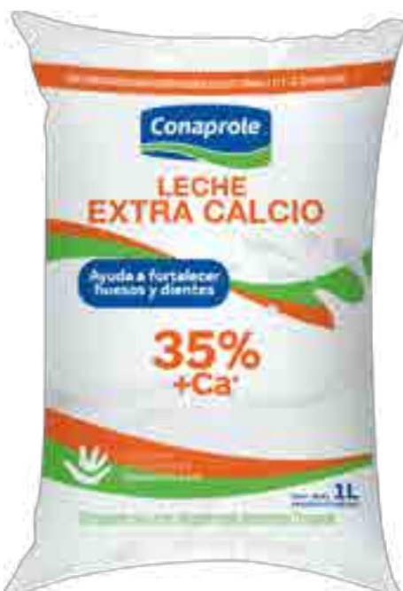
Leche Semidescremada Extra Calcio Cont. Neto 1 Litro