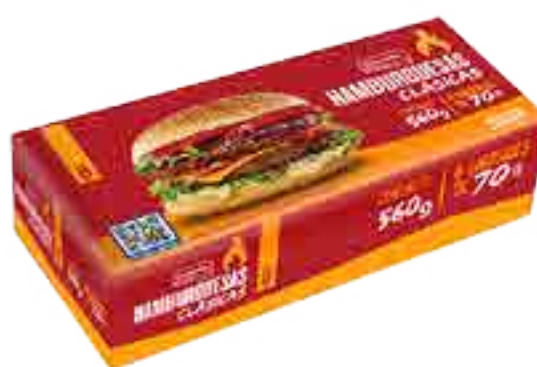
Hamburguesa Clásica Conaprole 8 x 70 g Cont. Neto 560 grs