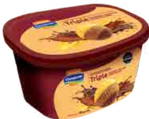
Helado Sambayón, Dulce de Leche y Chocolate Cont. Neto 2 Litros