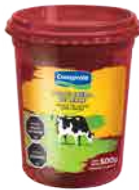
Dulce Crema de Leche Cont. Neto 500 grs