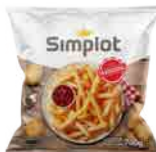
Papas Tradicionales Cont. Neto 700 grs