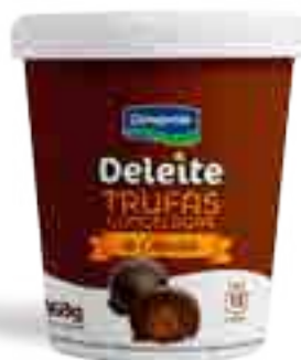
Trufas Dulce de Leche Cont. Neto 168 grs