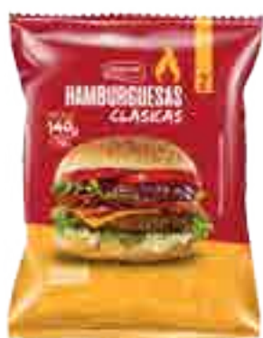
Hamburguesa Clásica Conaprole 2 X 70 g Cont. Neto 140 grs