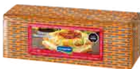
Queso Mozzarella Cont. Neto 5 kg