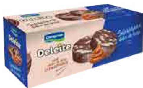
Salchich3n con Dulce de Leche Cont. Neto 500 grs