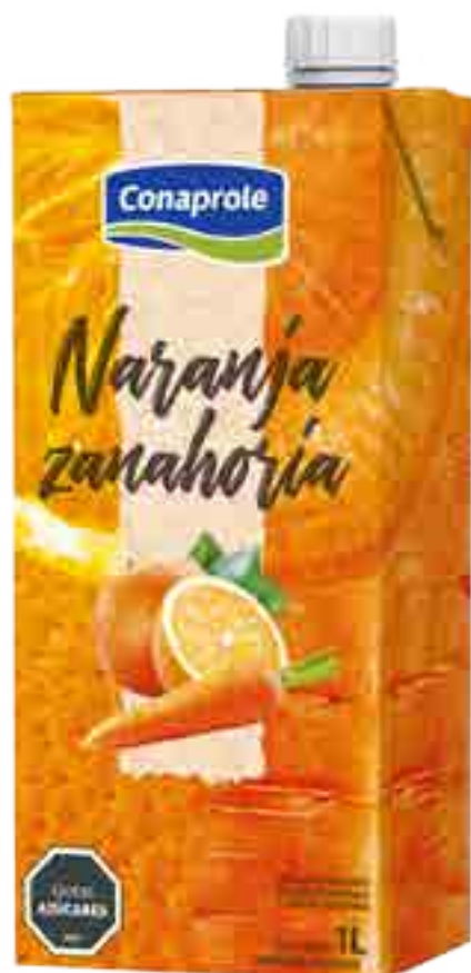
Jugo Naranja y Zanahoria Cont. Neto 1 litro