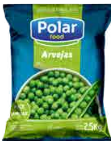
Arvejas Cont. Neto 2,5 kg