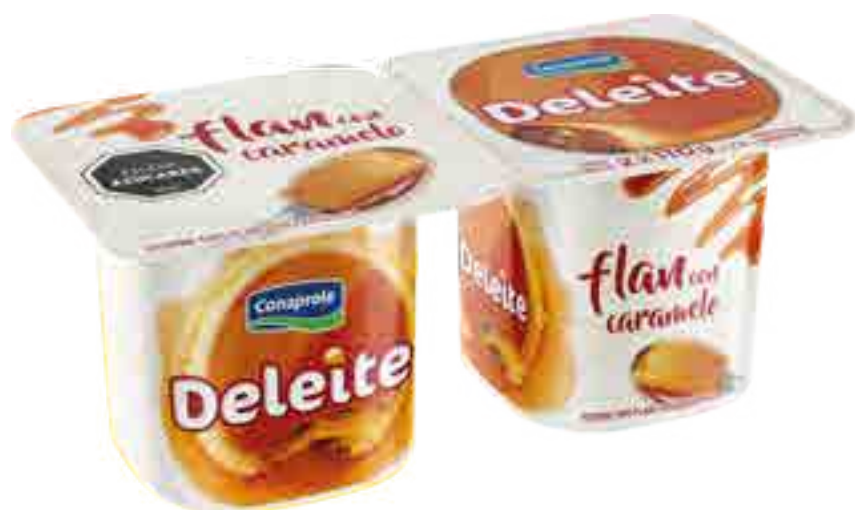
Deleite Flan con Caramelo Cont. Neto 2 x 110 grs