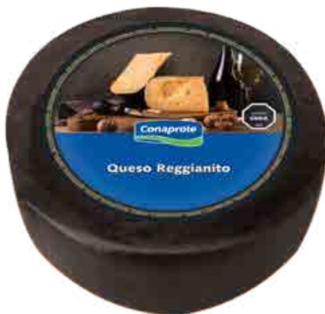
Queso Reggiano Cont. Neto 7,5 kg