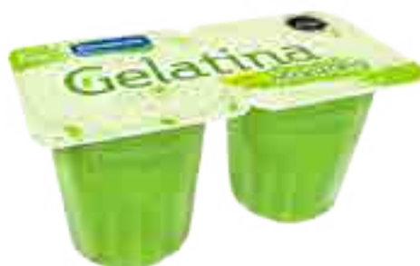
Manzana Cont. Neto 2 x 104 grs