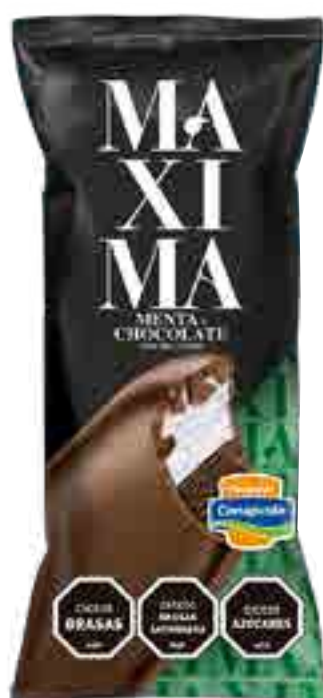
Maxima Menta y Chocolate Cont. Neto 65 grs