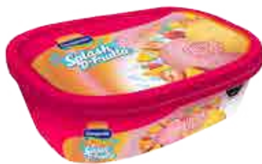
Helado Frutilla y Mango Cont. Neto 1 Litro