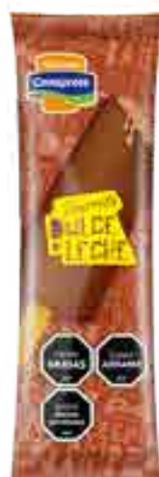
Barrita de Dulce de Leche Cont. Neto 72 grs