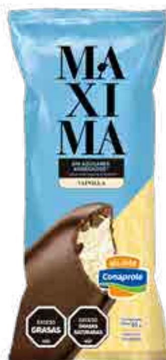
Maxima Vainilla sin azúcares agregados Cont. Neto 65 grs