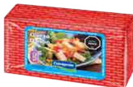
Queso Danbo 0% Lactosa Cont. Aprox 3 kg