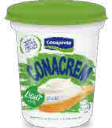
Requesón Cont. Neto 250 grs