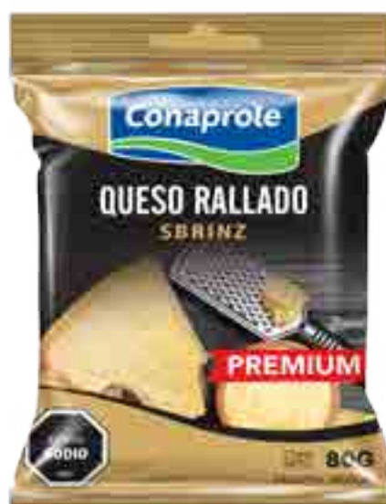
Queso Rallado Cont. Neto 80 grs