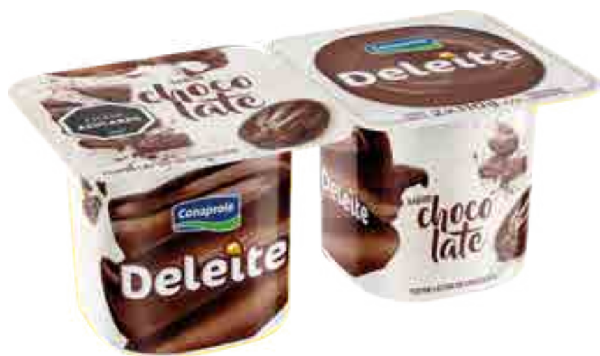
Deleite Chocolate Cont. Neto 2 x 110 grs