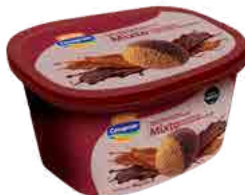
Helado Dulce de Leche y Chocolate Holandés Cont. Neto 2 Litros