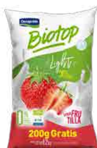
Biotop Frutilla Light Cont. Neto 1,2 kg