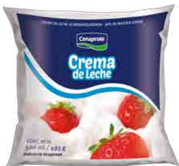
Crema de Leche Cont. Neto 500 ml