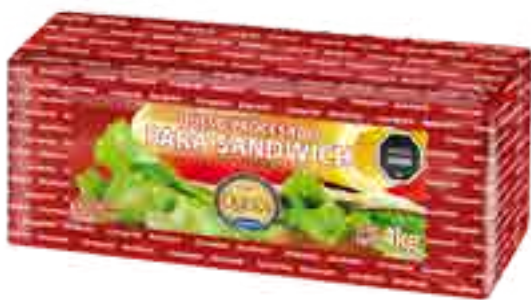
Queso Sandwich Cont. Neto 4 kg