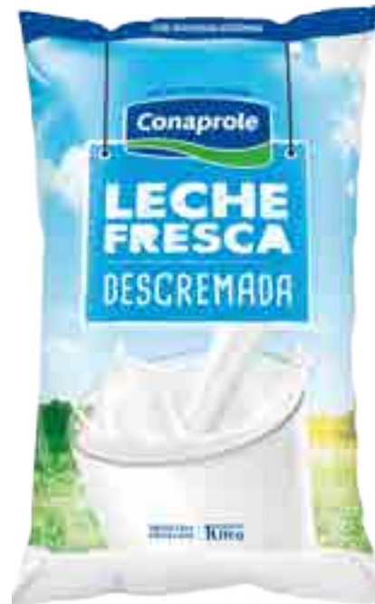
Leche Fresca Descremada Cont. Neto 1 Litro