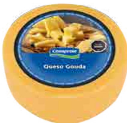
Queso Gouda Cont. Aprox 4,5 kg