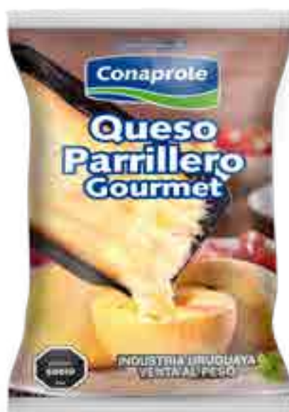
Parrillero en porción Cont. Aprox 350 grs c/u