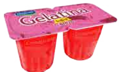
Cereza Cont. Neto 2 x 104 grs