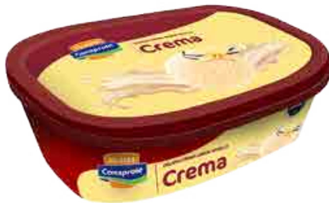
Helado Crema Cont. Neto 1 Litro