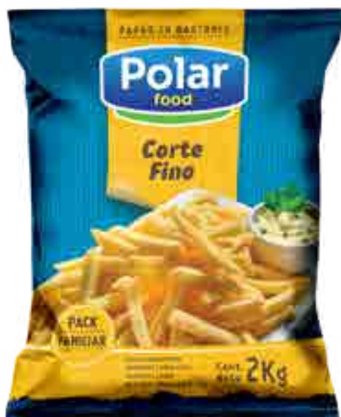
Papas Corte Fino Polar Food Cont. Neto 2 kg