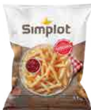
Papas Tradicionales Cont. Neto 1,1 kg