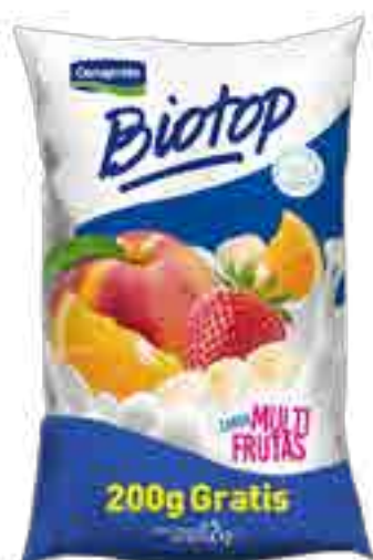
Biotop Multifrutas Cont. Neto 1,2 kg