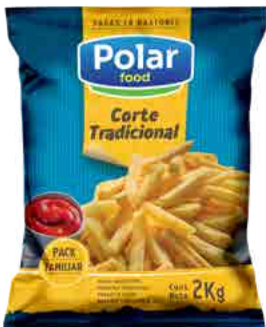
Papas Corte Trad. Polar Food Cont. Neto 2 kg