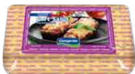
Queso Port salut Cont. Aprox 700 grs