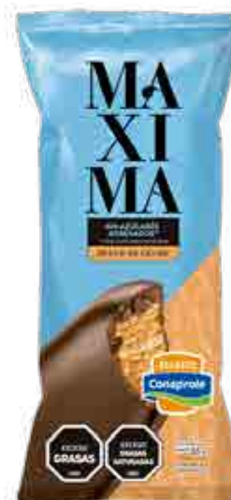
Maxima Dulce de Leche sin azúcares agregados Cont. Neto 65 grs