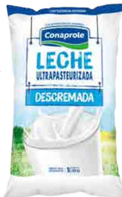
Leche Ultrapasteurizada Desc. Cont. Neto 1 Litro