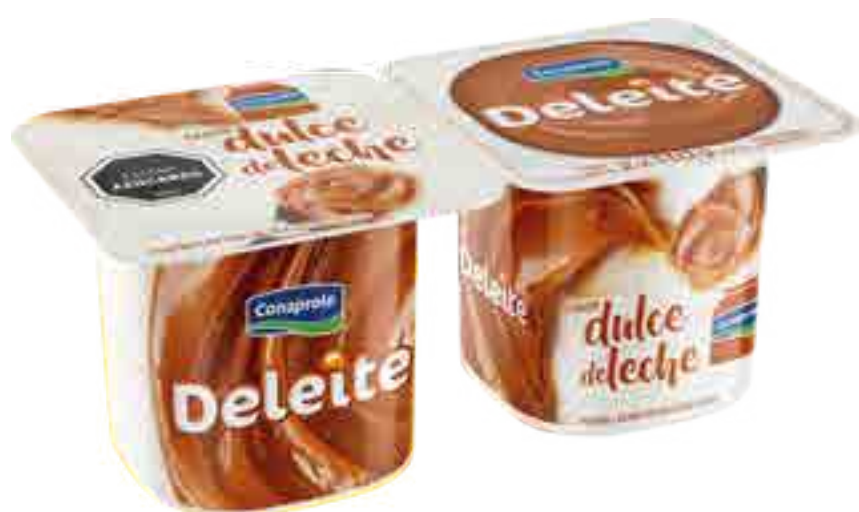
Deleite Dulce de Leche Cont. Neto 2 x 110 grs