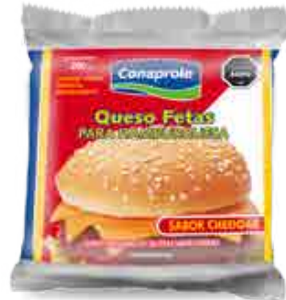
Para Hamburguesas en fetas sabor Cheddar Cont. Neto 200 grs