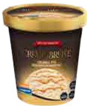
Crème brûlée Marmolado con Caramelo