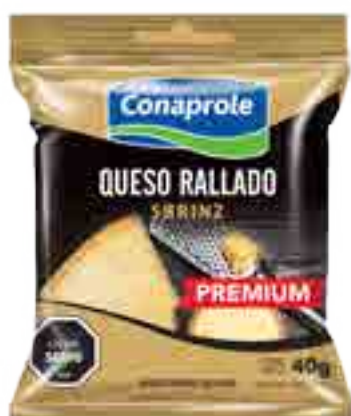
Queso Rallado Cont. Neto 40 grs