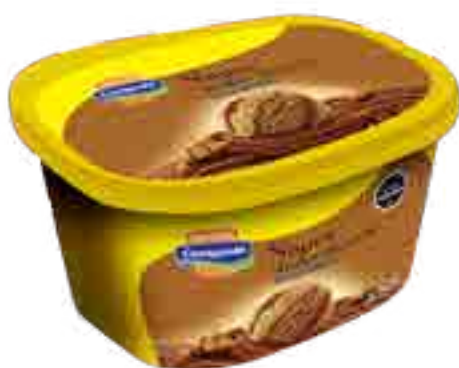
Súper Dulce de Leche Cont. Neto 2 Litros