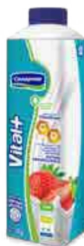
Vital + Inmunidad Cont. Neto 1 kg