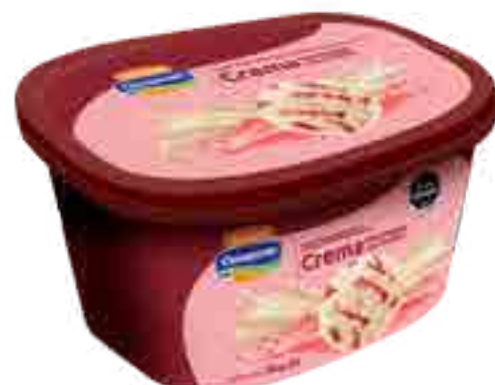
Helado Crema Marmolada con Frutilla Cont. Neto 2 Litros