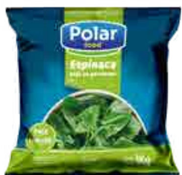
Espinaca Hoja en Porciones Cont. Neto 1 kg