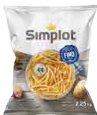
Papas Corte Fino Cont. Neto 2,25 kg