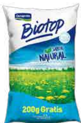
Biotop Natural Cont. Neto 1,2 kg