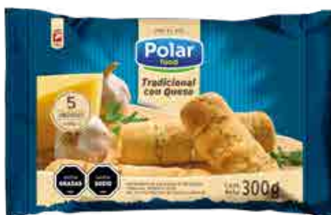
Pan de ajo Polar Food Cont. Neto 300 g