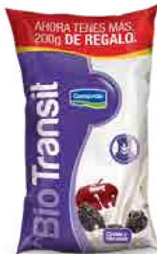
Manzana Ciruela Cont. Neto 1,2 kg