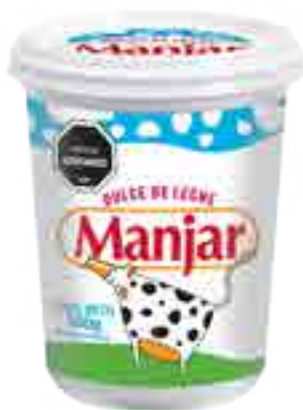
Dulce de Leche Manjar Cont. Neto 500 grs