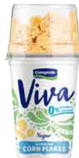
Viva Corn Flakes Cont. Neto 162 grs