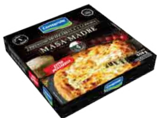
Pizza Masa Madre extra Mozzarella 1 unidad Peso Neto 508 grs