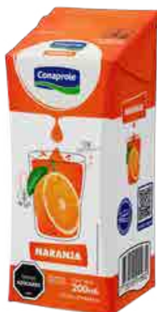
Jugo Naranja Cont. Neto 250 ml