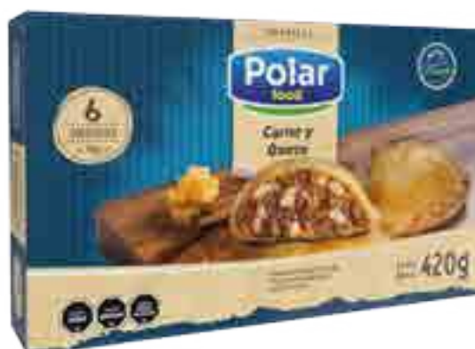
Empanadas Carne y Queso 6 unidades Cont. Neto 420 grs