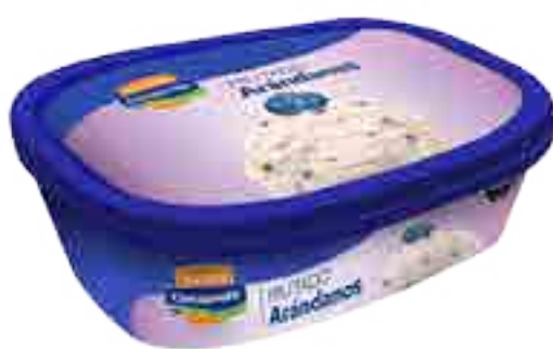
Helado Arándanos Cont. Neto 1 Litro