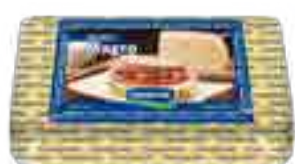
Queso Magro Cont. Aprox 1 kg