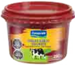
Dulce Crema de Leche Cont. Neto 250 grs