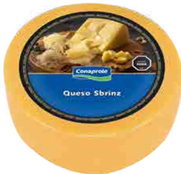
Queso Sbrinz Cont. Aprox 7 kg