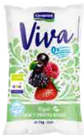
Viva Açaí y Frutos Rojos Cont. Neto 1 kg