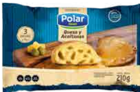
Empanadas Queso y Aceitunas 3 unidades Cont. Neto 210 grs