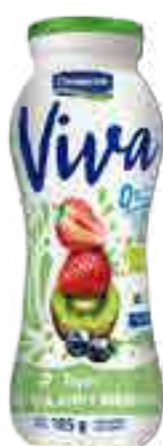
Viva Frutilla, Kiwi y Arándano Cont. Neto 185 grs