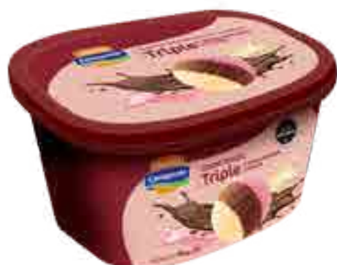
Helado Crema, Frutilla y Chocolate Cont. Neto 2 Litros