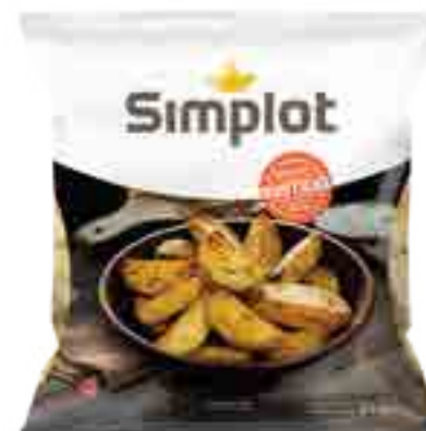
Papas Rústicas Cont. Neto 2 kg