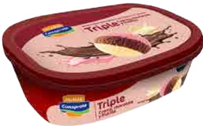
Helado Crema, Frutilla y Chocolate Cont. Neto 1 Litro