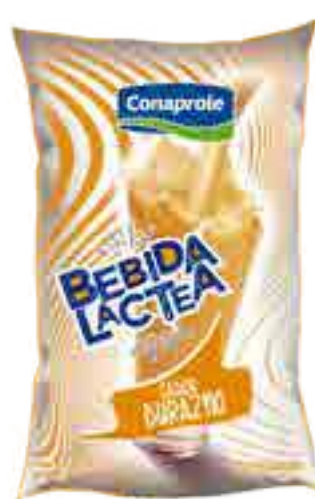
Bebida Láctea Durazno Cont. Neto 1 Litro