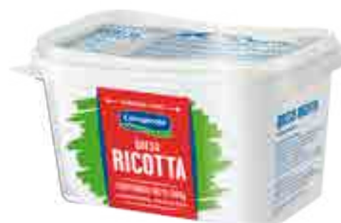
Queso Ricotta Cont. Neto 500 grs