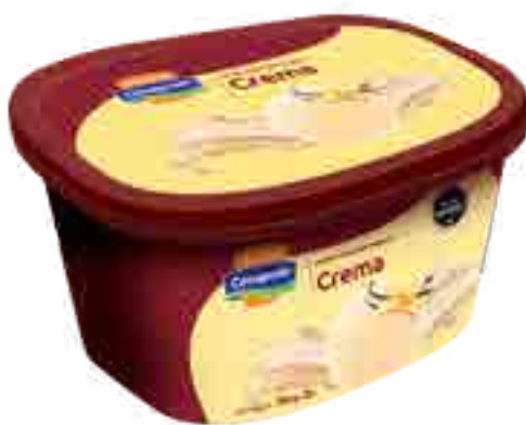
Helado Crema Cont. Neto 2 Litros