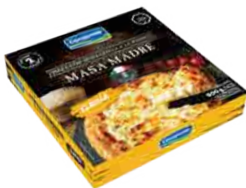
Pizza Masa Madre 2 Unidades Cont. Neto 900 grs