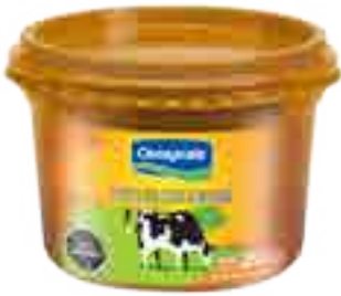
Clásico Cont. Neto 250 grs