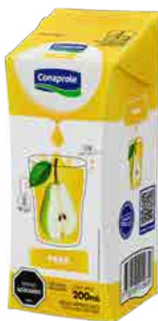
Jugo Pera Cont. Neto 250 ml