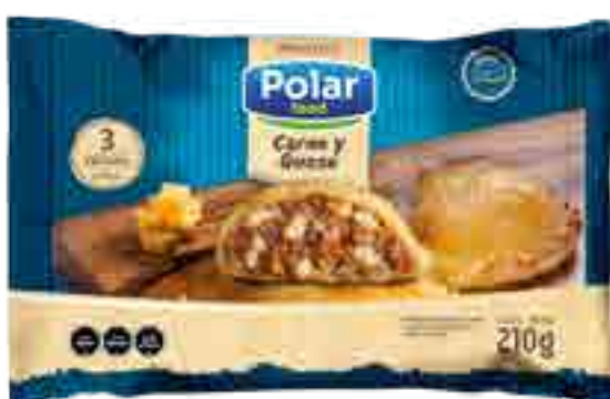
Empanadas Carne y queso 3 unidades Cont. Neto 210 grs