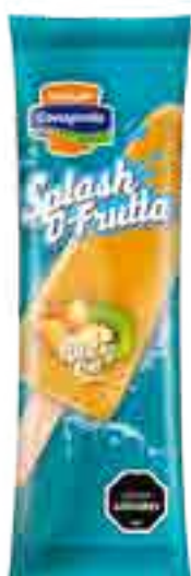
Splash D-Fruta Durazno-Kiwi Cont. Neto 56 grs