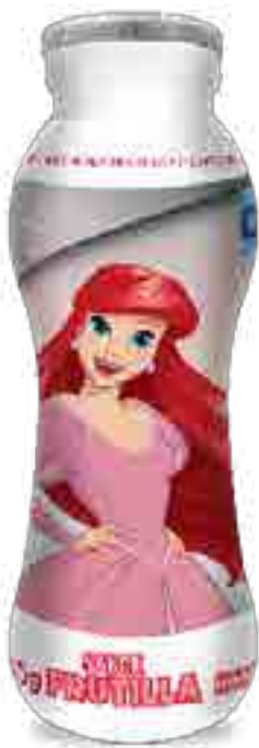
Conamigos Frutilla Cont. Neto 185 grs