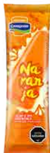
Helado de Naranja Cont. Neto 58 grs