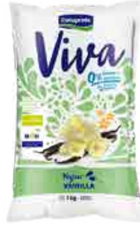
Viva Vainilla Cont. Neto 1 kg