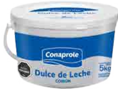
Dulce de Leche Común Cont. Neto 5 kg