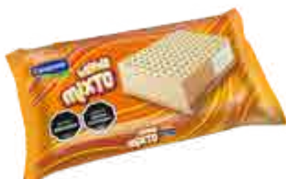
Mixto: Dulce de Leche y Crema Cont. Neto 75 grs