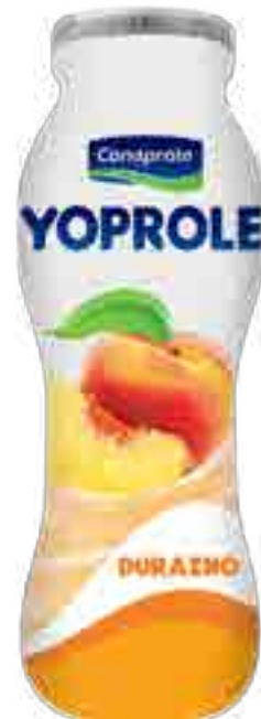
Yoprole Durazno Cont. Neto 185 grs