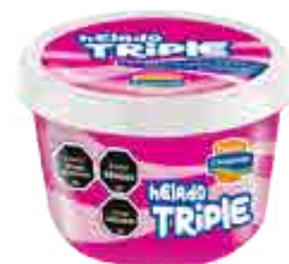
Helado Crema, Frutilla y Chocolate Cont. Neto 250 ml