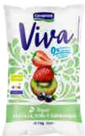
Viva Frutilla, Kiwi y Arándanos Cont. Neto 1 kg