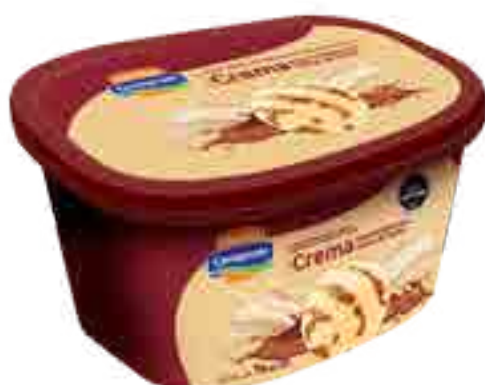
Helado Crema Marmolada con Dulce de Leche Cont. Neto 2 Litros