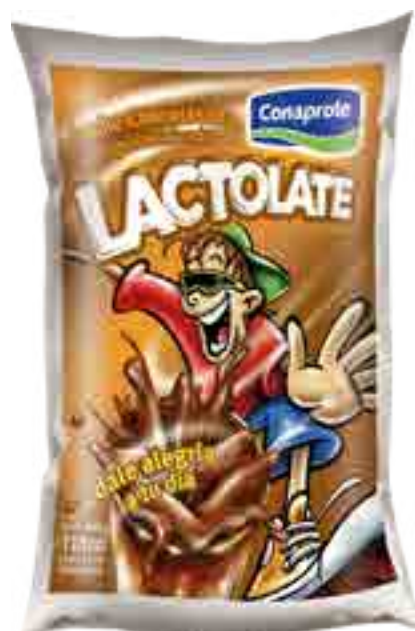
Lactolate Cont. Neto 1 Litro