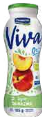
Viva Durazno Cont. Neto 185 grs