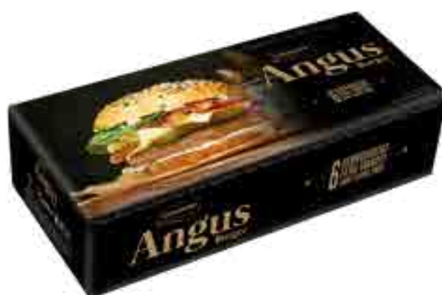
Hamburguesa Angus Cont. Neto 600 grs