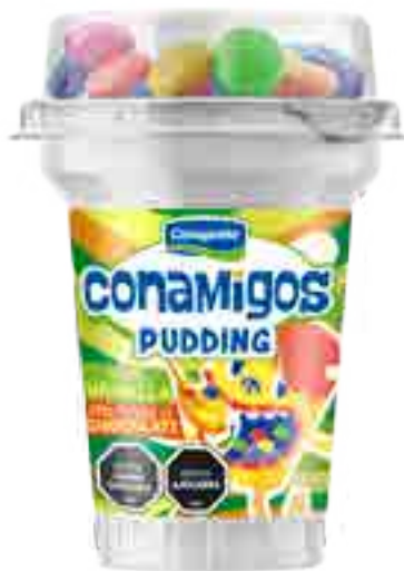
Pudding Vainilla con Discos de Chocolate Cont. Neto 130 grs