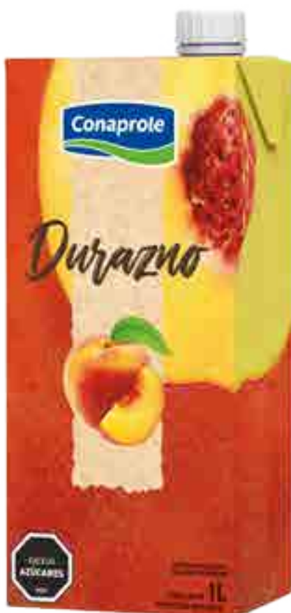
Jugo Durazno Cont. Neto 1 litro