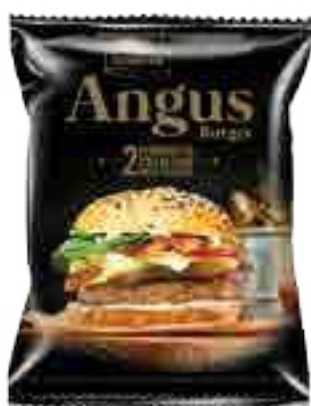
Hamburguesa Angus Cont. Neto 200 grs