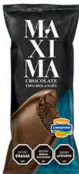
Maxima Chocolate tipo Holandés Cont. Neto 65 grs