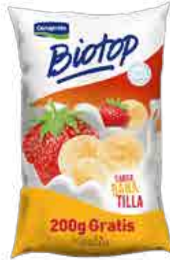
Biotop Banatilla Cont. Neto 1,2 kg