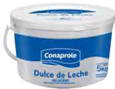
Dulce de Leche Tipo Argentino Cont. Neto 5 kg