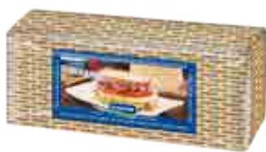
Queso Magro Cont. Aprox 2,8 kg