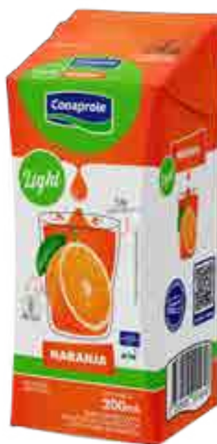
Jugo Naranja Light Cont. Neto 250 ml