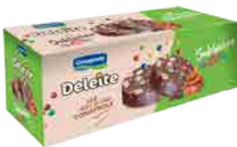
Salchich3n con Confites Cont. Neto 500 grs