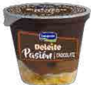
Pasi3n Chocolate Cont. Neto 100 grs