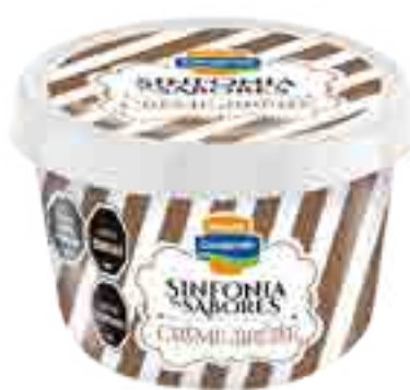
Crème Brûlée Cont. Neto 250 ml