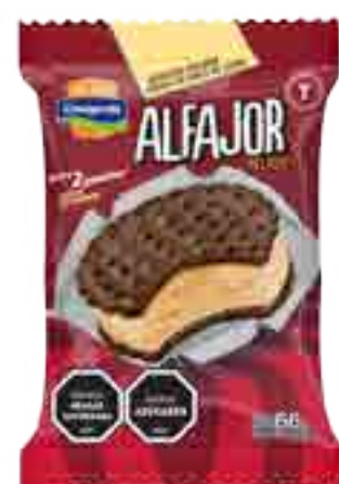
Alfajor Dulce de Leche Cont. Neto 66 grs