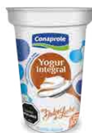
Integral con Dulce de Leche Cont. Neto 200 grs