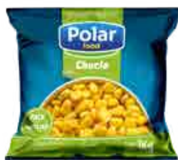
Choclo Cont. Neto 1 kg