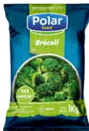
Brócoli Cont. Neto 1 kg