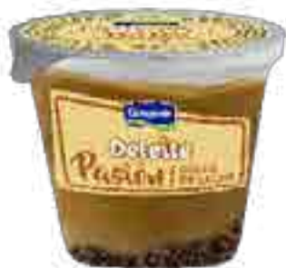
Pasi3n Dulce de Leche Cont. Neto 100 grs