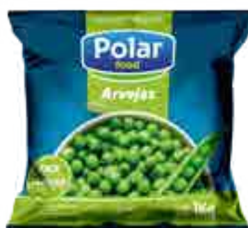
Arvejas Cont. Neto 1 kg