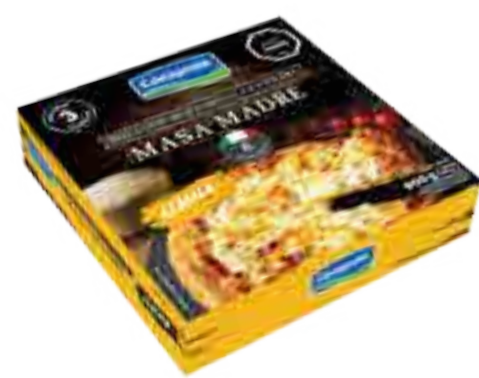
Pizza Masa Madre 3 Unidades Cont. Neto 600 grs