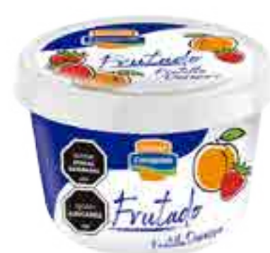
Helado Frutado Frutilla/Durazno Cont. Neto 250 ml