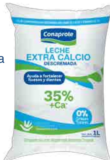
Leche Descremada Extra Calcio Cont. Neto 1 Litro