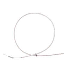
Bremskabel für den Umbau zur Einhandbremse 0,00 €