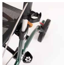
Stockhalter 19,00 €