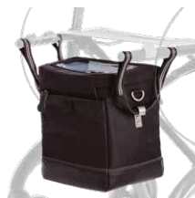
JOST-Tasche schwarz 129,00 €