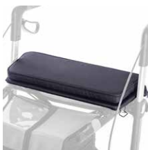
Fester Sitz 59,00 €