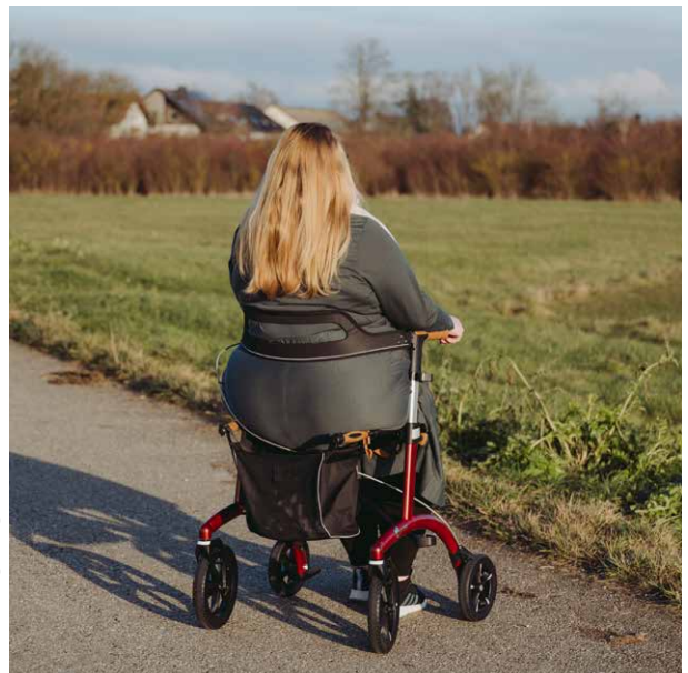
Abbildung zeigt AR62W

Saljol Premium Rollatoren sind in zwei Größen, edlen Farben und zusätzlich mit breiterer Sitzfläche (52 cm) und höherer Tragkraft (180 kg) erhältlich. So haben Sie die Möglichkeit, genau die Lösung zu wählen, die optimal zu Ihren Bedürfnissen und Ihrem persönlichen Geschmack passt. Ob für mehr Komfort, Funktionalität oder Stil – Sie finden die perfekte Kombination, die Ihren Anforderungen gerecht wird.