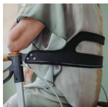
Rückengurt 49,00 €