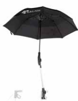
Schirm schwarz 89,00 €