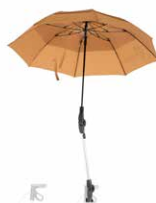
Schirm karamell 89,00 €