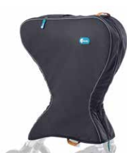
Transporttasche 89,00 €