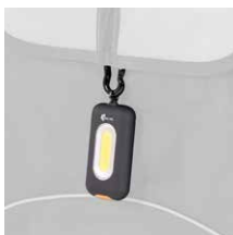
LED-Licht 10,00 €