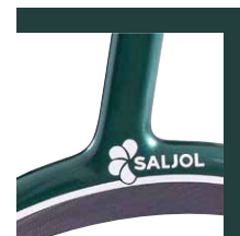
British Racing Green