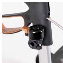
Klingel 19,00 €