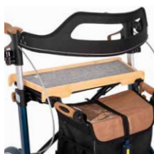
Holztablett mit Filzauflage 69,00 €