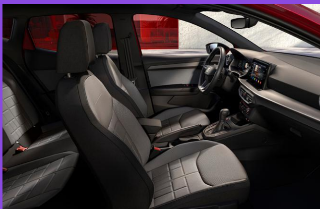
Sedili anteriori riscaldabili separatamente