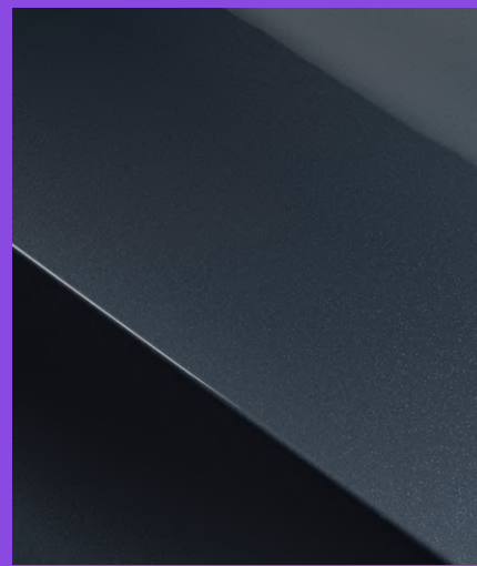
MAGNETIC GREY metallic