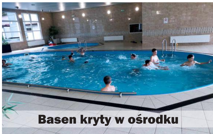
Basen kryty w ośrodku