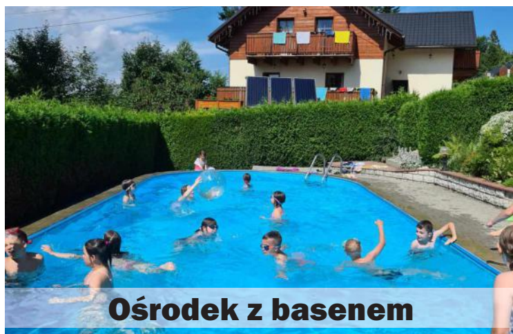
Ośrodek z basenem