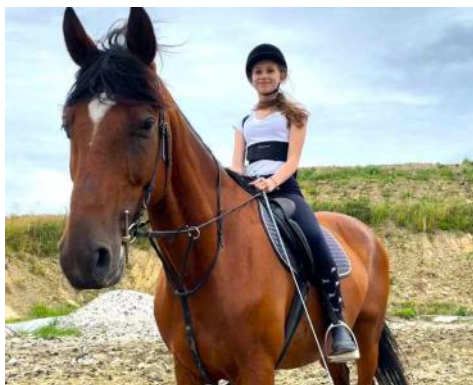
WAKACJE W SIODLE