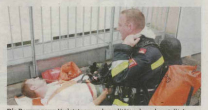
Die Bergung von Verletzten wurde realitätsnah nachgestellt. Insgesamt waren 120 Statisten und Einsatzkräfte vor Ort.

SCHÄRDING (juk). Am LKH Schärding fand vergangenes Wochenende eine groß angelegte Einsatzübung unter der Beteiligung der Feuerwehren Schärding, Sankt Florian, Brunenthal, Suben und Pocking (Bayern) sowie Einsatzkräften von Rotem Kreuz und Polizei statt. Das Szenario: Ein Brand in der Lüftungszentrale des dritten Stockes, der Rauch schlägt auf Patientenzimmer über. Schnelles Handeln ist gefragt. Die Atemschutztruppe muss neben der Bekämpfung des Brandes einen verletzten Patienten evakuieren und die Pati-