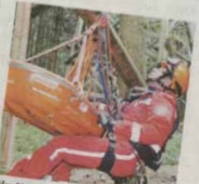
Ein Verletzter wird vom Höhenretter gerettet.

reitet zu werden. Dabei waren Konzentration, Genauigkeit und Teamfähigkeit gefragt. Die Rettung aus Höhen und Tiefen benötigt nicht nur eine Spezialausbildung, sondern auch Spezialausrüstung, Material und Funktion sind abgestimmt und bedürfen einer regelmäßigen Wartung. Die Fortbildung absolvierten die Männer in ihrer Freizeit und waren mit Herzblut bei der Sache. Und weil auch der