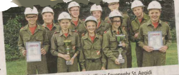
Die erfolgreichen Jungflorianis der Freiwilligen Feuerwehr St. Aegidi.

14 Feuerwehrtrupps der verschiedenen Aufgabenstellungen mussten sich an vier Stationen bewähren. Die Schnelligkeit ist dabei nicht alles, sondern auch die Genauigkeit und die Teamarbeit spielen eine wichtige Rolle.