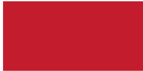
Rojo fuego / Vermelho fogo