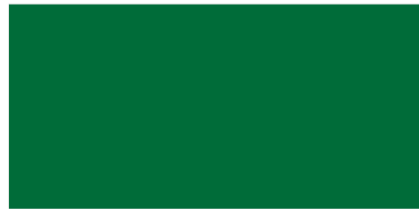
Verde frontón / Verde frontão