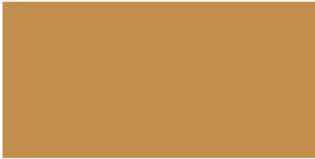
Ocre / Ocre