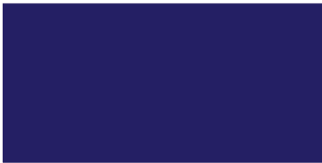
Azul ultramar / Azul ultramar