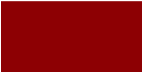
Rojo inglés / Vermelho inglês