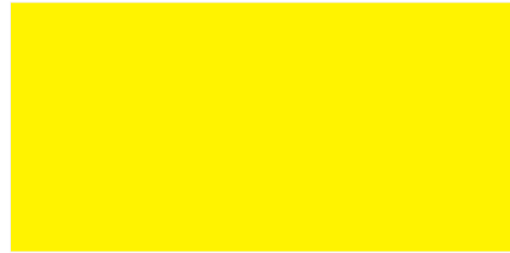
Amarillo sol / Amarelo sol