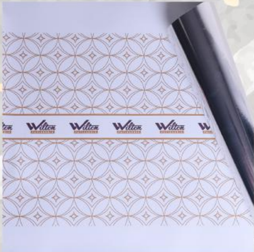
White / Άσπρο Wilton

Μόνο για Αμυγδαλότο, Milk Star, Malibu, Toffee