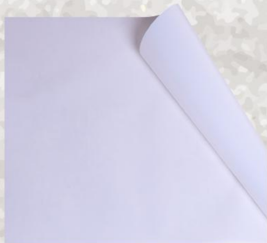
White / Άσπρο