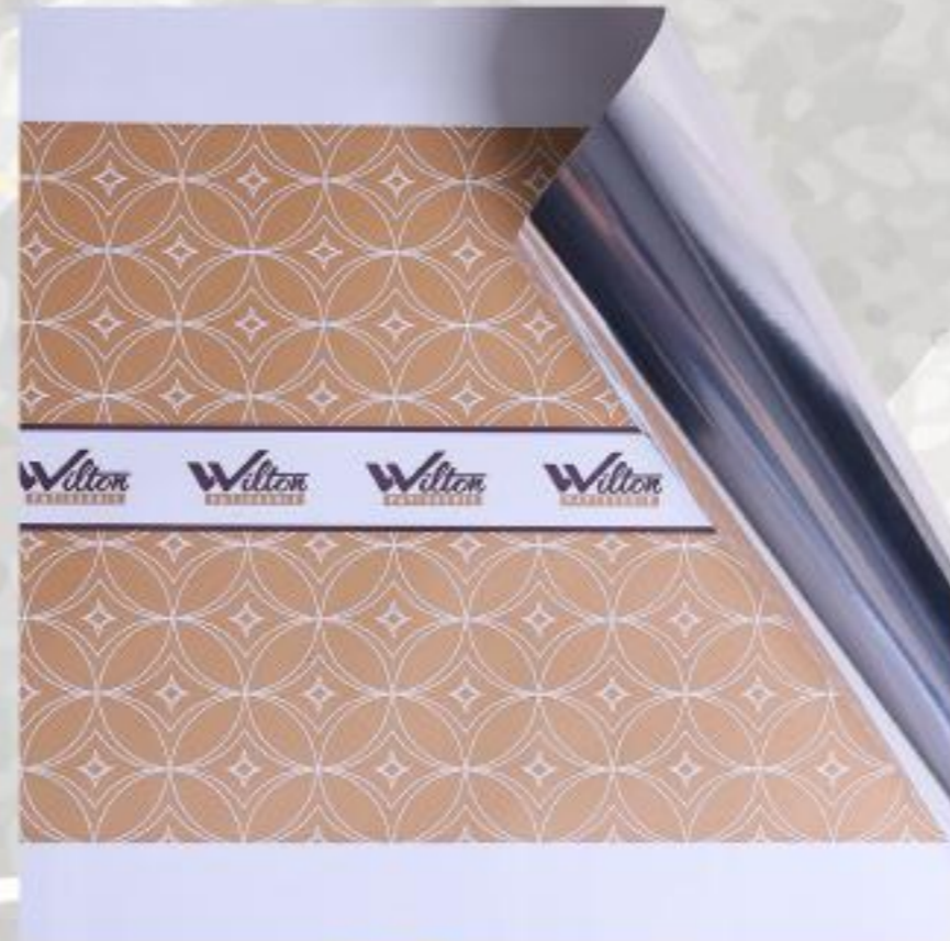
Gold / Χρυσό Wilton