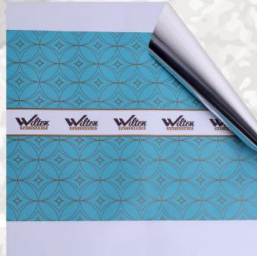
Turquoise / Τρκουάζ Wilton