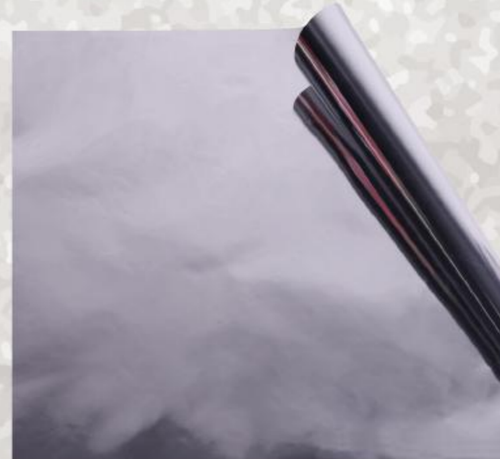
Silver / Ασημί