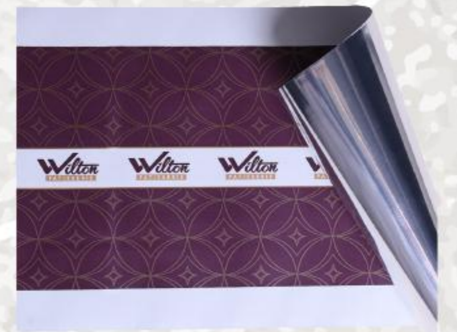
Bordeaux / Μπορντό Wilton