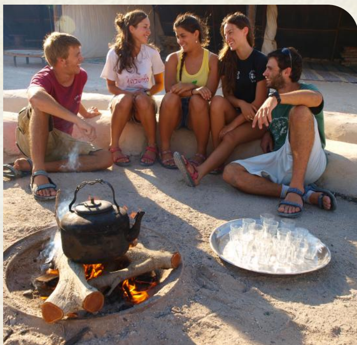
צילום: טל גליק | ברד וויט