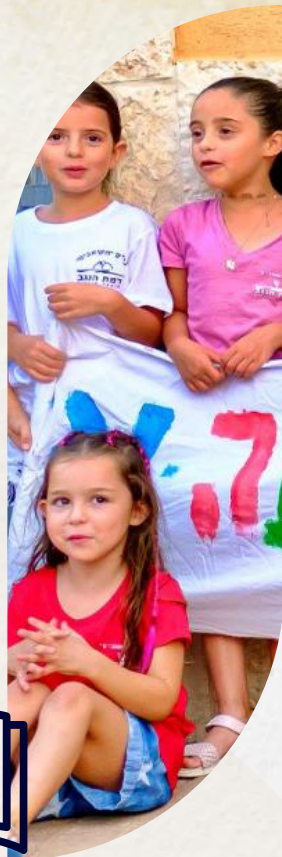
צילום: צביקה טוכטרמן | גידר וויט