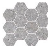
HEXA NATIVE GREY