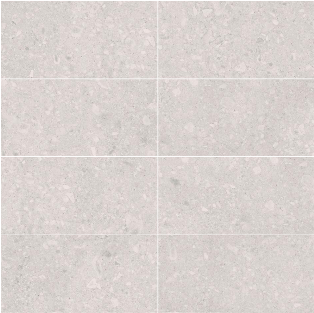
59,5 x 119,2 R Native Grey