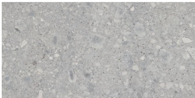
59,5 x 119,2 R / 23,4" x 49,6"