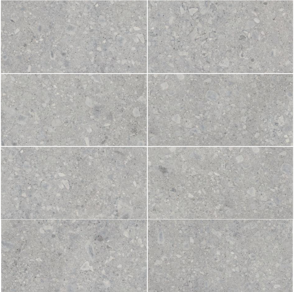
59,5 x 119,2 R Native Grey