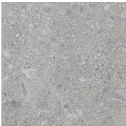
90 x 90 R / 35,4" x 35,4"