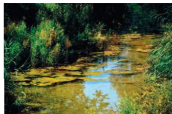
Riu Corb a Vallfogona de Riucorb