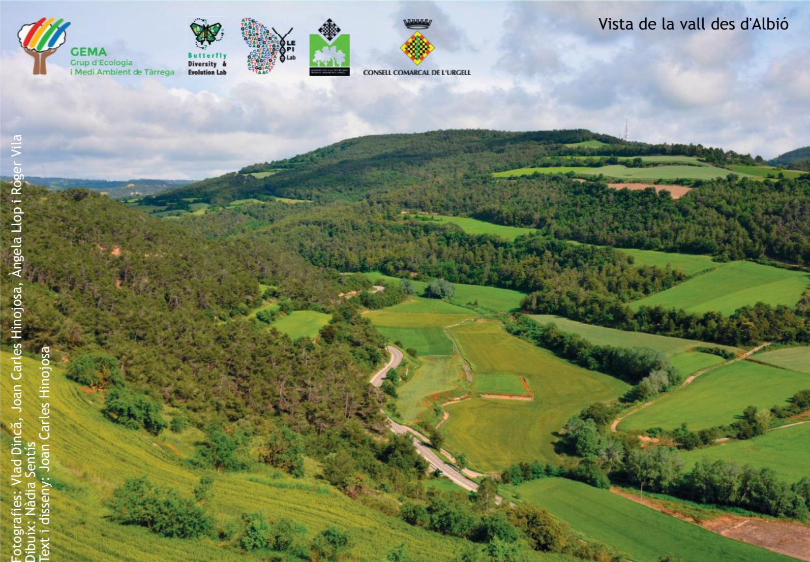
Vista de la vall des d'Albió