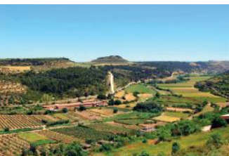
Vista de la vall des de Ciutadilla