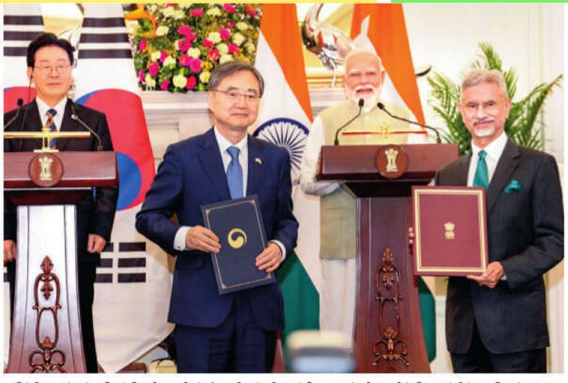
இந்தியா வந்துள்ள தென்கொரிய அதிபர் லீ ஜா மியூய், பிரதமர் மோடி முன்னிலையில் இருதரப்பில் கையொப்பமான ஒப்பந்தத்தை பரிமாறிக் கொண்டு இரு நாடுகளின் வெளியுறவு அமைச்சர்கள்.

பெற்றன. கணினி சிப்கள் முதல், சுப்பகன் வரை மற்றும் அறிவுசார் நிபுணர்கள் முதல் தொழில்நுட்பம் வரை, சுற்றுச்சூழல் முதல் எரிசக்தி வரை என ஒவ்வொரு துறையிலும் ஒத்துழைப்புக்கான புதிய வாய்ப்புகள் இருதரப்பிற்கும் உருவாகின. ஒருங்கிணைந்த இந்திய-பிரேசிய பிராந்திய அமைதி மற்றும் மேம்பாட்டிலும் இரு நாடுகளும் தொடர்ந்து பங்களிப்பார்கள். இருதரப்பு வர்த்தகம், முதலீடுகள், சேற்கை, துறைமுகம், ரெய்லேய், ரெய்லேய்-கூடர், முக்கிய மற்றும் வளர்ந்துவரும் தொழில்நுட்பங்கள் மற்றும் மக்களுக்கு இடையேயான உறவுகள் உள்ளிட்ட துறைகளில் இருதரப்பு உறவை மேலும் விரிவுபடுத்துவது குறித்தும் இந்த பேச்சுவார்த்தையில் ஆலோசனை செய்யப்பட்டது என்று குறிப்பிடப்பட்டுள்ளது. இருதரப்பு பேச்சுவார்த்தை குறித்து மத்திய வர்த்தகம் மற்றும் தொழில் துறை அமைச்சர் பியூஷ் சோயல் கூறியதாவது: இந்தியா-கொரியா இடையே