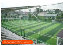
Lapangan Mini Soccer