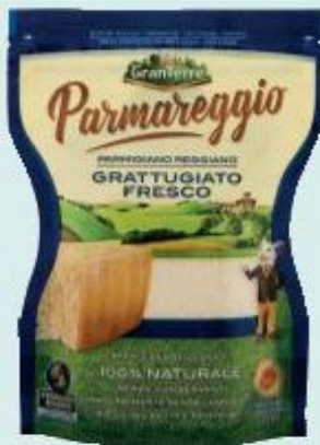
GRAN TERRE PARMAREGGIO PARMIGIANO REGGIANO GRATTUGIATO BUSTA - 60 G