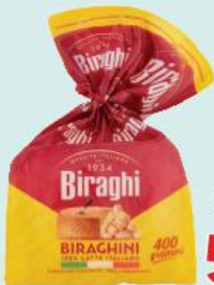
BIRAGHI BIRAGHINI 400 G