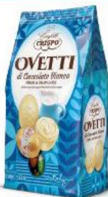
CRISPO OVETTI DI CIOCCOLATO BIANCO RIPIENI DI CREMA AL LATTE 150 G