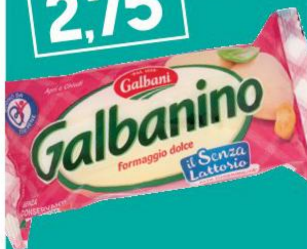
GALBANI GALBANINO SENZA LATTOSIO 230 G