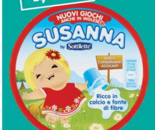
SOTTILETTE SUSANNA FORMAGGINI 140 G