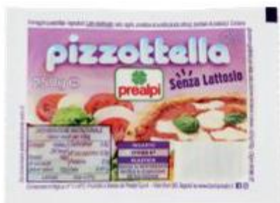
PREALPI PIZZOTTELLA SENZA LATTOSIO 250 G