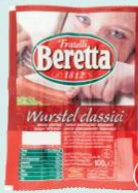
BERETTA WURSTEL CLASSICI 100 G