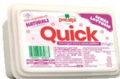
PREALPI QUICK SENZA LATTOSIO 100 G