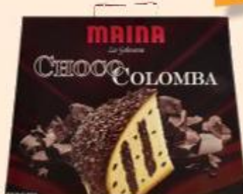
MAINA CHOCO COLOMBA FARCITA CON GOCCE DI CIOCCOLATO 750 G