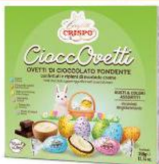
CRISPO CIOCCOVETTI CONFEZIONE - 350 G