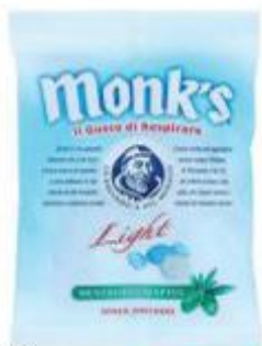
MONK'S LIGHT MENTO E EUCALIPTO 80 G