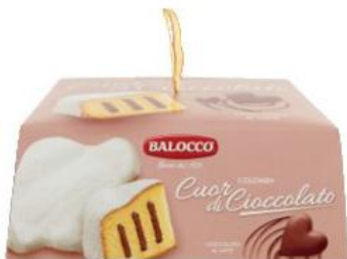
BALOCCO COLOMBA CUOR DI CIOCCOLATO 750 G