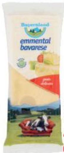
BAYERNLAND EMMENTAL BAVARESE 250 G