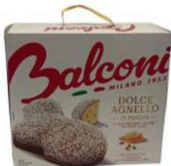
BALCONI DOLCE AGNELLO 750 G