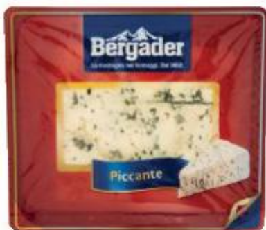
BERGADER FORMAGGIO PICCANTE VASCHETTA - 100 G