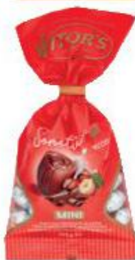
WITOR'S OVETTI DI CIOCCOLATO AL LATTE RIPIENI ALLA NOCCIOLA 115 G