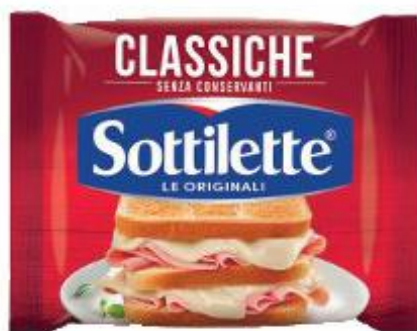
SOTTILETTE CLASSICHE 400 G