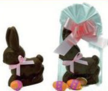
GRECO CONIGLIO DI CIOCCOLATO BUSTA - 200 G