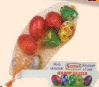
SORINI SORINI CIOCCOLATINI ASSORTITI MISTI PASQUA - 70 G