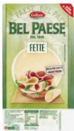
GALBANI BEL PAESE A FETTE 120 G