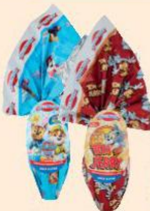
DOLCI PREZIOSI OVO DI CIOCCOLATO PAW PATROL/ TOM & JERRY 150 G