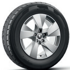
Jantes en alliage léger 7,0J x 17" «Paget», argent