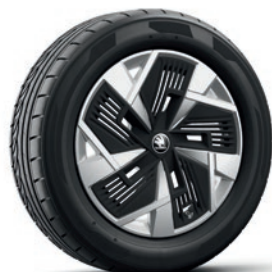
Jantes en alliage léger 7,0 J x 18" «Mazeno», argent con superficie lucidata et panneau «Aero»