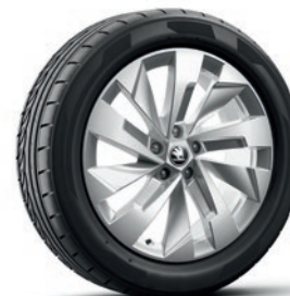
Jantes en alliage léger 7,0J x 19" «Rapeto», argent con superficie lucidata