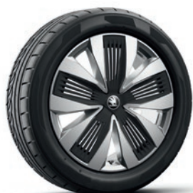
Jantes en alliage léger 7,0J x 19" «Talgar», argent con superficie lucidata et panneau «Aero»