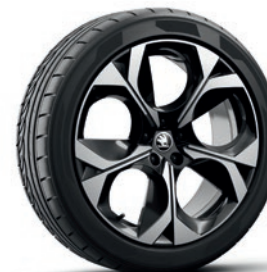
Jantes en alliage léger 8,0J x 20" «Elias», noir con superficie lucidata

Les prix s'entendent en CHF et incluent 8.1% TVA. Certains des équipements optionnels mentionnés ci-dessus ne peuvent être commandés qu'en association avec d'autres équipements supplémentaires. De plus, lesdits équipements optionnels ne peuvent pas tous être combinés entre eux. Veuillez contacter votre partenaire Škoda pour de plus amples informations.