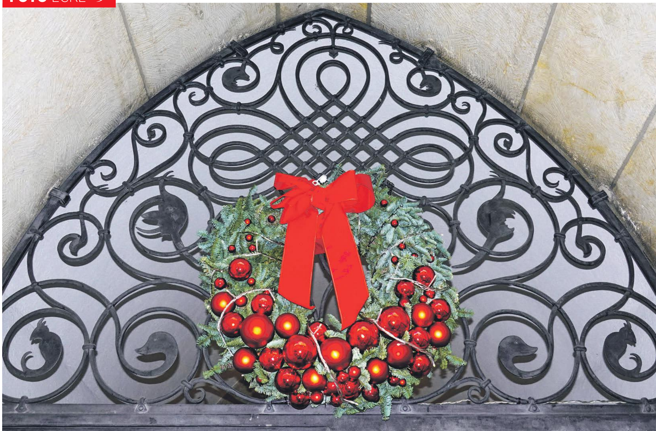
Eingang Rathaus Büren