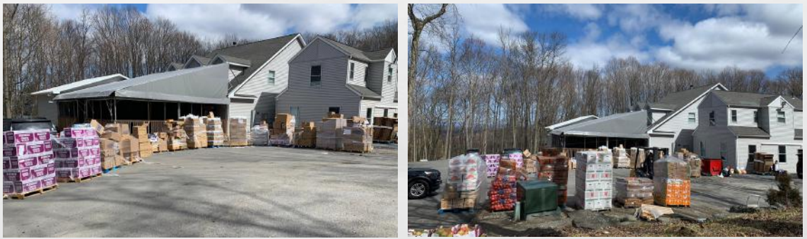
מ'גרייט צו צום גרויסארטיגן מענא פסח פראגראם אין הויף פונעם זמיגראדער ביהמ"ד

באזונדער איז באגריסט געווארן די געלונגענע שטאב פון טאלאנטפולע לערעריןס, אויסנאמליכע רייכע אקטיוועטעטן און אינהאלטספולע אונטערהאלטונגען און די פונקטליכע טיר - צו טיר טראנספארטאציע מיט אן ערשט - קלאסיגע סערוויס צו אלעמענס צופרידנהייט.