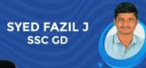
SYED FAZIL J SSC GD