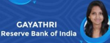
GAYATHRI Reserve Bank of India