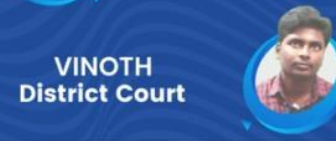
VINOTH District Court