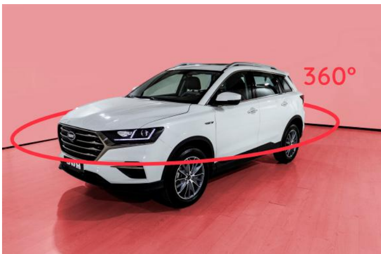
Imagen completa con cámara 360°HD

Equipado con 6 airbags distribuidos en las zonas frontales y laterales envolventes que proporcionan protección más efectiva.