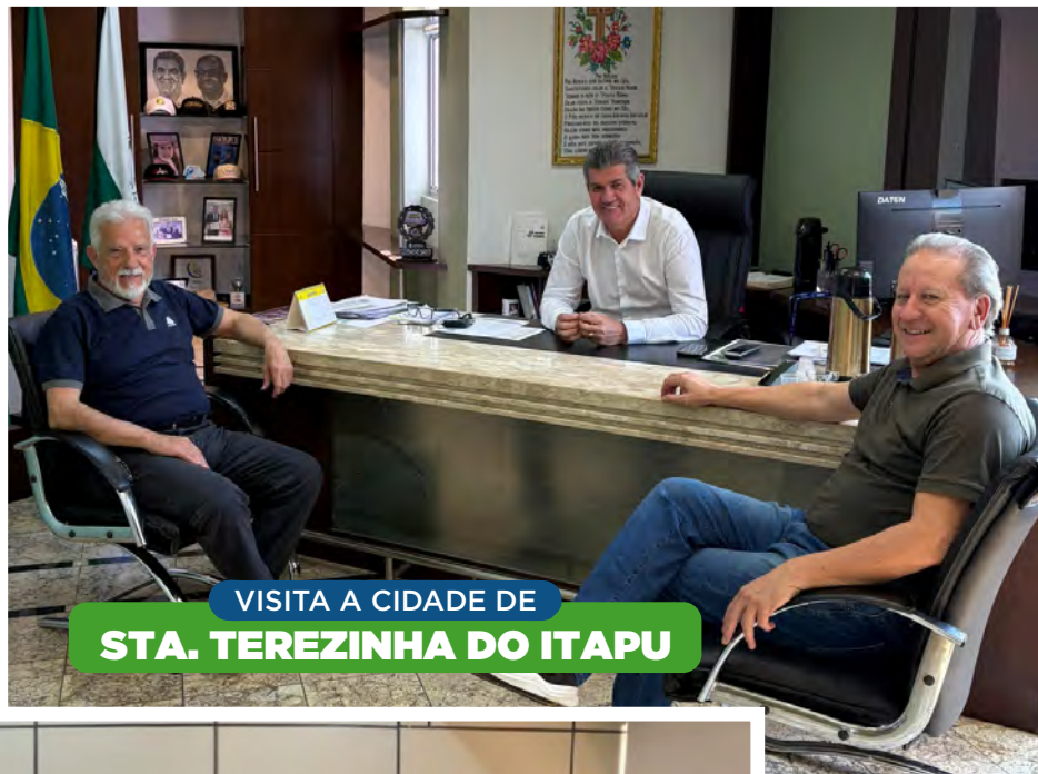
VISITA A CIDADE DE STA. TEREZINHA DO ITAPU