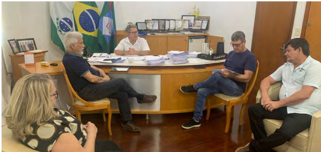
VISITA A CIDADE DE MISSAL