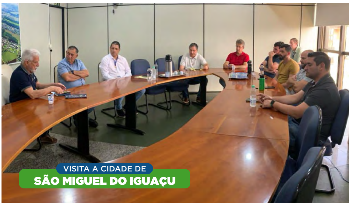
VISITA A CIDADE DE SÃO MIGUEL DO IGUAÇU