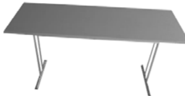
Mesa Buffet / Buffet Table