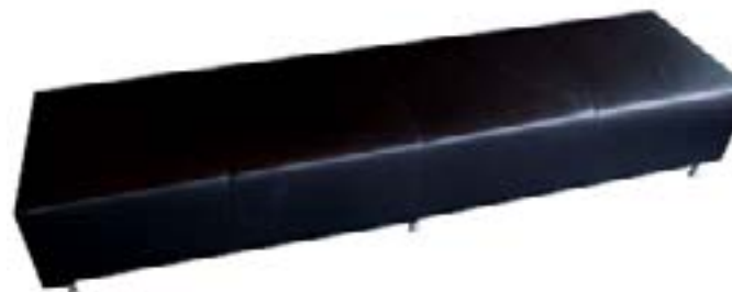
Banqueta Cuero Negro (4 pax) / Black Leather Bench (4 pax)