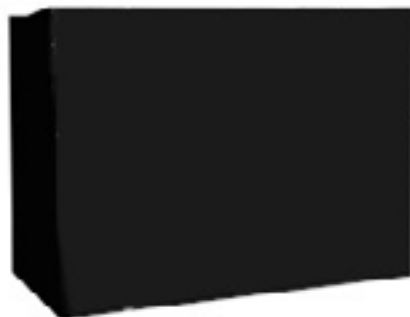
Panel Cierre Negro / Black Cover Panel