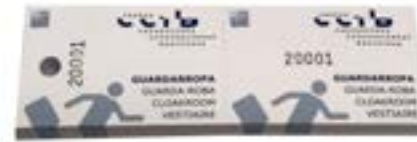
Tiquets guardarropía / Cloakroom Tickets

Cada talonario contiene 100 unidades Each ticket book includes 100 units