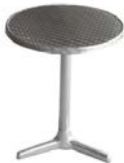
Mesa Terraza Aluminio / Outdoor Aluminium Table