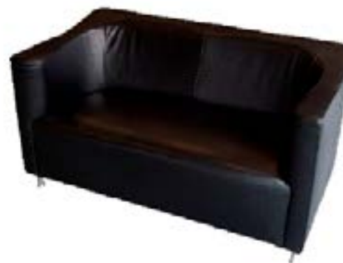
Sofá Cuero Negro (2 pax) / Black Leather Sofa (2 pax)