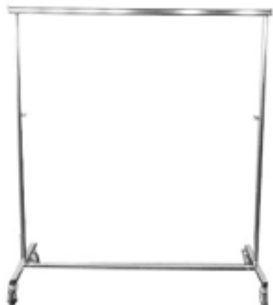
Burro + Perchas / Coat Rail + Hangers ril