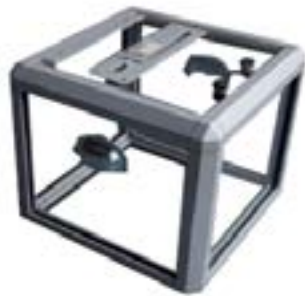
Urna / Ballot Box