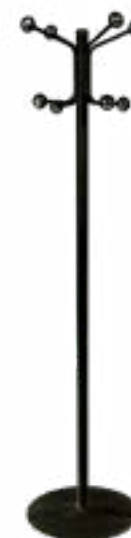
Perchero de Pie / Coat Stand