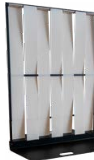
Biombo/ Folding Screen