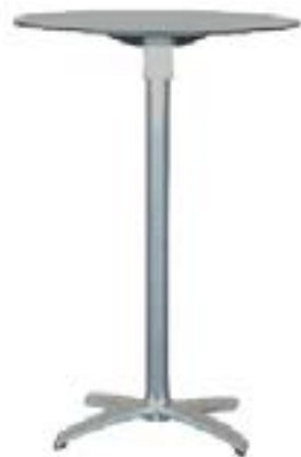
Mesa Redonda Alta / High Round Cocktail Table