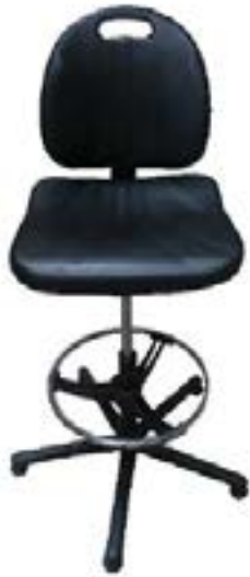
Taburete Azafata Kastel / Kastel Hostess Stool