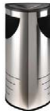
Papelera Cenicero / Ashtray Bin