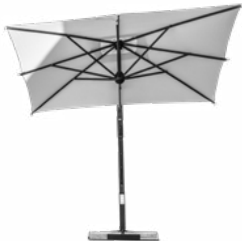
Parasol / Sunshade