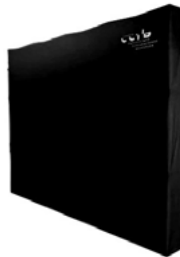
Biombo Negro Extensible / Expandable Black Screen