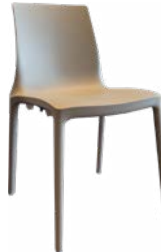
Silla Plastico Twin Capuccino / Plastic Chair