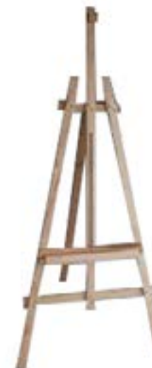
Caballete Madera / Wooden Easel