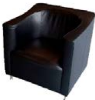
Sillón Cuero Negro / Black Leather Armchair