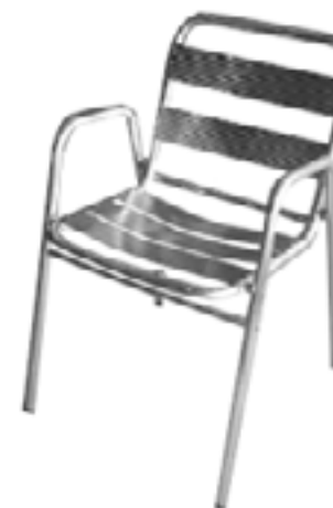
Silla Terraza Aluminio / Outdoor Aluminium Chair