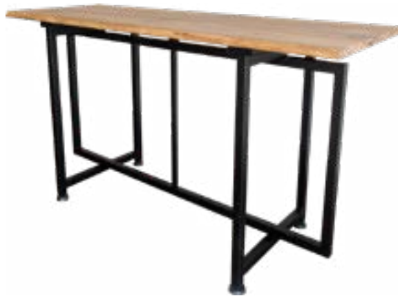
Mesa Buffet Rústica / Rustic Buffet Table