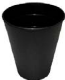
Papelera Oficina / Office Paper Bin