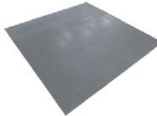
Pista de Baile / Dance Floor