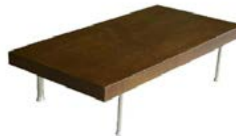
Mesa Baja Rectangular Havana / Low Rectangular Havana Table