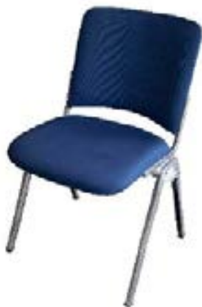
Silla Reunión Azul / Blue Conference Chair