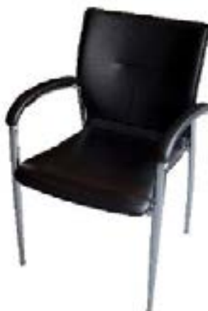
Silla Presidencia Cuero / Leather Presidential Chair