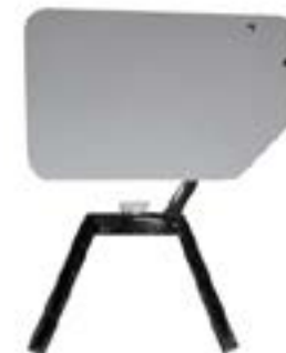
Tablilla Escritorio / Writing Tablet