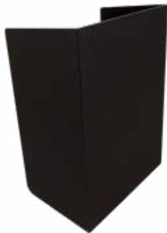
Atril Diseño / Design Lectern