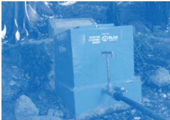
Sumber Mata Air