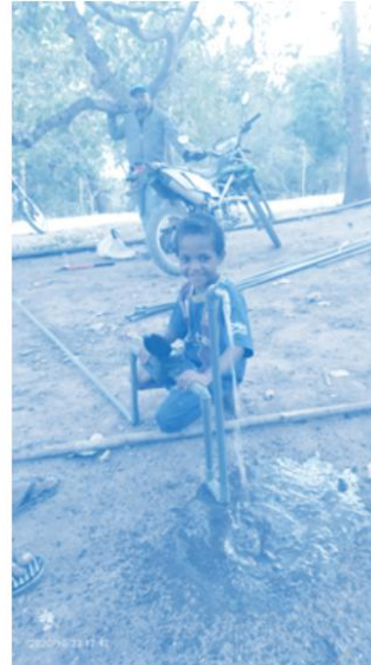
Air telah sampai ke rumah warga