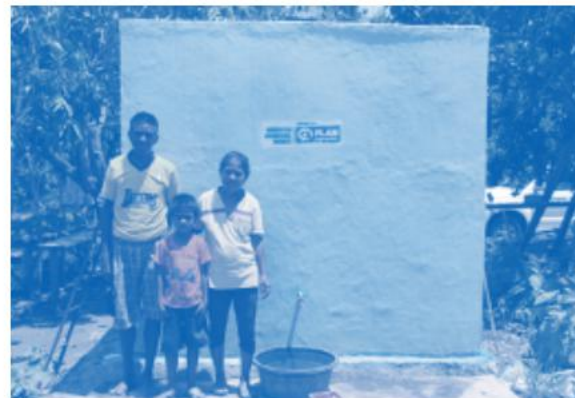
Bak Penampung Air Hujan