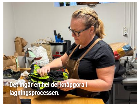
Det ingår en hel del knåpgöra i lagningsprocessen.