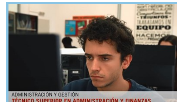
ADMINISTRACIÓN Y GESTIÓN TÉCNICO SUPERIOR EN ADMINISTRACIÓN Y FINANZAS