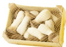
Caja de 1 kg / 1 kg box

La seta de cardo ( Pleurotus eryngii ) tiene un alto contenido de vitaminas B2 y B3, lo que la convierte en una aliada para el equilibrio de la presión sanguínea. Al ser un 91,4% agua, su consumo contribuye a la correcta hidratación de nuestro organismo.