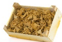
Caja de 1 kg / 1 kg box