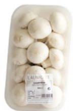
Bandeja / Caja de 8 u. Tray / 8 unit box