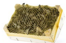
Caja de 1 kg / 1 kg box