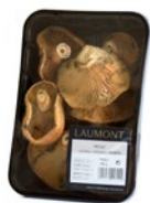
Bandeja / Tray