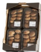
Caja de 4 u. / 4 unit box