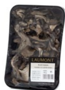
Bandeja / Tray