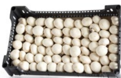
A granel / In bulk