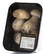
Bandeja / Tray