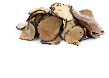
Lata 100 g / Caja 6 u. 100 g can / 6 unit box Ref.: 70036