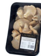
Bandeja / Tray