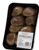
Bandeja / Tray