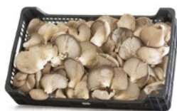
A granel / In bulk