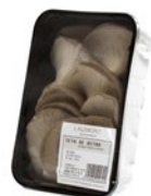
Bandeja / Caja de 8 u. Tray / 8 unit box