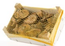
Caja de 1 kg / 1 kg box