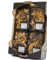
Caja de 4 u. / 4 unit box