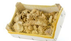
Caja de 1 kg / 1 kg box