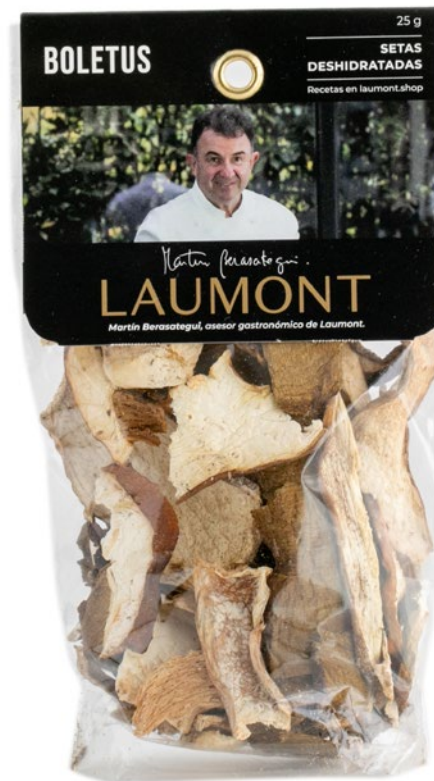
Bolsa 25 g 25 g Bag Ref.: 20916