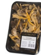
Bandeja / Tray