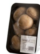
Bandeja / Caja de 8 u. Tray / 8 unit box