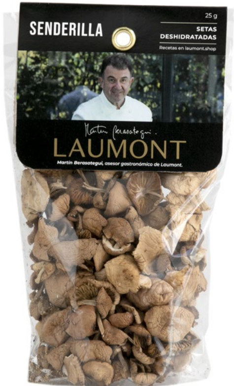
Bolsa 25 g 25 g Bag Ref.: 23116

Retail / Dehydrated / Berasategui collection