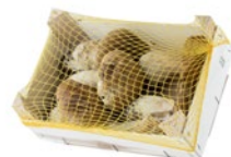
Caja de 1 kg / 1 kg box