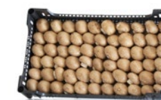
A granel / In bulk