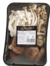
Bandeja 200 g / 200 g tray