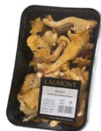
Bandeja / Tray