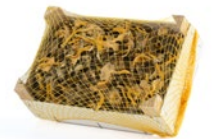
Caja de 1 kg / 1 kg box