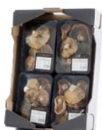
Caja de 4 u. / 4 unit box