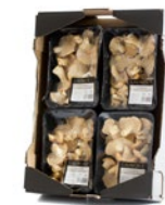
Caja de 4 u. / 4 unit box