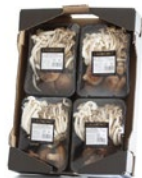
Caja de 4 u. / 4 unit box